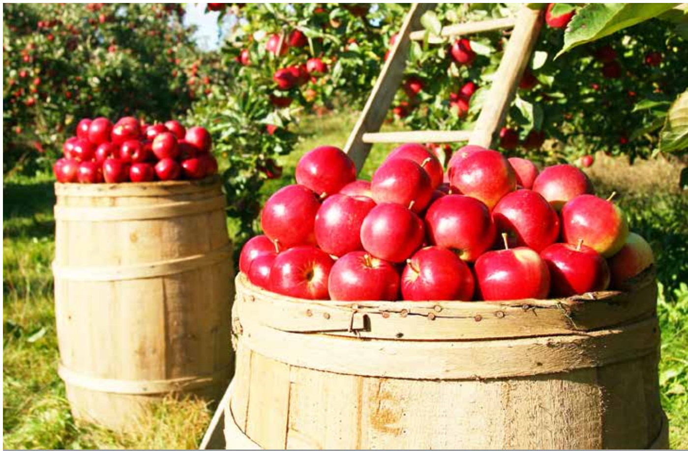
Tacksägelsedagen är den dag i kyrkoåret där man särskilt tackar för skapelsens gåvor. I församlingen bjuds till knytkalas.