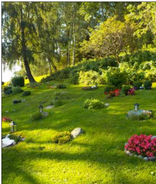
Urngravar. I en urngrav kan bara urnor grävas ner.