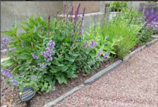
Exempel på stor perennplantering.