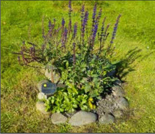
Exempel på liten perennplantering.

Påsklilja ingår och planteras på hösten och kommer upp nästkommande vår.