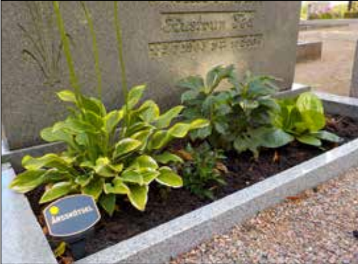
Exempel på mellanstor perennplantering.