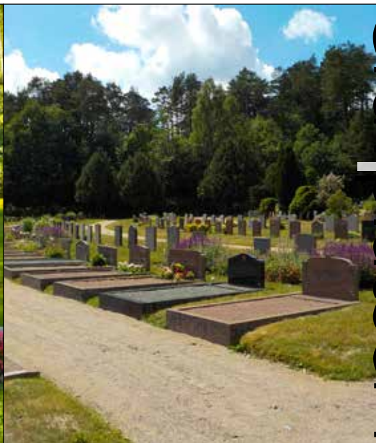
Kistgravar. I en kistgrav kan både kistor och urnor grävas ner.