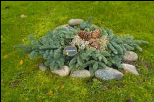
Exempel på granristäckare.