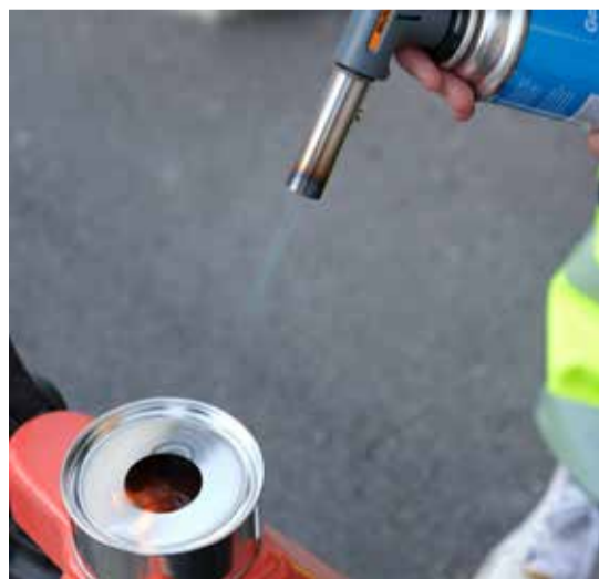
Från Hågelbyleden fram till Lilla Dalen tänds en ljusgång med marschaller.