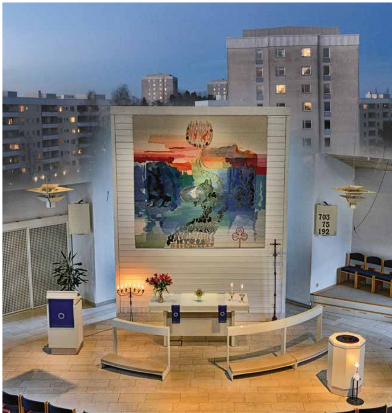
Altartavlan i Ängskyrkan är utformad av Anna-Lisa Odelqvist-Kruse och vävd av Ulla Parkdahl. Temat för altartavlan är psalm 67 där första versen lyder. "Vi är ett folk på vandring. När vägen blir tröttsam och lång, vi söker en äng och en källa, en rastplats för bön och sång."

Jag fryser, har varit ute gått i flera timmar. De korta fraserna jag utbyter med personalen, samma fraser varje dag, inger mig en känsla av trygghet. Jag sätter