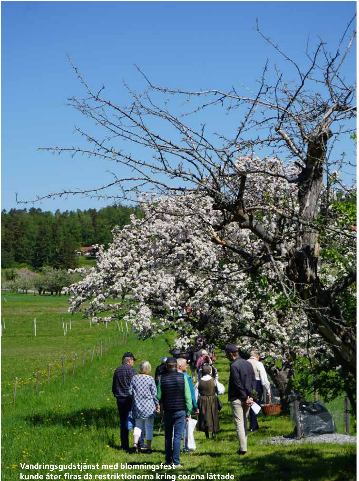
Vandringsgudstjänst med blomningsfest kunde åter firas då restriktionerna kring corona lättade