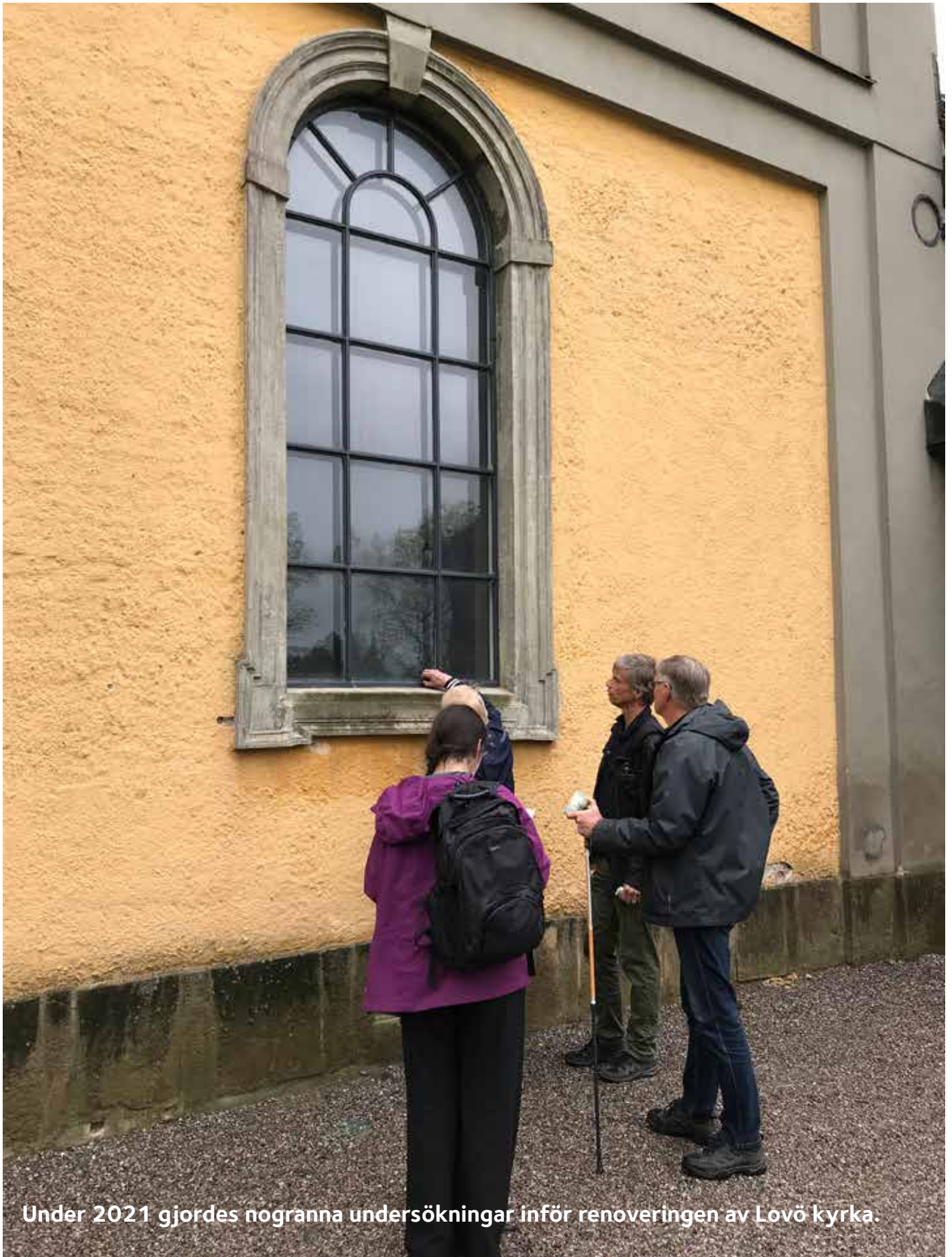
Under 2021 gjordes noggranna undersökningar inför renoveringen av Lovö kyrka.