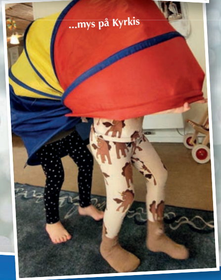
...mys på Kyrkis