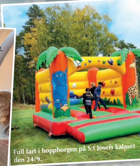
Full fart i hoppborgen på S:t Josefs kalaset den 24/9.