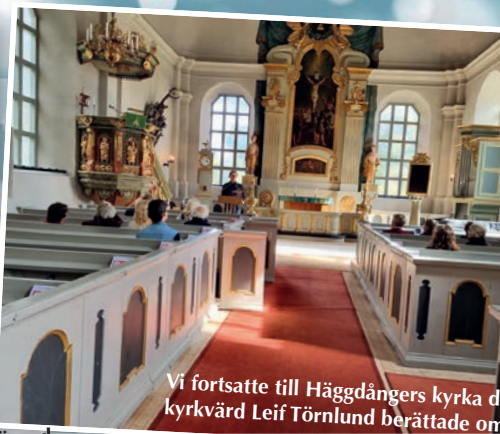
Vi fortsatte till Häggdångers kyrka där kyrkvård Leif Törnlund berättade om