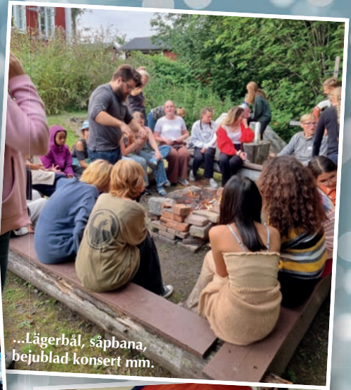
...Lägerhål, såpbana, bejublad konsert mm.