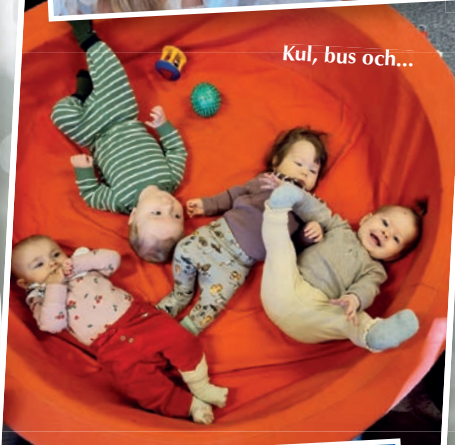
Kul, bus och...