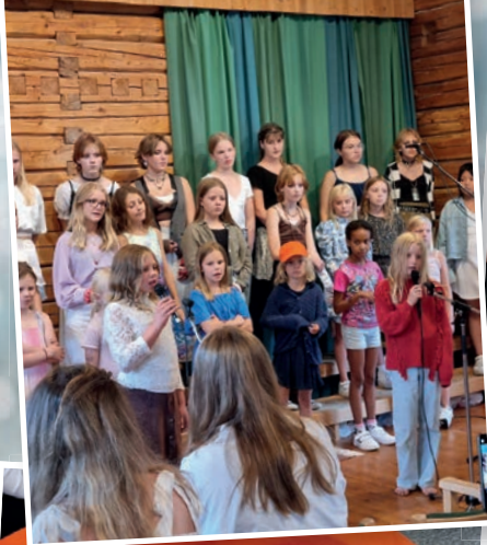
Köråger på Brogården med nya körkompisar...