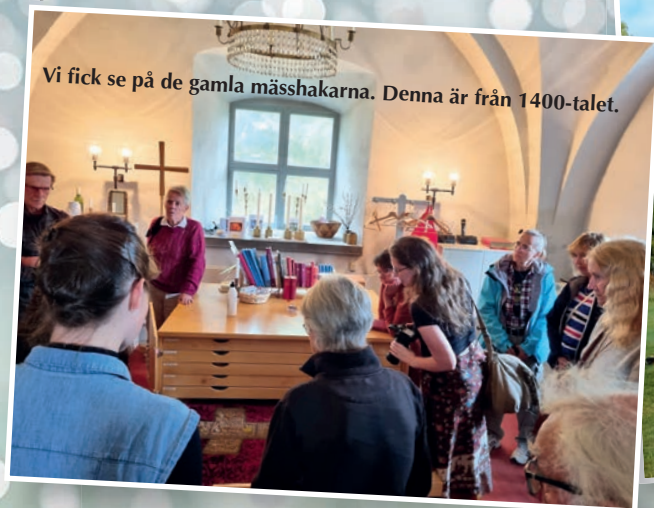
Vi fick se på de gamla mässhakarna. Denna är från 1400-talet.