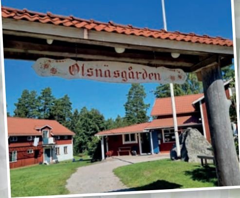
I augusti åkte vi på familjeläger till Olsnäsgården i Dalarna.