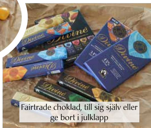
Fairtrade choklad, till sig själv eller ge bort i julklapp