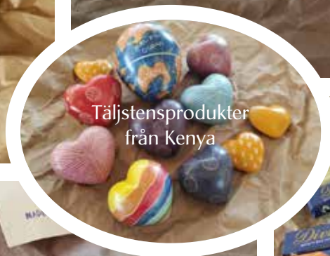
Täljstensprodukter från Kenya