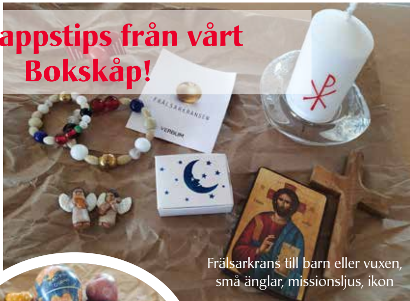
Frälsarkrans till barn eller vuxen, små änglar, missionsljus, ikon