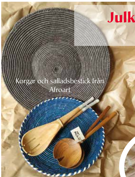
Korgar och salladsbestick från Afroart