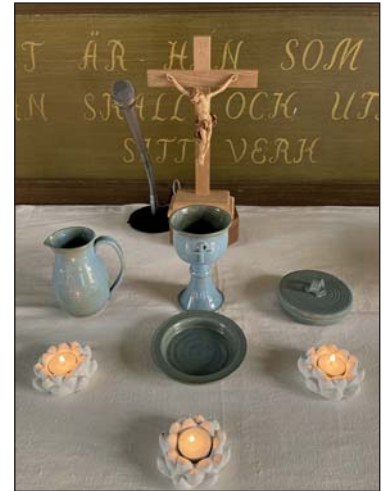
Nattvardskärnen i Lesjöfors, till vänster, och Rämmen.