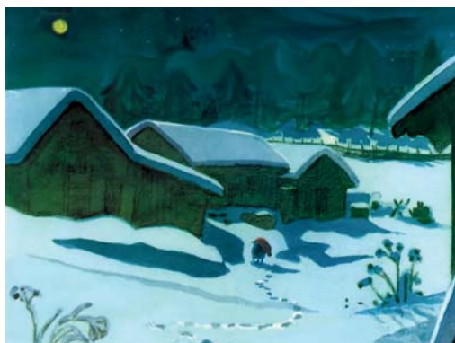
Illustration: Harald Wiberg.