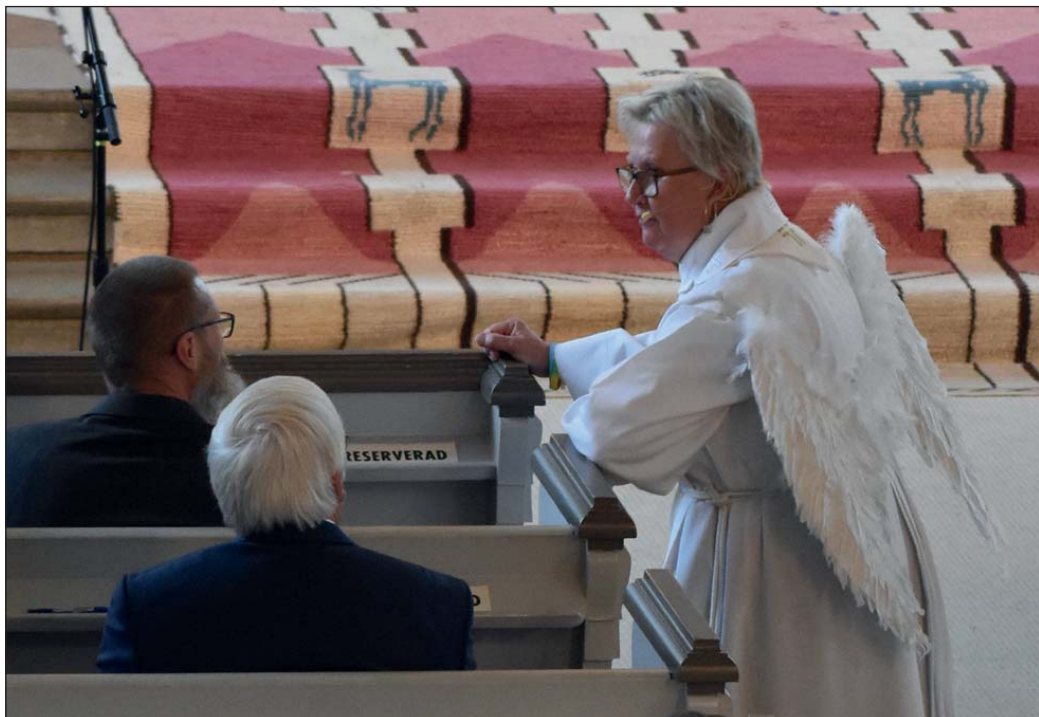
Ängeln i rummet. Nya kyrkoherden bar änglavingar under ceremonin och det är ju inte varje dag man som kyrkobesökare får samtala med en livs levande ängel.

”Alla borde resa bort för att komma hem och upptäcka på nytt.”