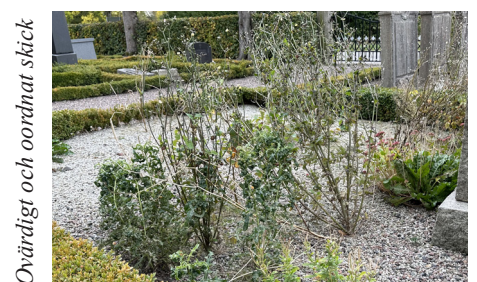
Ovärdigt och oordnat skick

Lövestad gamla kyrkogård; exempel på gravar med gravrätt där den ena sköts av gravrättsinnehavaren och den andra inte.