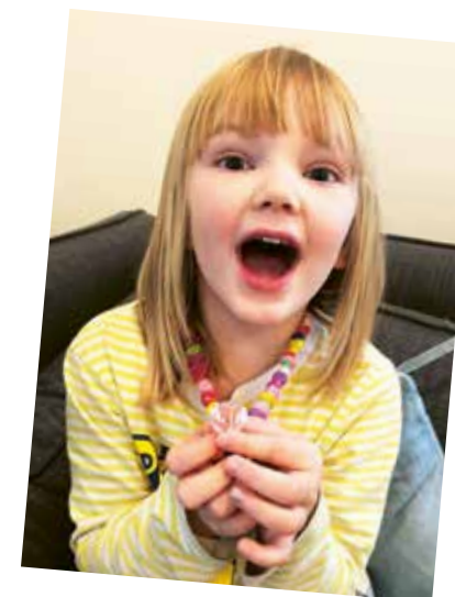
"Jag äääälskar glittriga diamanter och guldiga saker".

Jag tycker om alla olika djur, fast inte krokodiler så mycket. Kaniner är så gulliga så jag inte kan förstå det. Och honor pluppar ut ägg och så blir det... KYCKLINGAR, wow wow WOW! Men varför finns det inga krokodilbepar egentligen? Jag har inte sett några i alla fall. Kanske finns det bara krokodilpapor och inga krokodilmammor. Så är det nog! Fast vet du vad som är häftigast? Berätta! Valhajen!! Den är prickig som en prickigkorv och