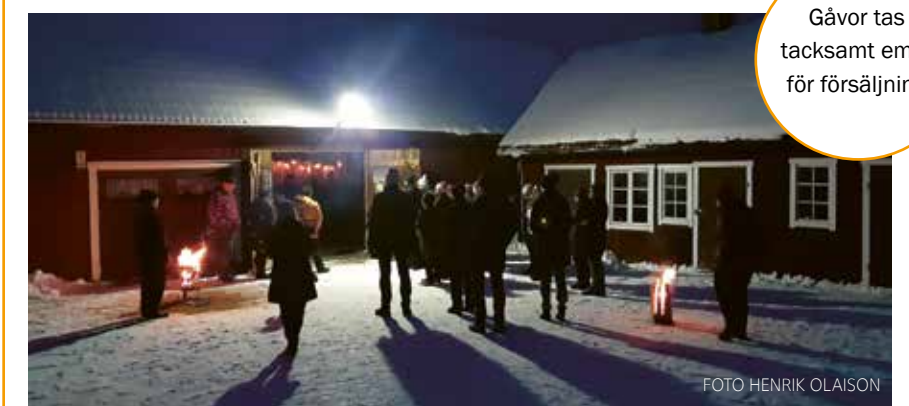
Luciabasaren 2021 vid kyrkstallarna bakom församlingshemmet i Mellby