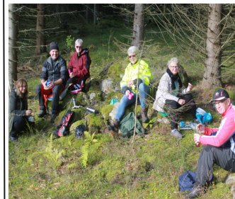
Pilgrimer Ingeryd lokt.