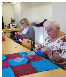
Sygruppsdamerna för Rumänien.