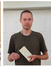
Pilgrim från Holland.