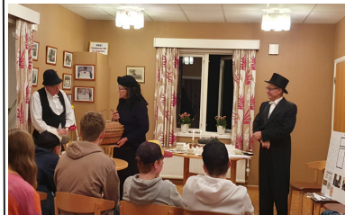
Allhelgonavandring gamla traditioner.