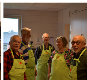
Gubbröran lagar soppa 1 nov.