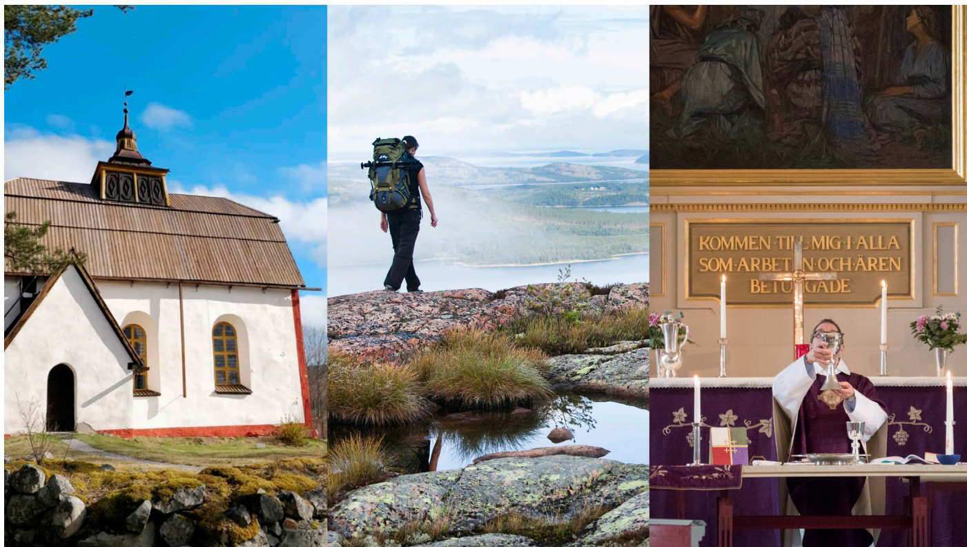
Ytterlännäs Gamla kyrka, Skuleskogens kust, Gudmundrå kyrka.