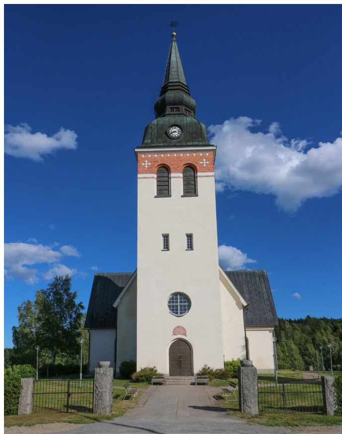
Ullångers kyrka.

I pastoratet finns 13 kyrkobyggnader. Sex av dem är medeltida. Alla är värdefulla men de medeltida har ett särskilt historiskt och kulturellt värde, samtidigt som de är gudstjänstrum för vår och kommande generationer. Församlingshemmen är elva till antalet och används året runt på olika sätt. I anslutning till pastoratets krematorium (Ångermanlands enda) finns Mariakapellet med tillhörande utrymmen för samlingar. I Bjärträ, Nordingrå och Ytterlännäs finns begravningskapell och i Gudmundrå finns Kramfors kapell som mest används sommartid. Av kapellen från Gävlefiskarnas tid utmärker sig Barsta som är oförändrat från 1699 till idag. Kapellen ägs och sköts av kapellag och det finns överenskommelser om användningen av dem för gudstjänster och kyrkliga handlingar. Detsamma gäller för Stavkyrkan på Mannaminne. Kapellen i Berghamn och Marviksgrunnan ägs av pastoratet. Pastoratet är alltså rikt rustat med byggnader för verksamheten men också med deras medföljande nödvändiga underhållskostnader. Framtiden bär i sitt sköte incitament till ett grannlaga prioriteringsarbete i kommande lokalförsörjningsplaner.