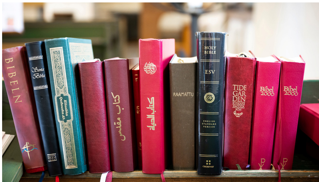
Biblar på olika språk.

Teckenspråkig verksamhet kan ske framför allt i samverkan med stift och andra pastorat.