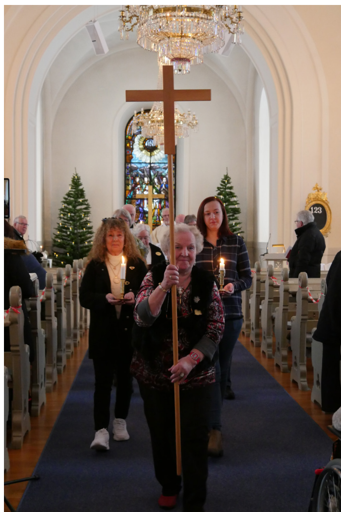
Procession vid sammanlyst mässa i Ytterlänns kyrka.

I samband med övriga aktiviteter hålls andakter. Till Ytterlänns gamla kyrka söker sig många under sommarperioden. Dit förläggs då veckomässor och söndagens gudstjänst. Under sommarperioden flyttas en del gudstjänster ut ur kyrkorummet till fiskarkapell, hembygdsgårdar, fäbodan eller natursköna platser. Barnens plats i gudstjänsten bör vara en självklarhet, och där kan stående moment som tändandet av "Barnens ljus" med tillhörande förbön bli en påminnelse om detta för alla gudstjänstdeltagare. Påsar eller ryggsäckar med barnvänligt innehåll och söndagsskola parallellt med delar av gudstjänsten kan också vara en del av denna inriktning. Kyrkvårdar och ideella medarbetare finns med i varje gudstjänst. Gudstjänstgrupp som förbereder och genomför gudstjänst tillsammans med präst, musiker, ideella, vaktmästare och övriga medverkande fungerar väl bland annat i Nordingrå församling och är ett eftersträvarsvärt sätt att arbeta med gudstjänsten.