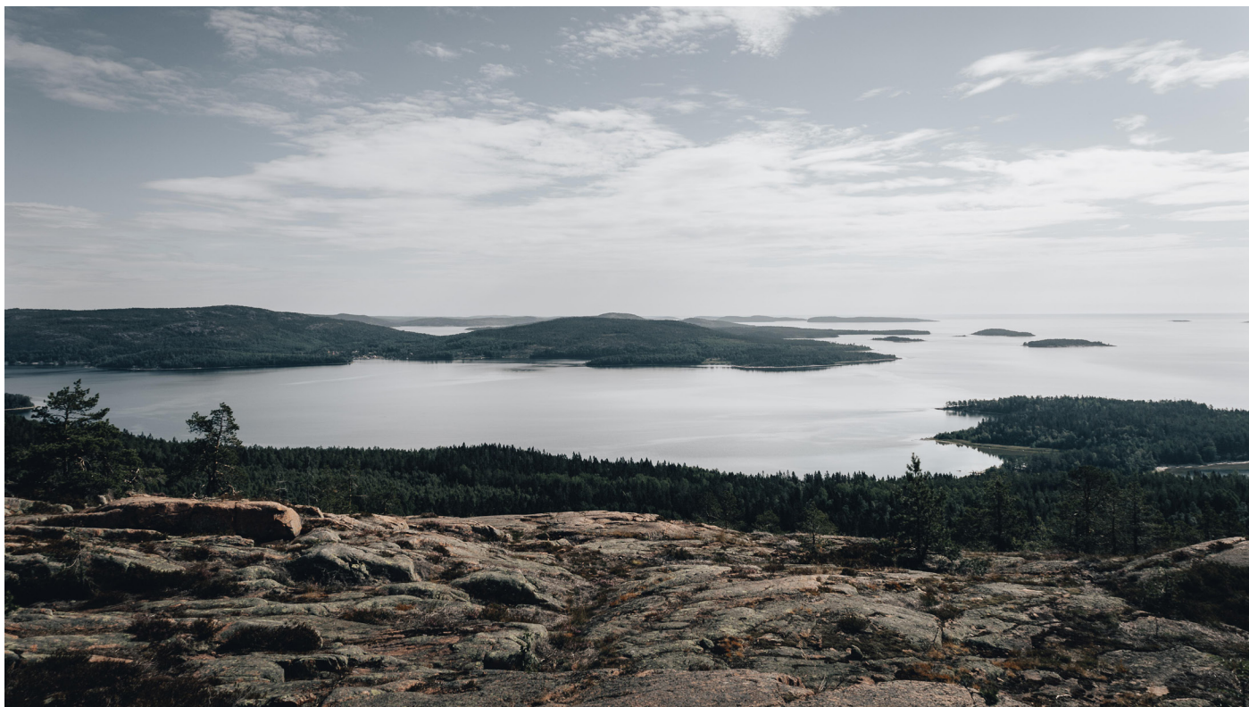
Skulebergets utsikt.

pryds av en staty av Magdalena Forsberg. Det goda samarbetet med bygdens föreningar synliggörs även i gudstjänstlivet med värdskap och textläsningar. Samarbete med EFS och Pingstkyrkan är också ett viktigt inslag bland annat genom barn och ungdomsarbetet med över 50 barn inskrivna i "Äventyret". Sommartid finns en stark tradition att förlägga gudstjänsten både ute i naturen i fåbodrar och hemma hos enskilda församlingsmedlemmar, vid Mäja fåbodrar och vid Almsjöbadet. En kyrkstig från Ullångersfjället och gudstjänst vid Prästtjärnen kan vara värda att fundera över. Sommargästernas antal är numera mycket stort. Att hitta mötesplatser där församlingen är en part är en fråga för framtiden. Det finns en fantastisk medeltidskyrka i Ullånger men många, bland annat sommargäster, har förmodligen lättare att hitta in till oss på andra platser än i den vackra kyrkan.