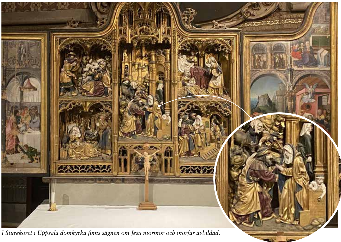
I Sturekoret i Uppsala domkyrka finns sägnen om Jesu mormor och morfar avbildad.