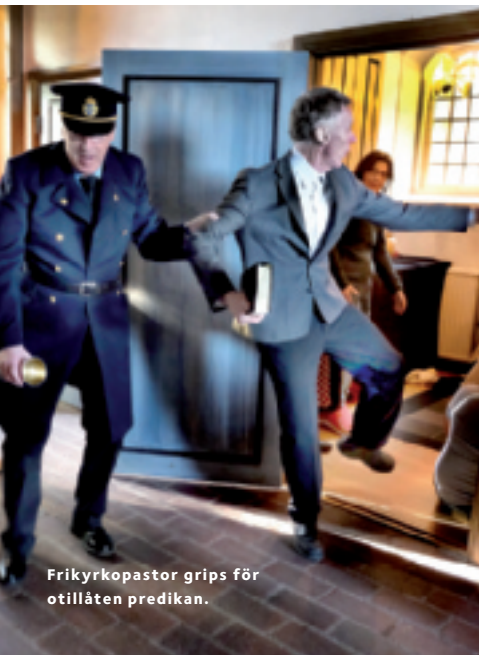
Frikyrkopastor grips för otillåten predikan.