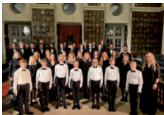
Sollentuna Gosskör och Diskantkör

Möt försommaren med vacker körmusik, varmt välkommen!