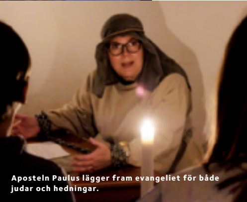
Aposteln Paulus lägger fram evangeliet för både judar och hedningar.

hos besökarna innan de kliver in i kyrkan och berättar att graven är tom och att den uppståndne Jesus har visat sig för henne. Snabbt därefter rusar hon iväg för att berätta detta för de andra lärjungarna.