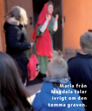
Maria från Magdala talar ivrigt om den tomma graven.