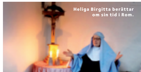
Heliga Birgitta berättar om sin tid i Rom.

EFTER DETTA får besökarna träffa Petrus, som berättar om sina upplevelser tillsammans med Jesus, och Paulus som sitter inlåst hos kejsaren. Heliga Birgitta, Luther och en väckelsepredikant dyker även de upp för att berätta sin del av kyrkohistorien. Vandringen avslutas med att tre nuvarande kyrkoarbetare berättar kortfattat om hur det är i kyrkan idag och vad kyrkan arbetar med nu.