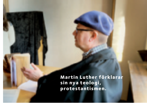
Martin Luther förklarar sin nya teologi, protestantismen.