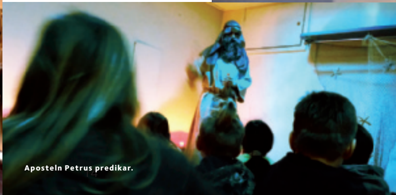
Aposteln Petrus predikar.