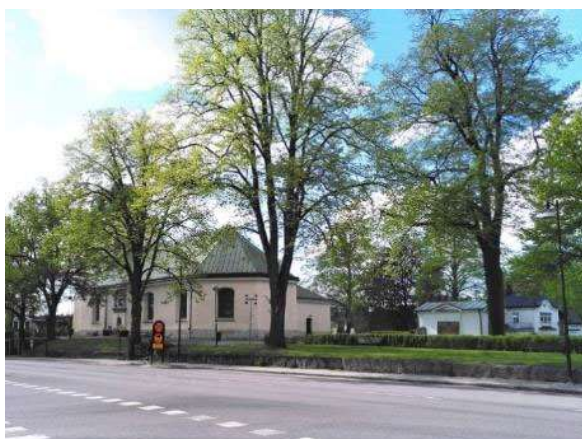
Vy mot kyrkogården från sydöst

Mjölby kyrka och gamla kyrkogård ligger centralt placerade i stadens äldre del, vid kvarnbyn strax öster om Svartåns lopp genom orten. Området avgränsas av den gamla industribebyggelsen vid ån i väster och stambanan i öster. I söder vetter kyrkogården mot genomfartsleden Kungsvägen och söder om denna ligger Stora torget med det gamla stadshuset och norr om kyrkan ligger den så kallade Vita villan där Folkungabygdens pastorat har kontorslokaler och personalutrymmen.