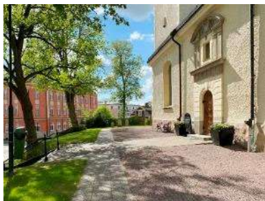
Entréområde mot gata i söder

kvar. Den särskilda och centralt placerade del som tillhör släkten Ehrenkrona på Hulterstad är fortfarande aktiv, men utgör ett med häckar avgränsat område.