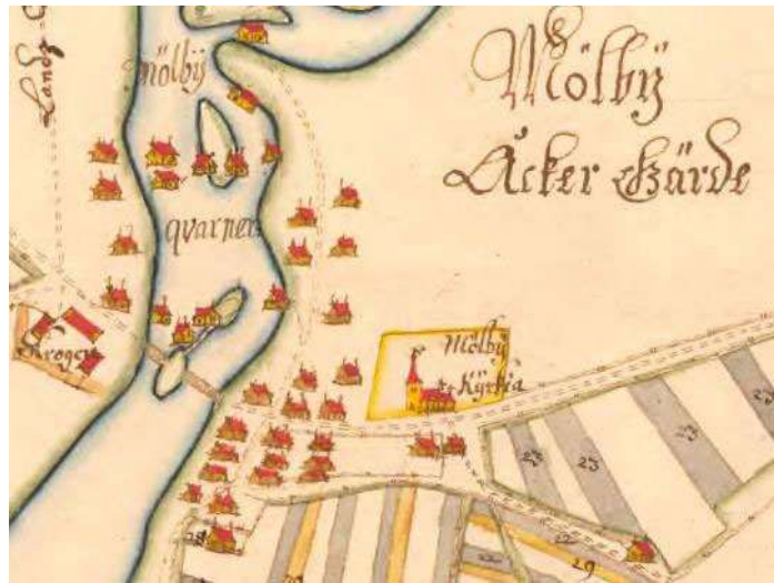
Karta med osäker datering, troligen sent 1600-tal. Alla byggnader inklusive kyrkan är schablon-ritade och visar därför inte deras verkliga utseende.

Östergötlands vägnät. 1686 byggdes kyrkan ut med en tillbyggnad av trä och 1751 försågs kyrktornet med en spira och klockorna flyttades in från klockstapeln som fanns nordöst om kyrkan. Tornet försågs även med ett tornur. Den 28 maj 1771 härjades kvarnbyn av en förödande brand då kyrkan, prästgården och stora delar av byn brann ner. Återuppbyggnaden satte genast i gång. Av kyrkan kunde endast tornets murar bevaras tillsammans med en torntrappa av sten. Den nya kyrkan kunde tas i bruk år 1775, men först 1779 stod inredningen färdig och kyrkan kunde invigas i juni detta år.