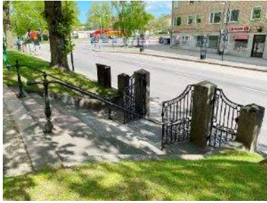
Huvudentrén med grindar och trappa