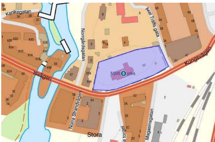
Det lila fältet markerar fornlämningens utbredning (Karta: Fornsök, Riksantikvarieämbetet)

”Begravningsplats, Mjölby gamla kyrkogård, ca 135x55 m (ÖNÖ-VSV). Kyrkan uppförd under 1100-talets första hälft. Kyrkogårdens båda huvudingångar är placerade i S. De äldsta gravvårdarna är från 1615 och 1645. Det finns 32 gravvårdar från 1800-talet. Används enbart till nybegravningar för familjen Ehrenkrona på Hulterstad. Ehrenkronska gravkoret från ca 1800 är beläget Ö om kyrkan och det Ehrenkronska gravområdet, avgränsat av häckar, som är den aktiva delen av kyrkogården. Slutade i övrigt officiellt att användas i början av 1900-talet. Kyrkogården har inventerats av Östergötlands länsmuseum under 2000-talet. Vid antikvariska kontroll år 2006 undersöktes 37 gravar vid sakristian på kyrkans norra sida. Skelettmaterialet återbegravdes. Fynd av 3 fingerringar, varav 2 av kopparlegering och 1 av silver, 1 kopparmynt och 1 svepningsnål av silver. (RAÄ dnr 321-361-2007)”