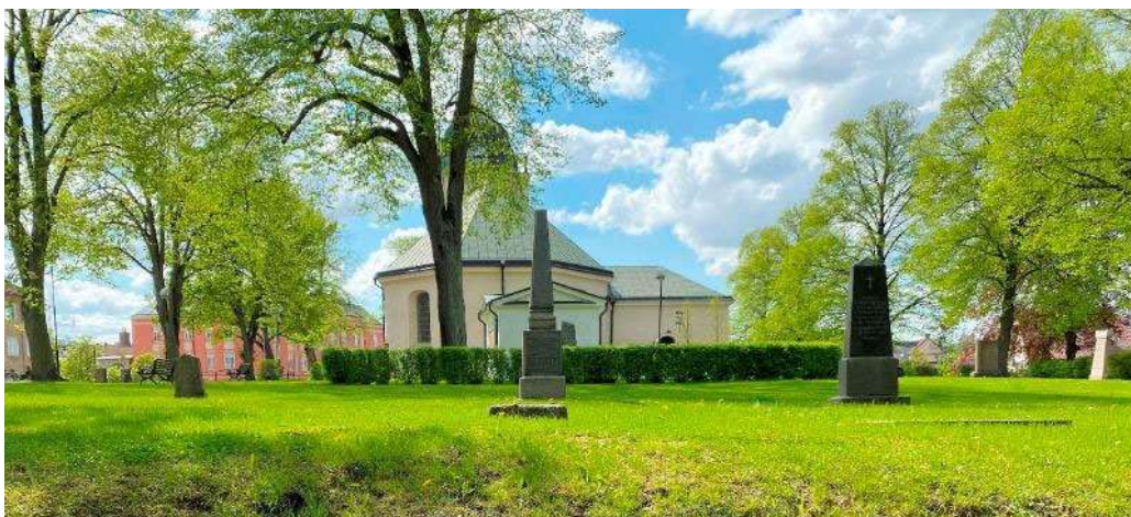
Mjölby kyrkogård från öster

Kyrkogården är skyddad enligt 4 kap. kulturmiljölagen. Bestämmelserna om begravningsplatser omfattar byggnader på begravningsplatsen som inte är kyrkobyggnader samt fasta anordningar såsom murar, medvetet gestaltad vegetation och gravanordningar som tillfallit upplåtaren. Väsentliga ändringar kräver tillstånd från länsstyrelsen. Vid osäkerhet beträffande tillståndskrav kontaktas länsstyrelsen.