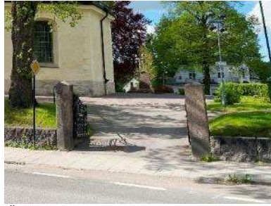
Östra entrén mot söder