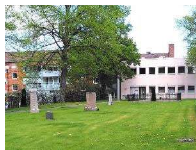
Gravvårdar i nordost