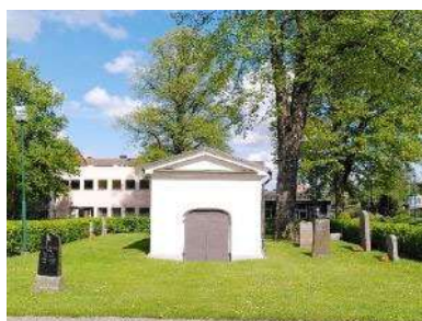
Ehrenkronas gravkor och gravområde