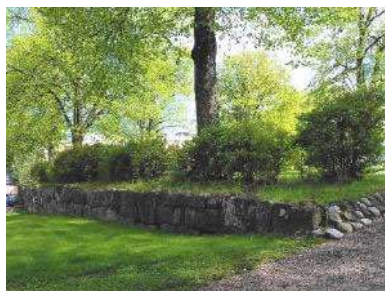
Mur, häck och trädkrans mot norr