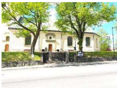
Huvudentré mot Kungsvägen i söder

Kyrkogården är belägen på en kulle och omgärdad av stödmurar på alla sidor. Stödmurarna är kallmurar av olika slag och ålder, vilka varierar i höjd beroende på skillnader i omgivningens marknivå. Högst är muren på den norra sidan. Mot Kungsvägen i söder är muren knappt meterhög och utförd som en blockstensmur av stående rektangulära granitblock. Längs den östra sidan är oregelbundna men väl tillpassade naturstensblock staplade i två-tre skift. Samma typ av mur återfinns i norra sidans västra del, men här cirka två meter hög. Murarna mot öster och norra sidans östra del har en äldre karaktär med klivna block och breda fogar, ofta med skolstenar. Innanför stödmurarnas krön finns mot norr, öster och söder en gles trädkrans av lind. I norr och väster har en häck av friväxande buskar planterats, och i ett avsnitt i norra sidans östra del finns en klippt oxelhäck. Se kapitel 4.5 Vegetation.