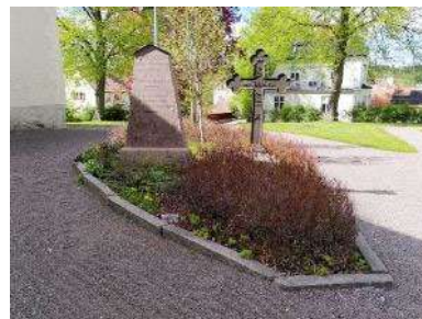
Plantering nordöst om kyrkan