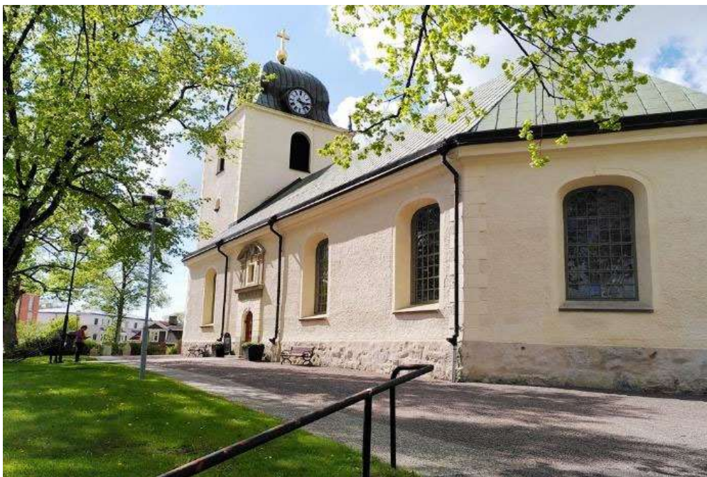
Kyrkan från sydöst