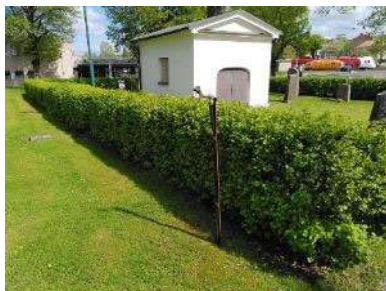
Klippt måbärshäck kring Ehrenkronas gravområde