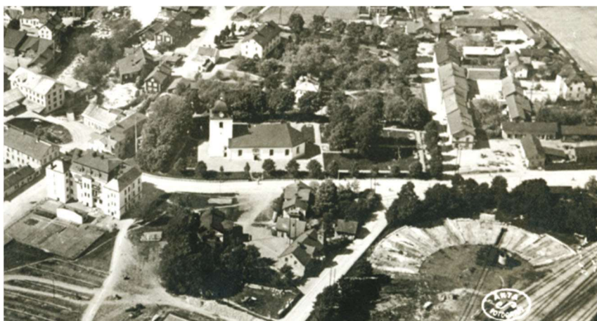
1924. Flygbild från söder. Trädkrans i söder och öster har förnyats. Sydöst om kyrkan syns järnvägsområdet.

1941 omdanades kyrkogården och fick en mer parklik utformning. Marknivån höjdes med fyllmassor och norr om kyrkobyggnaden anlades planteringar med buskar och träd. Det finns uppgifter om att även omgärdande trädkrans och häck byttes ut, men flygbilder från mitten av 1900-talet tyder på att detta inte utfördes. 1989 togs tre gamla lindar kring Ehrenkronas gravkor ner på grund av ålder och nu återstår endast en. Trädkransen var ännu i början av 2000-talet intakt, men tycks enligt flygbilder ha glesats ut under perioden 2007-2011 genom att ungefär vartannat träd togs ner.