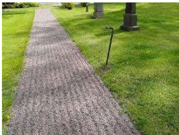
Gång med krossgrus

För vidare beskrivning av objekten och eventuellt åtgärdsbehov, se kap. 6.