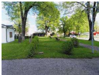
Promenadstråk mot sydöst