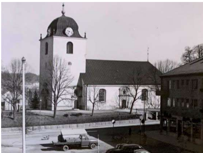
1960. Foto från söder.