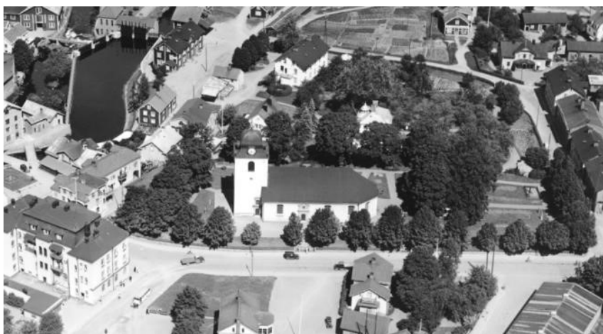
1939. Flygbild från söder.