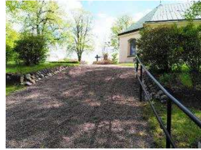
Infart från norr, utan grind