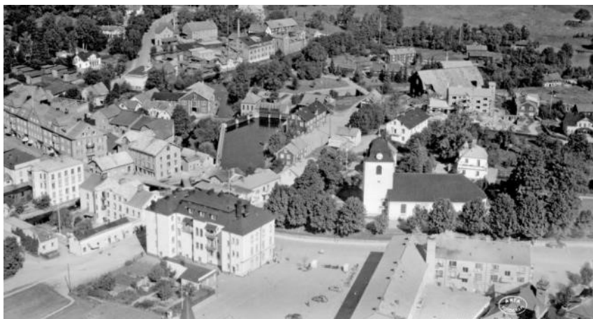
1946. Flygbild från söder. Det nya torget och bebyggelsen kring detta syns nu söder om kyrkan. Torget stod klart 1945.