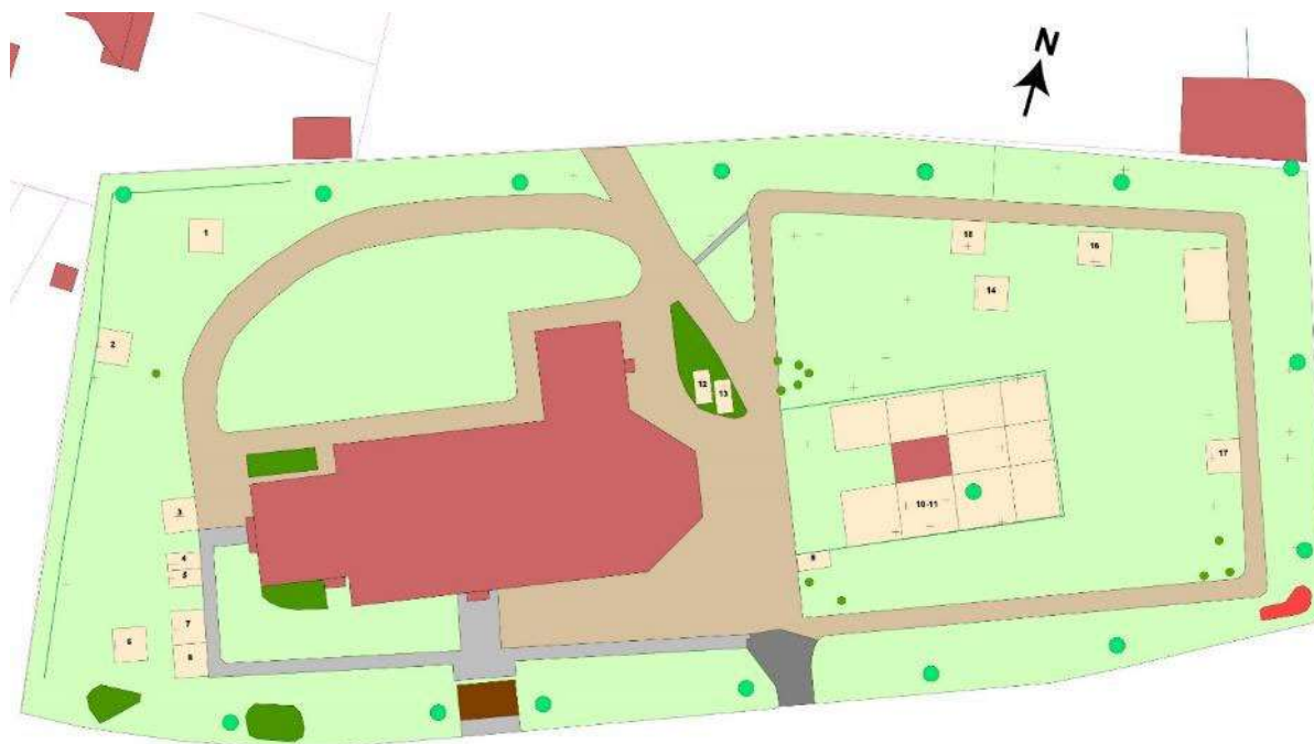
Mjölby gamla kyrkogård, 2021