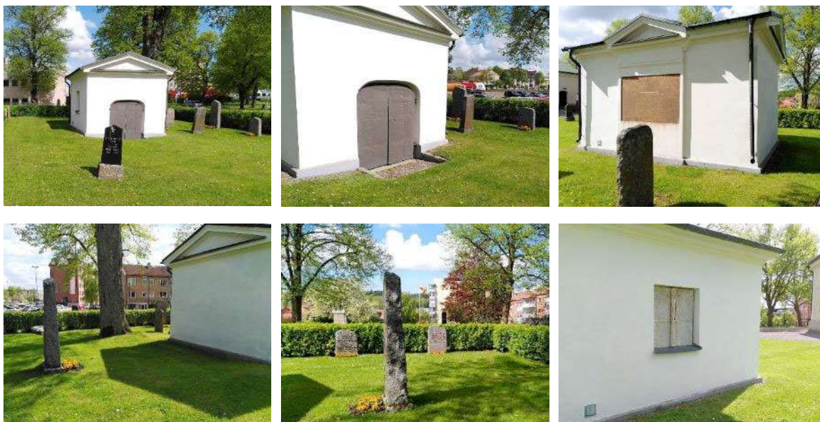
Ehrenkronas gravkor med omgivande gravområde.