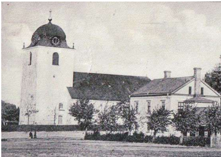
Omkring år 1900. Vykort. Foto från söder.