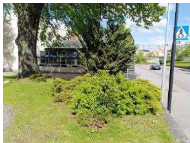
Barrväxter och buskar i sydöstra hörnet