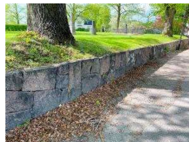
Mur och trädkrans mot öster

Kyrkogården har tre ingångar, två mot söder och en mot norr. Huvudingången direkt nedanför den södra kyrkporten har en bred dubbelgrind med sidogrindar på vardera sida. Grindbladen är rikt ornamenterade svartmålade smidesgrindar med konkavt krön. Grindstolparna är av granit och har kvadratisk bas och pyramidformad topp. Innanför grinden leder en bred trappa av granit upp mot entréområdet framför kyrkporten. Trappan har ledstänger med stolpar och avslut i svartmålat gjutjärn. Längre österut på den södra sidan finns en entré med bred öppning och ett par liknande grindblad. De två grindstolparna är även här av granit med kvadratisk bas och pyramidal topp. De båda grindpartierna är troligen från tidigt 1800-tal. Mot norr fanns fram till 2016 två enkla gånggrindar som togs bort då en ny bredare och körbar entré anlades mot Vita villan. Denna entré saknar grind.