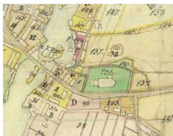
1828. Laga skifte. Den nya kyrkan med större långskepp och en sakristia i norr. Murarna i den gamla kyrkans torn fick utgöra stomme i det nya tornet, men tornet utvidgades österut. (Lantmäteriets historiska kartor)