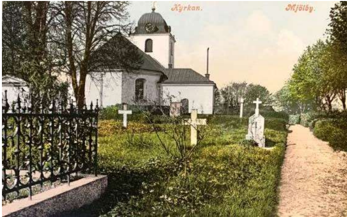
Omkring år 1900. Vykort. Foto från nordöst.

Efter branden 1771 omdanades troligen kyrkogården, men utbredning och omgärdande mur verkar vara desamma. Även ett par gravvårdar från 1600-tal finns ännu bevarade på kyrkogården. Ätten Ehrenkrona på Hulterstad, med patronatsrätt i pastoratet, uppförde ett gravkor på kyrkogårdens östra del någon gång i början av 1800-talet, i en tidstypisk nyklassicistisk stil. Den nya kyrkans huvudingång placerades mitt på långhusets södra sida, och kyrkogårdens huvudentré mitt framför denna. Kyrkobyggnaden rustades upp på 1860- och 70-talet, och ytterligare en gång 1906-1907 då bland annat de vackra portalomfattningarna av sandsten tillkom.