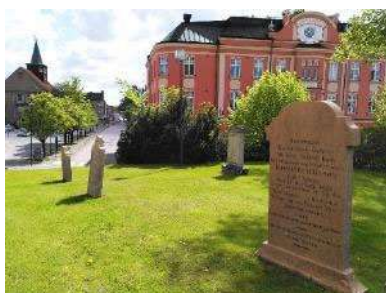
Gravvårdar i sydväst

För vidare beskrivning av objekten och eventuellt åtgärdsbehov, se kap. 6.