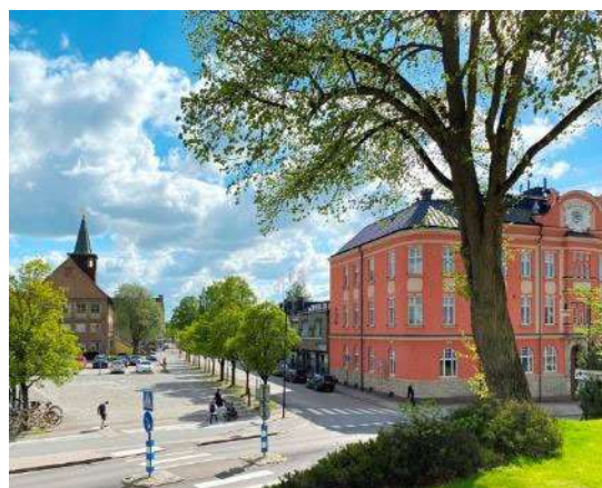
Torget och det gamla stadshuset söder om kyrkan. Till höger syns det vackra sparbankshuset i jugendstil

När Stora torget med stadshus, affärslokaler med mera färdigstälts i söder på 1940-talet fick kyrkogårdens centrala läge och öppna orientering mot torget alltmer en karaktär av stadspark. Antalet gravvårdar på kyrkogården har reducerats genom 1900-talet och idag finns endast ett fåtal