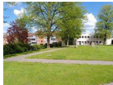
Kyrkogårdens nordöstra del