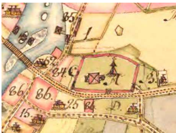
1770. Storskifte. Den gamla kyrkan med torn i väster och en utbyggnad åt väster. Klockstapel nordöst om kyrkan. Året innan den stora branden.