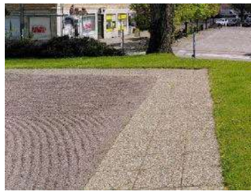
Med tillgängligt stråk av plattor