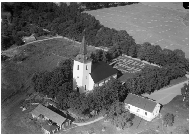
1935. Flygfoto (RAÅ, Kringla).