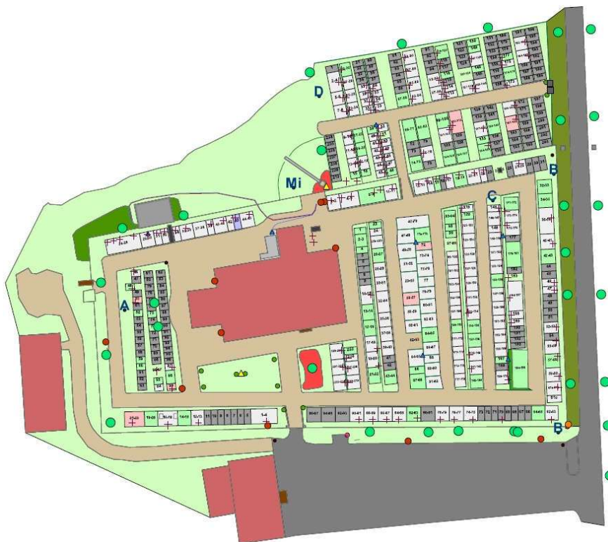
Sya kyrkogård, 2019.