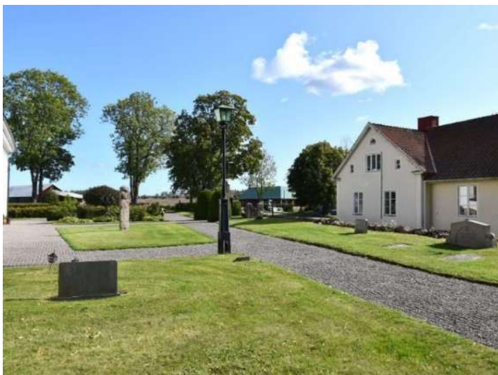
Randkrattade grusgångar på kyrkogårdens södra del.

För en mer teknisk beskrivning av objekten, se kap. 6.