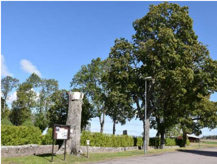
Träden i trädkransen skyddas av det generella biotopskyddet.

Kyrkogårdens trädkrans skyddas av det generella biotopskyddet enligt 7 kap. 11 § Miljöbalken. För åtgärder som påverkar biotopen måste dispens sökas hos länsstyrelsen. Även allén öster om kyrkogården skyddas av det generella biotopskyddet.