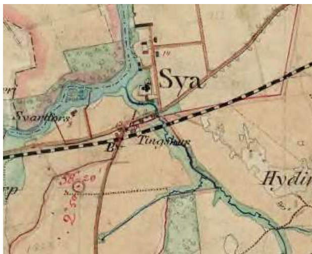
1868-77. Häradsekonomska kartan (Lantmäteriets historiska kartor).

På häradsekonomska kartan från 1868-77 syns den nästintill kvadratiske kyrkogården med kyrkan centralt placerad. En väg leder fram till en ingång mitt på kyrkogårdens södra sida, som än idag utgör kyrkogårdens huvudingång. Norr om kyrkan ligger Sya gård som uppfördes under början av 1800-talet. Det nuvarande församlingshemmet som ligger söder om kyrkogården byggdes ursprungligen på 1800-talet som en skola. På kartan från 1868-77 tycks skolan ännu inte vara byggd. Däremot finns en byggnad strax sydöst om kyrkogårdens södra ingång. Det kan vara det f d ålderdomshemmet, numera ombyggt till bostäder.