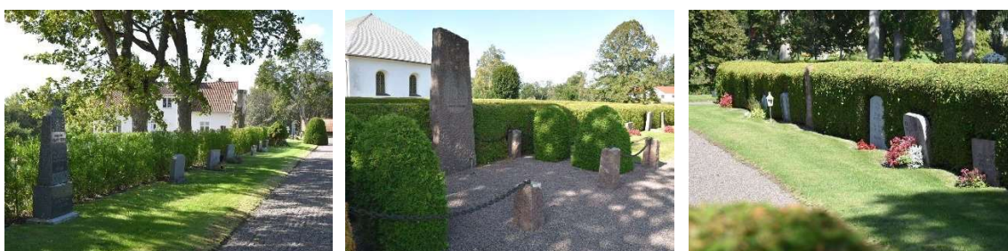
Gravvårdar längs södra ytterkransen.

Väster om kyrkan finns ett fåtal enkla linjegravvårdar bevarade.