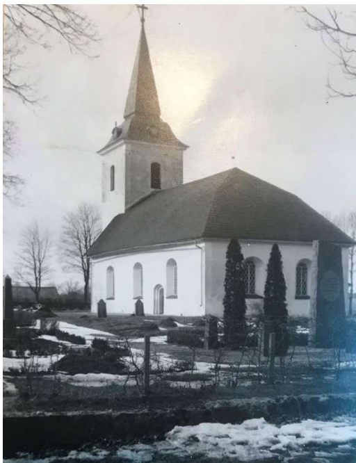
1932. Kyrka och kyrkogård från sydöst.