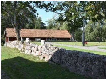
Kyrkogårdsmuren i sydväst.

För en mer teknisk beskrivning av objekten, se kap. 6.