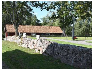
Den traditionella kyrkogårdsmuren som omgärdar kyrkogården, här längs sydvästra sidan.