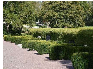
Häckarna av tuja och idegran på kyrkogårdens östra del.