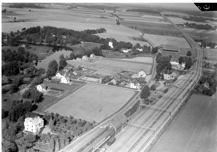
1935. Flygfoto.