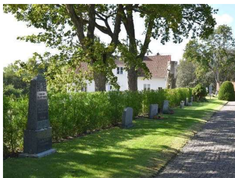
Den yttre gravkransen.