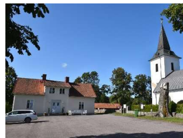
Församlingshemmet (f d kyrkskolan) söder om kyrkogården.