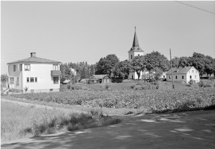
1944. Kyrkan och kyrkogården från sydväst.

På 1930-talet utvidgas kyrkogården med ett rektangulärt område åt nordöst. Området fick en tidsenlig, strikt planform med ett vinkelrätt, korsformat gångstråk, kantat av klippta häckar. Gravplatserna förlades i både dubbla och enkla rader. Större delen av området planerades för allmänna gravar. Längst i nordöst fanns en del avsatt för barngravar.