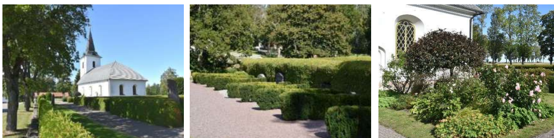
Området öster om kyrkan med trädkransen utanför kyrkogårdsmuren (t v), gravkvarteren med praktfulla tuja- och idegranshäckar (mitten) och prydnadsrabatten söder om kyrkan (t h).

För en mer teknisk beskrivning av objekten, se kap. 6.