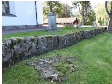
Kyrkogårdsmuren i norr.