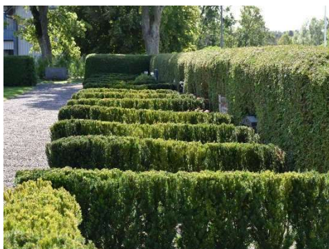
Området med häckomgärdade grusgravar.