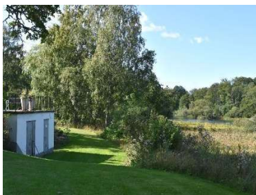
Landskapet norr om kyrkogården med Svartån.

Kyrkogården har en rektangulär planform, avsmalnande mot väster. Kyrkan är centralt placerad på kyrkogården i öst/västlig riktning. I nordöst ligger 1930-talets utvidgningsdel, även den med rektangulär planform som sträcker sig i öst/västlig riktning. Väster om utvidgningsdelen ligger minneslundan.