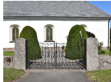
Huvudingången i söder.