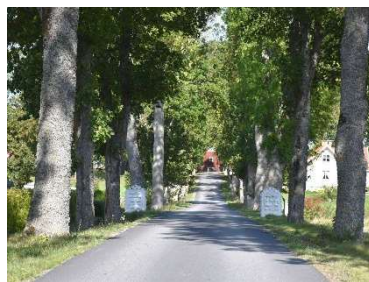
Askallén mot Sya gård öster om kyrkogården.