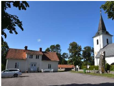
Det gamla skolhuset, numera församlingshem, söder om kyrkogården är en rest från det tidigare sockencentrat.