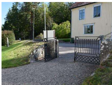
Den östra ingången från parkeringen.