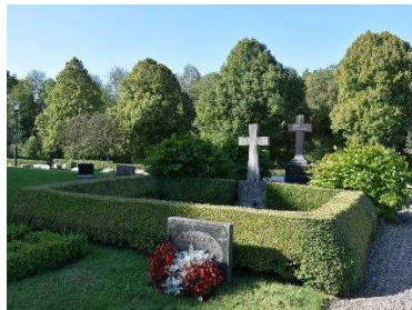
Häckomgärdad gravplats med gravvård från tidigt 1900-tal.