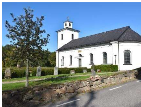
Kyrkogårdens trädkrans med äldre lindar i söder (t v) och relativt unga oxlar i norr och öster (t h).