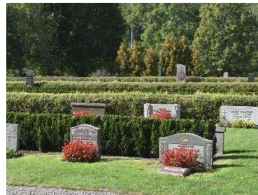
Häckkyrkogård typisk för mitten av 1900-talet.