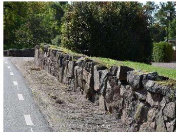
Den traditionella kyrkogårdsmuren som omgärdar kyrkogården, här längs östra sidan.