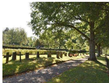
Området i väster