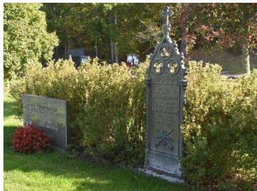
Gravvård av gjutjärn från 1800-talets första hälft.

På kyrkogårdens västra del finns rester av allmänna linjen med små typiskt anspråkslösa gravvårdar bevarade.