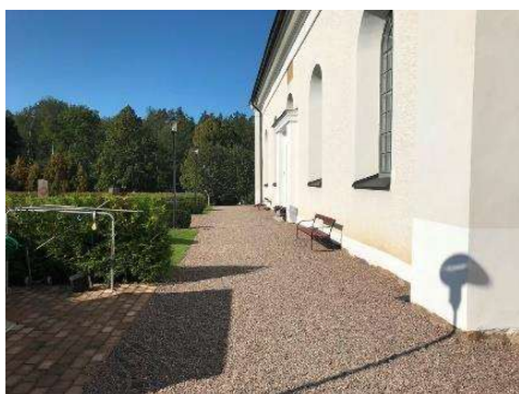
Gångytan söder om kyrkan.

För en mer teknisk beskrivning av objekten, se kap. 6.