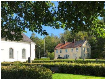
Det gamla skolhuset, numera församlingshem öster om kyrkogården är en rest från det tidigare sockencentrat.