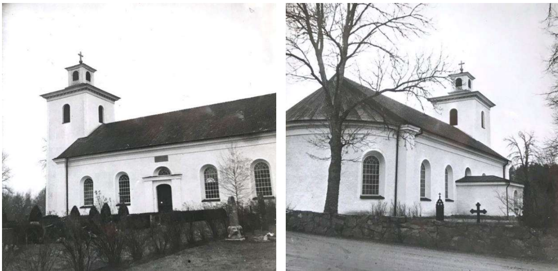
1961. Kyrkogårdens södra del (t v) med rygghäckar i raka rader och kyrkogårdens nordöstra del (t h) med flera större friväxande lövträd.