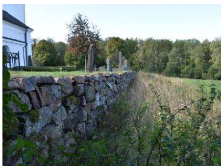
Den omgärdande kyrkogårdsmuren och en ung oxel i trädkransen.

För en mer teknisk beskrivning av objekten, se kap. 6.