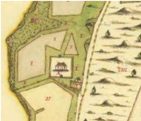
1705. Ägomätning (Lantmäteriets historiska kartor).

Den första kyrkan uppförs troligtvis under 1200-talets första hälft. En ägoavmätningsskarta från 1705 visar kyrkogården kring den medeltida kyrkan. Kyrkogården har en kvadratisk form och omgärdningen är tydligt markerad. Längs södra och norra muren finns markeringar för stigluckor. I en sockenbeskrivning från 1760 står att kyrkans klockor hänger i en trästapel och att kyrkan ligger fördolt så att man först ser den när den när man kommer fram till den.