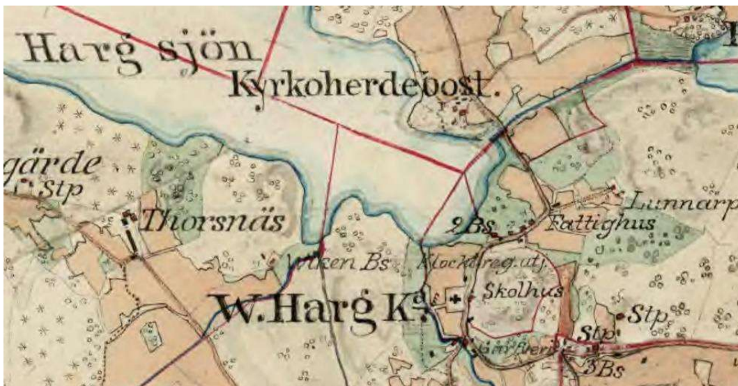
1868-77. Häradsekonomiska kartan (Lantmäteriets historiska kartor).

Under 1800-talets början rivs den medeltida kyrkan och på ungefär samma plats byggs den nuvarande kyrkan mellan 1814-15. I samband med att den nya kyrkan byggdes kan även den omgärdande kyrkogårdsmuren ha uppförts. På en ägoavmätningsskarta från 1817 syns den nya kyrkobyggnaden med kor och torn markerade. Runt kyrkogården är en mur markerad med ett indraget ingångsparti i öster som är samstämigt med dagens utseende. I P D Widegrens beskrivning av kyrkogården från 1800-talets första del nämns en ganska vacker griftegård i kyrkogårdens sydvästra hörn, omgiven av planterade almar och en häck av liguster. Även Häradsekonomiska kartan från 1868-77 visar den nya kyrkan, nu korsformigt markerad. Direkt öster och norr om kyrkogården ligger skolhuset och Klockaregården och vidare norrut ligger Kyrkoherdebostället