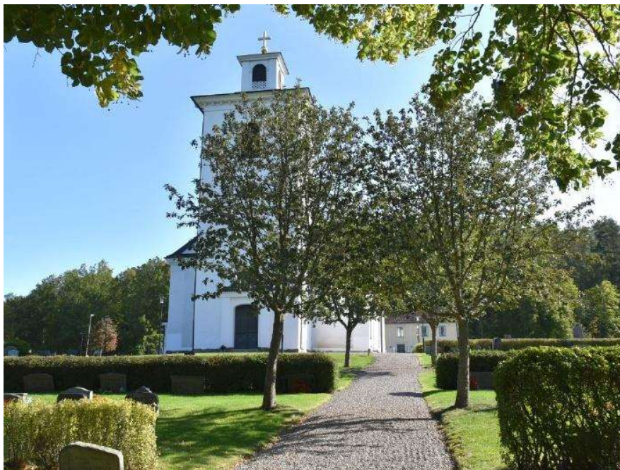
Kyrkogården från väster. I förgrunden syns 1870-talets utvidgning. Kyrkan ligger på kyrkogårdens äldsta del. Bortanför kyrkogården ligger församlingshemmet som tidigare varit en skola och sockenstuga.