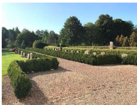
Den vidgade platsen vid kyrkans södra port och gången med korset i fonden.