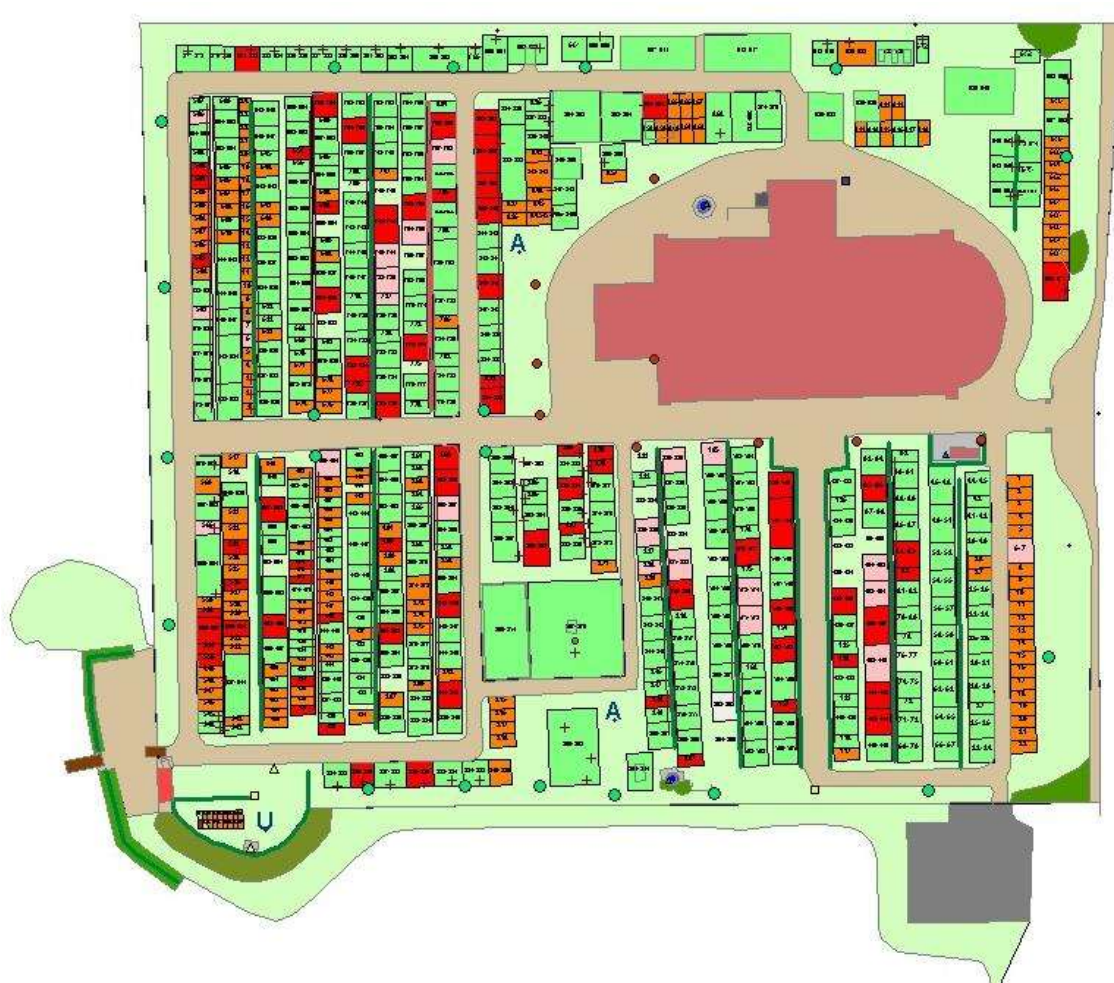
Västra Hargs kyrkogård, 2019.