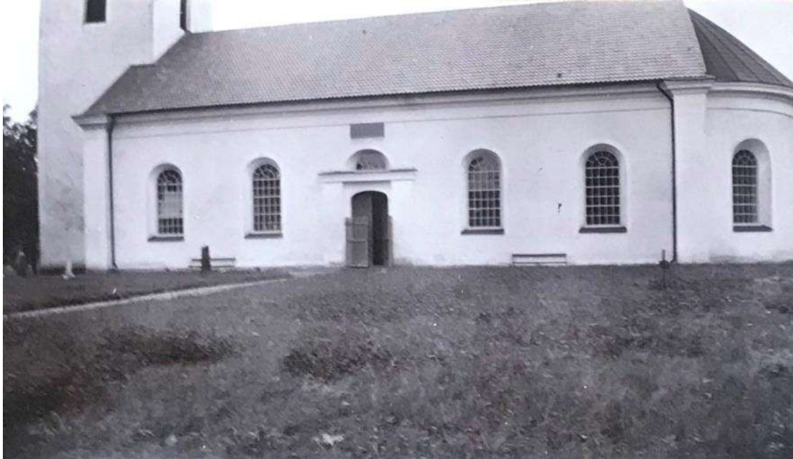
1921. Kyrkogårdens södra del med gravområden helt lagda i gräs.

På ett fotografi från 1920-talet kan man se att stora delar av kyrkogården vid den tiden var lagda i gräs. I gravområdet söder om kyrkan stod gravvårdarna glest i det halvhöga gräset. En rak gång leder fram till den södra kyrkporten och mot kyrkans fasad står två parksoffor. På 1960-talet har rygghäckar i raka rader planterats på kyrkogårdens södra del och norr om kyrkan står flera större lövträd.