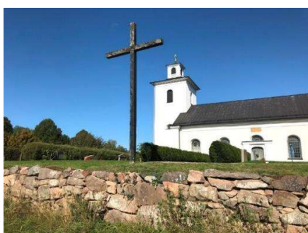
Träkors längs kyrkogårdens södra sida.

För en mer teknisk beskrivning av objekten, se kap. 6.