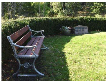
Ask- och minneslund i kyrkogårdens sydvästra hörn.