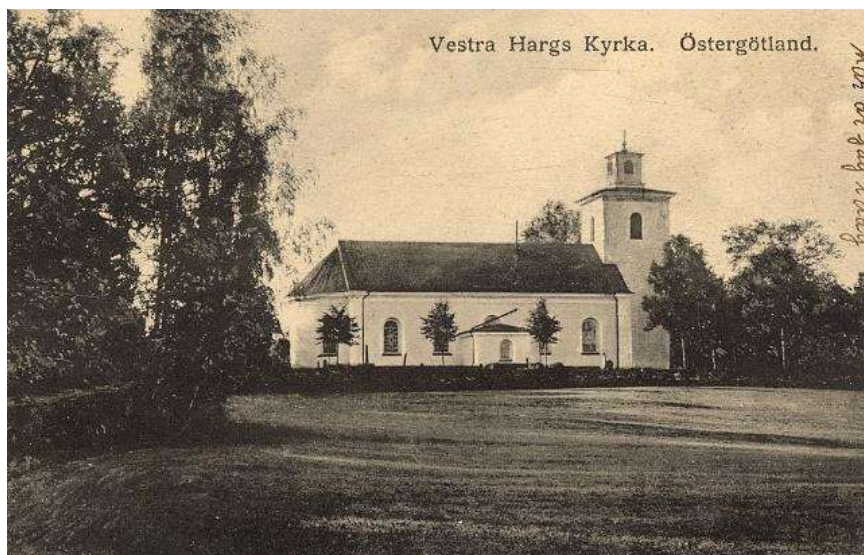
1895. Kyrkan och kyrkogården från norr.

Kyrkogården är väl underhållen och har höga vackra träd och en del goda tidiga 1800-talsgravar. Den är omgiven av en mur av kilad gråsten, mot väster, söder och delvis mot norr är den utformad som terrassmur. Ingången är från öster med ett par vackra smidda grindar, troligen samtida med kyrkan men med vissa rokokoformer.