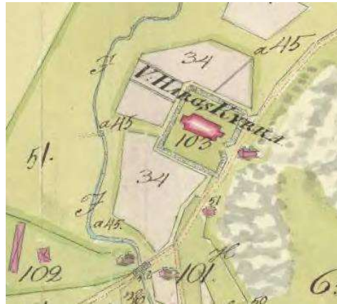
1817. Ägomätning (Lantmäteriets historiska kartor).

Under 1800-talets början rivs den medeltida kyrkan och på ungefär samma plats byggs den nuvarande kyrkan mellan 1814-15. I samband med att den nya kyrkan byggdes kan även den omgärdande kyrkogårdsmuren ha uppförts. På en ägoavmätningsskarta från 1817 syns den nya kyrkobyggnaden med kor och torn markerade. Runt kyrkogården är en mur markerad med ett indraget ingångsparti i öster som är samstämigt med dagens utseende. I P D Widegrens beskrivning av kyrkogården från 1800-talets första del nämns en ganska vacker griftegård i kyrkogårdens sydvästra hörn, omgiven av planterade almar och en häck av liguster. Även Häradsekonomiska kartan från 1868-77 visar den nya kyrkan, nu korsformigt markerad. Direkt öster och norr om kyrkogården ligger skolhuset och Klockaregården och vidare norrut ligger Kyrkoherdebostället