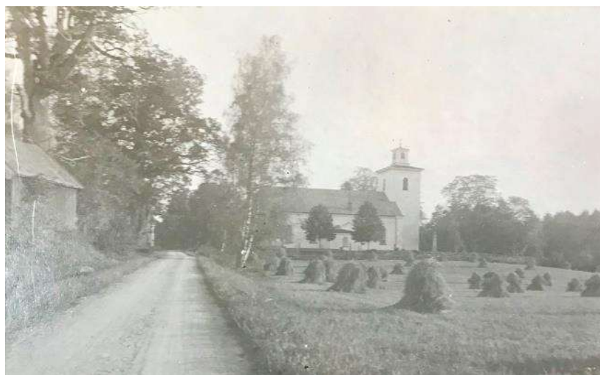
1921. Kyrkan och kyrkogården från norr.