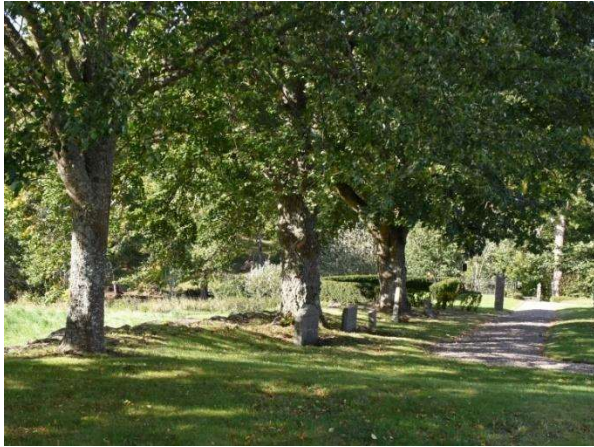
Träden i trädkransen skyddas av det generella biotopskyddet.

De äldre träden i kyrkogårdens trädkrans skyddas av det generella biotopskyddet enligt 7 kap. 11 § Miljöbalken. För åtgärder som påverkar biotopen måste dispens sökas hos länsstyrelsen.