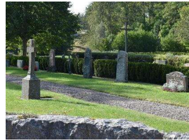
Häckkyrkogård med gravvårdar från sekelskiftet 1900 och modernare gravvårdar från 1950-talet och framåt.