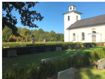
Området i söder