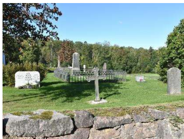
Området i norr

Områdets karaktär ansluter till häckkyrkogårdskaraktären i området söder om kyrkan genom de återkommande rygghäckarna och regelbundna gravrader. Karaktären är dock något mer uppluckrad genom att vissa häckar tagits bort. Karaktären av linjegravsområde är påtaglig genom de mindre och enkla gravvårdarna i områdets västra gravrader.