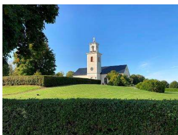
Vy mot väster

Området har en öppen parkkaraktär med ett sparsamt gångsystem, stora klippta gräsytor och enstaka spridda träd och buskar. Minneslundan med trädplanteringarna, de bågformade häckarna och perennrabatterna har en något småskaligare parkkaraktär.