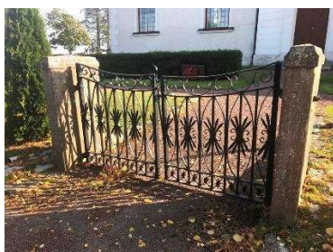
Grindparti i väster

För vidare beskrivning av objekten och eventuellt åtgärdsbehov, se kap. 6.