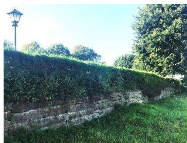
Stödmur och tujahäck i norr

Kyrkogården har tre ingångar, samtliga försedda med grindpartier. Huvudingången ligger längs den äldsta delens västra sida och vetter mot parkeringen. Ingången är försedd med svartmålad smidesgrindar med sirlig dekor. Grindstolparna är av kalkstenshällar ställda på högkant med en profilerad avtäckning i kalksten. Längs kyrkogårdens södra sida finns ytterligare ett grindparti, som troligen tidigare har varit kyrkogårdens huvudingång. Grindpartiets grindblad är i samma utförande som den västra grindens. Grindstolparna är pampigare utförda med kalkstenshällar kvadratisk sammanfogade och med profilerad avtäckning som kröns av kors. På grindstolparna finns inskriptionen "ÅR" (västra) "1796" (östra). Det är troligt att båda ingångarna med grindstolpar tillkom under slutet av 1700-talet. Grindbladen kan ha tillkommit senare under 1800-talet.