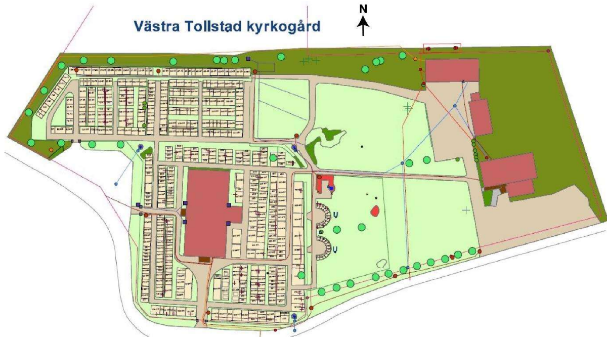
Västra Tollstads kyrkogård, 2020