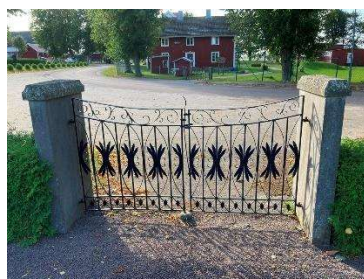
Grindparti, 1950-talets utvidgningsområde