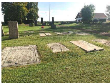
Äldre kalkstenshällar söder om kyrkan

För vidare beskrivning av objekten och eventuellt åtgärdsbehov, se kap. 6.