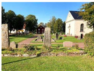
Hagtornshäck och stensockel