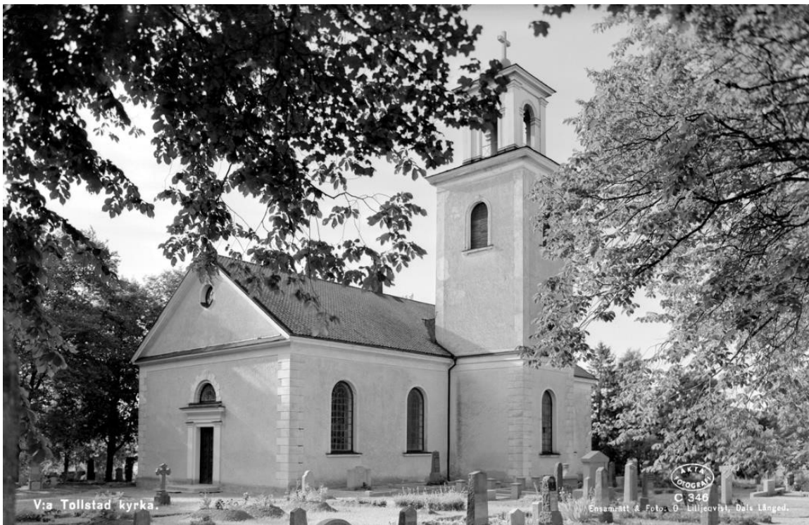
1944, fotografi från sydöst. Kyrkan och kyrkogården med den omgärdande trädkransen. I gravkvarteren fanns fortfarande gravkullar, men grusbeläggningar och omgärdande häckar och gravramar var i stort sett borta (Kringla.nu).