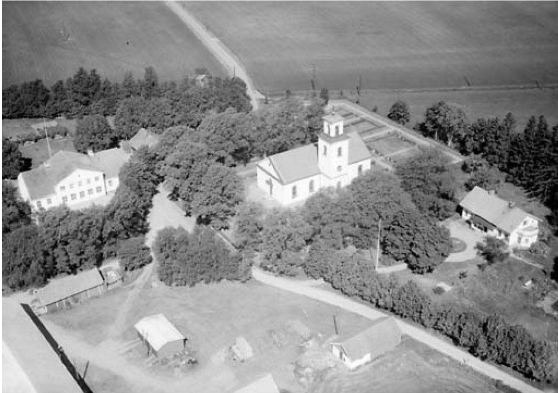
1959, flygfoto. Norr om kyrkan syns det nyanlagda utvidgningsområdet med nyplanterade träd och rygghäckar. I gravkvarteren har gräs såtts. I nordöst ligger prästgården som revs på 1990-talet (Östergötlands länsmuseum).

aldrig, utan 1951 upprättades ett nytt förslag till utvidgning av den befintliga kyrkogården norrut. Ett flygfoto från 1959 visar den då nyanlagda kyrkogårdsdelen med nyplanterade träd och rygghäckar och gräsytor i gravkvarteren. På fotografiet finns även prästgården som revs på 1990-talet, i samband med att marken öster om kyrkogården togs i anspråk för anläggandet av en minneslund. 1993 stod minneslunden klar. I anslutning till minneslunden anordnades även urngravplatser utefter två bågformade häckar.