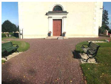
Gång mot kyrkan

För vidare beskrivning av objekten och eventuellt åtgärdsbehov, se kap. 6.