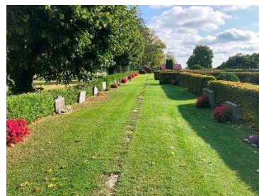
Utvidgningsområdets västra del (t v), östra del (mitten) och norra del (t h)