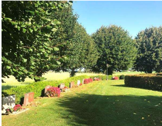
Träden i trädkransen skyddas av det generella biotopskyddet.

Träden i kyrkogårdens trädkrans som uppfyller Naturvårdsverkets definition av allé skyddas av det generella biotopskyddet enligt 7 kap. 11 § Miljöbalken. Definitionen av allé är lövträd planterade i en enkel eller dubbel rad som består av minst fem träd. Träden ska till övervägande del utgöras av vuxna träd, dvs vara minst 20 cm i diameter i bröst höjd eller ha uppnått en ålder av 30 år (det som uppnås först). För åtgärder som påverkar biotopen måste dispens sökas hos länsstyrelsen.