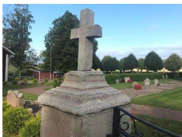
Grindpartiet i söder

Området utgörs av kvarteren kring kyrkan och har en ålderdomlig karaktär som till stor del präglas av det sena 1800-talet och tidiga 1900-talets stilideal. Den höga andelen äldre högresta gravvårdar och mer påkostade familjegravar, de kvarvarande grusgravarna med omgärdande gravramar är viktiga delar. Särskilt öster om kyrkan är dessa iögonfallande. Söder om kyrkan finns ett antal gamla kalkstensvårdar och gravhällar, några är från 1600-talet. Även grindpartierna är starkt karaktärsskapande, där framförallt det södra grindpartiet med inskriptionen "ÅR 1796" utmärker sig.