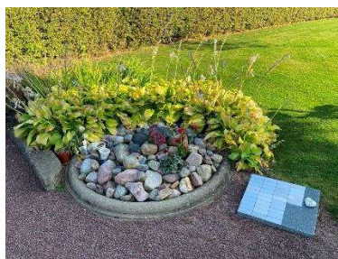
Smyckningsyta och häll med namnbrickor