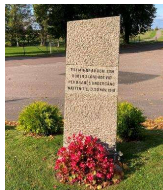
Minnessten över offren för Per Brahekatastrofen

På kvällen den 19 november 1918 lämnade skeppet Per Brahe Jönköping, lastad med bland annat symaskiner från Husqvarna. Destinationen var Riddarholmen i Stockholm. Under natten blåste det plötsligt upp till storm och en dryg kilometer från hamnen i Hästholmen förläste skeppet och samtliga i besättningen och passagerare omkom, totalt 24 personer. Bland dödsoffren fanns konstnären John Bauer med hustru och son. När fartyget bärgades 1922 begravdes 11 av de omkomna på Västra Tollstads kyrkogård. Strax innanför kyrkogårdens västra ingång finns en minnessten, rest till minne av offren.