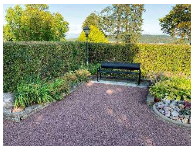
Sittplats omgiven av perennrabatter

För vidare beskrivning av objekten och eventuellt åtgärdsbehov, se kap. 6.