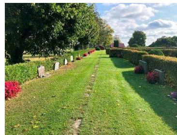
Rad med kalkstensplattor