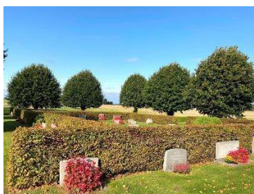
Utvidgningsområdets trädkrans och rygghäckar

För vidare beskrivning av objekten och eventuellt åtgärdsbehov, se kap. 6.