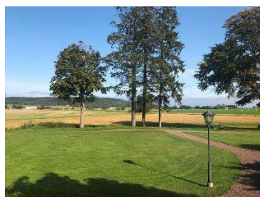
Vy mot norr