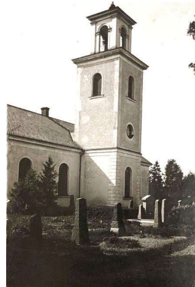
1924, fotografier från sydöst. Kyrkogården omgärdades av en trädkrans och klippt häck. I gravkvarteren fanns gravplatser med gravkullar, grusbeläggning och omgärdade av häckar eller gravramar (Antikvarisk-topografiska arkivet).