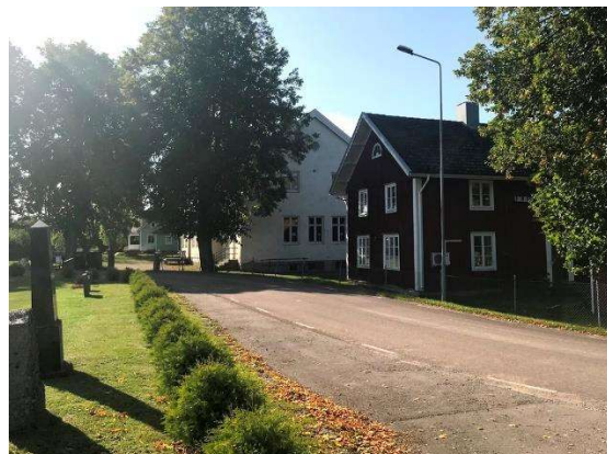
De båda skolbyggnaderna från 1850 och 1916