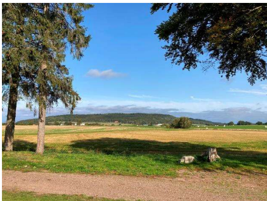
Landskapet norr om kyrkogården, med Omberg i bakgrunden

Kyrkogården har en något oregelbunden form med kyrkogårdens äldsta del kring kyrkan och 1950-talets utvidgningsområde något förskjutet mot nordväst. I öster mynnar kyrkogården ut i öppna gräsytor utan någon tydlig avgränsning.