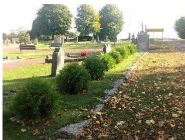
Klottujor och stensockel

Kyrkogårdens äldsta del omgärdas i väster och sydväst av klottujor. Längs östra sydsidan omgärdas en hagtornshäck. Längs både västra och södra sidan finns även en stensockel av huggen gråsten i marknivå. Hagtornshäcken och stensockeln fortsätter även längs den äldsta delens östra sida som en avgränsning mot minneslunden. Kring minneslunden finns en måbärshäck. 1950-talets utvidgningsområde omgärdas mot norr och väster av en kallmurad stödmur av kalkstensskivor. Innanför muren växer en tujahäck. Tujahäcken omgärdar även utvidgningsområdets sydvästra och östra sida.