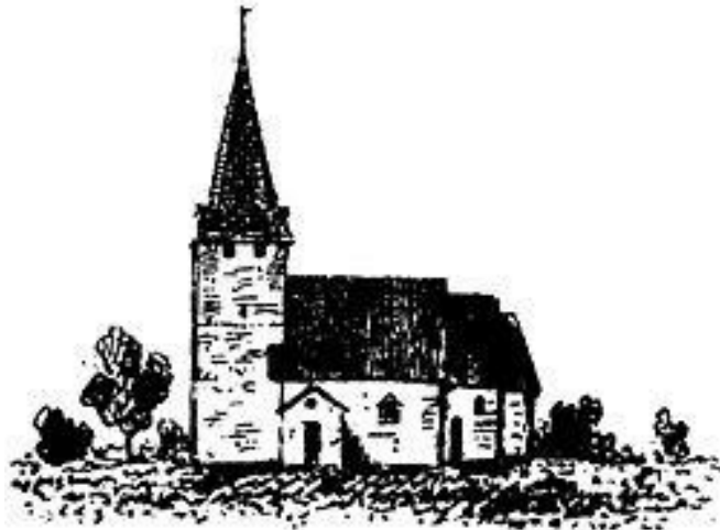
Västra Tollstads gamla kyrka avbildad av Pehr Arvid Säve ( Antiquarisk tidskrift för Sverige 1 ).

En karta från 1600-talets första hälft visar kyrkan och kyrkogården som omger den. Längs kyrkogårdens ytterkant löper en tydlig omgärdning, möjligtvis en kyrkogårdsmur. I omgärdningen syns tre ingångar, illustrerade som portar eller stigluckor. Öster om kyrkogården låg prästgården och ett kronohemman. Det omgivande landskapet utgjordes av åker- och ängsmarker.