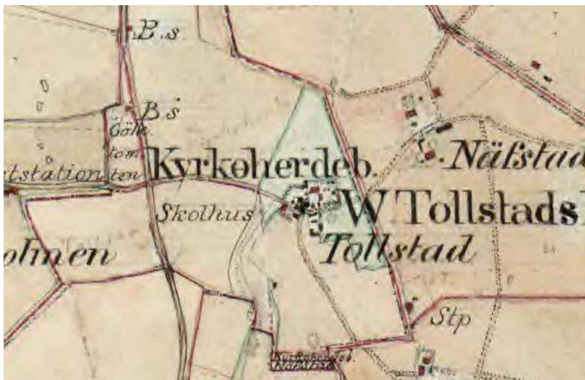
1868-77 Häradsekonomiska-kartan (Lantmäteriets historiska kartor).

Under 1840-talet genomgick kyrkan en omfattande ombyggnad. Större delen av den äldre kyrkan revs, endast en liten del sparades för att nyttjas som sakristia. Den nya kyrkan byggdes i nord-sydlig riktning, istället för den för kyrkor annars vanliga öst-västliga orienteringen. På häradsekonomiska kartan från 1868-77 har den nya kyrkobyggnaden markerats med en korsformad symbol, lätt förskjuten mot söder på den oregelbundet formade kyrkogården. Kring kyrkogården och prästgården i öster kan man ana att det fanns en omgärdande trädkrans. Några ingångar går inte att urskilja på kartan, men det är troligt att det sedan 1700-talets slut funnits en ingång mot landsvägen och skolhuset i söder. Ingången förseddes med ett grindparti och årtalet 1796 skrevs på ena grindstolpen. Detta grindparti finns kvar än idag.