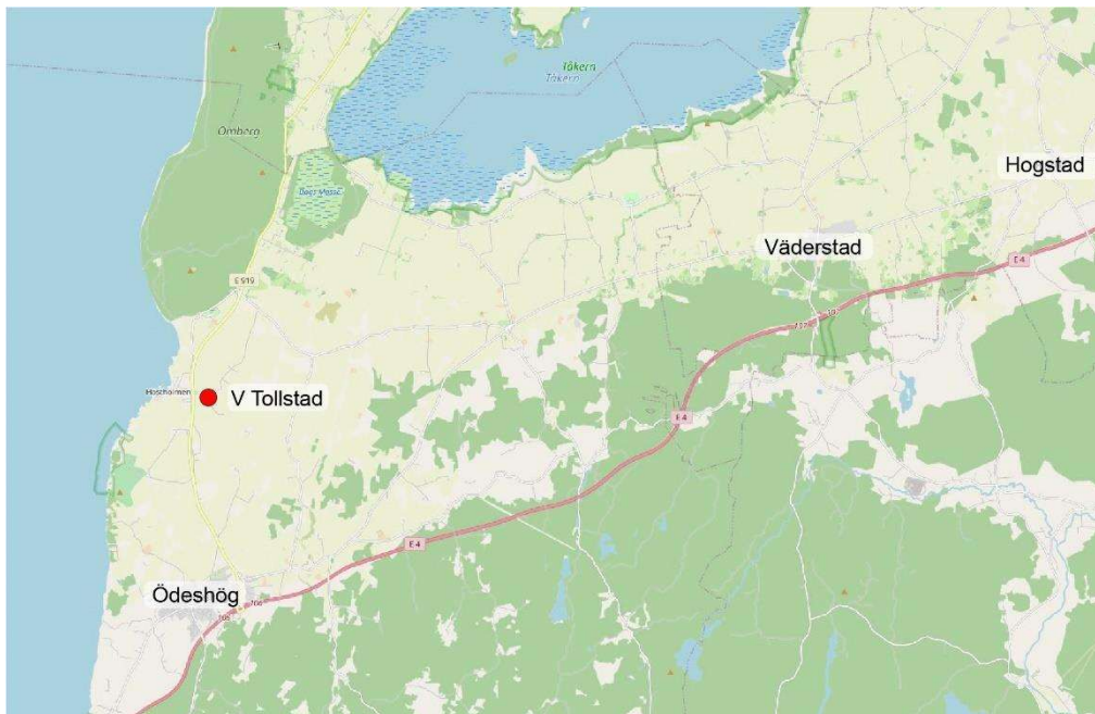
Kartvy, läget för Västra Tollstads kyrkogård framgår av röd cirkel (kartunderlag: openstreetmap.org).