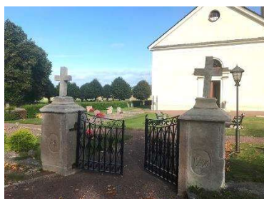
Grindparti i söder