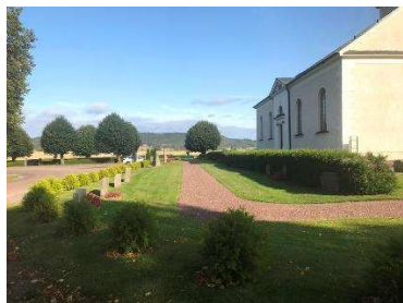
Kringgårdande gång på den äldsta delen