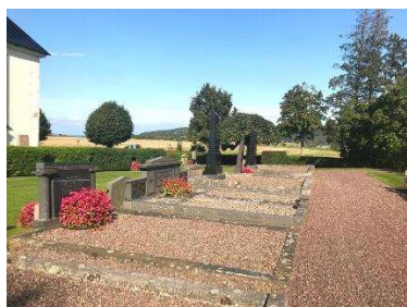
Gravanordningar från tidigt 1900-tal öster om kyrkan