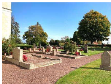
Gravar öster om kyrkan