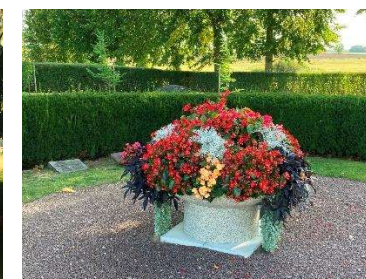
Säsongblommor vid urngravplatserna