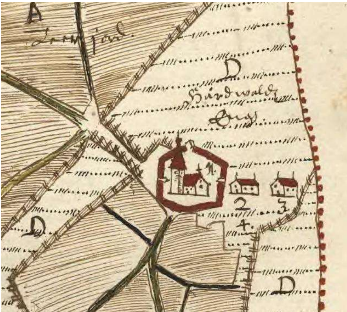
1639 Redovisningskarta. På kartan syns tydligt kyrkogårdens utbredning och ingångar i norr, öster och väster ( Lantmäteriets historiska kartor ).