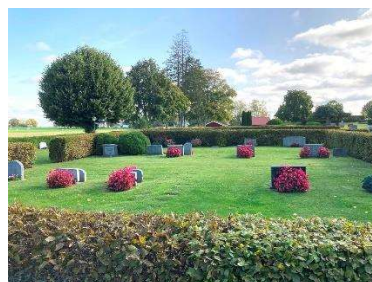
Gravvårdar från 1900-talets mitt och framåt i utvidgningsområdet