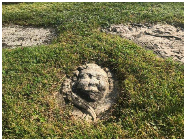
Del av kalkstenhäll, söder om kyrkan