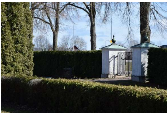
Den omgärdande tujahäcken längs södra sidan.

För en mer teknisk beskrivning av objekten, se kap. 6.