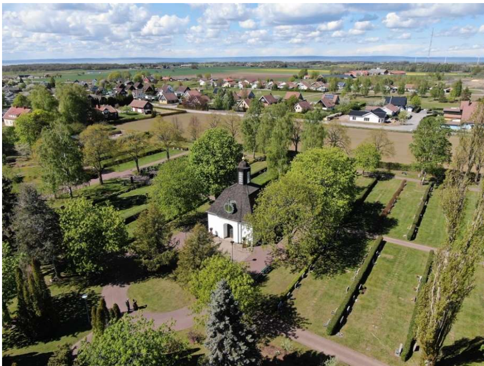
Kyrkogården från sydöst. Bortanför kyrkogården ligger villabebyggelse och odlingsmarker. Vid horisonten sträcker Vättern ut sig som ett blått band.