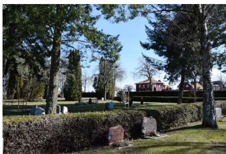
Lummig vegetation i kv. H.