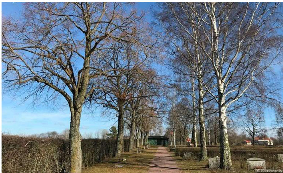
Kyrkogårdens yttre trädkrans med lind och den inre trädkransen med björk