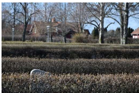
Ryghäckar i kv. F.