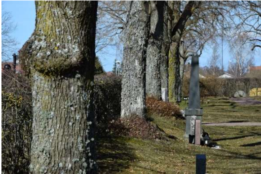
Träden i trädkransen skyddas av det generella biotopskyddet.

Kyrkogårdens trädkrans skyddas av det generella biotopskyddet enligt 7 kap. 11 § Miljöbalken. Vid nedtagning av träd i trädkransen kan det behövas dispens från det generella biotopskyddet, vilket söks hos länsstyrelsen.