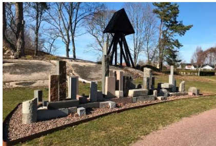
Steninstallation innanför parkeringsplatsens västra ingång.