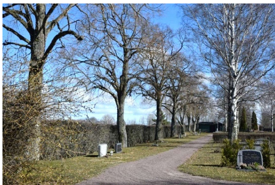
Den kringgående gången, längs kyrkogårdens norra sida.

För en mer teknisk beskrivning av objekten, se kap. 6.