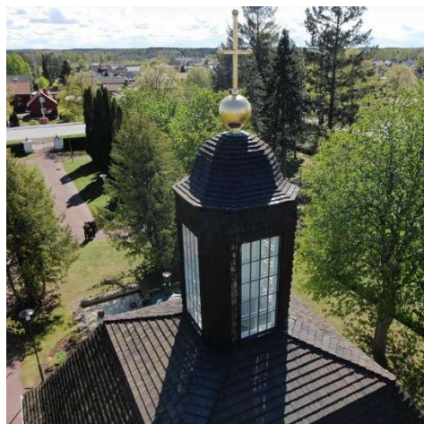
Mosaikfönster ovanför altaret