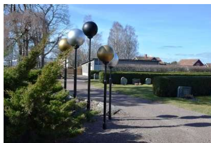
Arrangemang med olikfärgade klot norr om minneslunden.