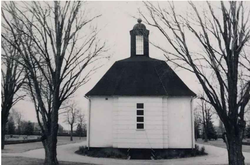
1973. Gravkapellet fotograferat från norr, omgivet av de nu uppvuxna hästkastanjerna. I bakgrunden skymtar gravområden som ramas in av låga klippta häckar.