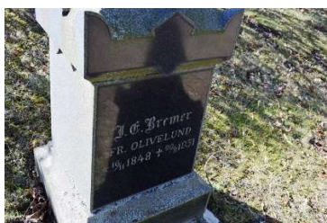
En av kyrkogårdens äldre gravvårdar, från 1931.

På kyrkogården dominerar gravvårdar från 1940-70-talet. Genomgående är gravområdena lagda i gräs med en gravrätt framför gravvården. Ett fåtal gravramar finns bevarade, främst i nordväst och sydöst, endast enstaka gravar har grusbeläggningen kvar.