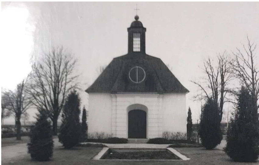
Till vänster och nedan: 1973. Gravkapellet fotograferat från söder. Fyra medelstora cypresser omger spegeldammen. De två främre individerna äretstår idag (ATA).