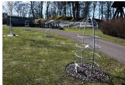
De bågformade ställningarna Steninstallationen skymtar i bakgrunden.