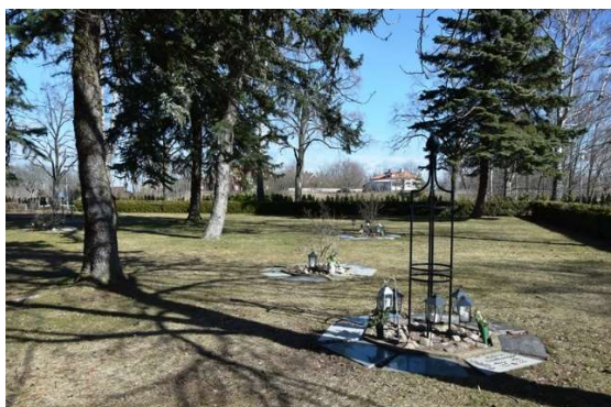
Strödda enheter med askgravplatser ordnade runt en smycknings- och planteringsyta.