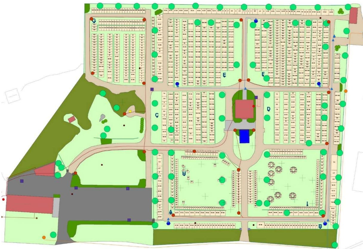
Ödeshög nya kyrkogård, 2019.