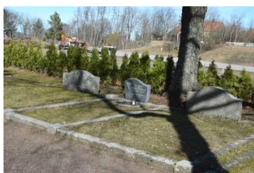
Ramomgärdade gravplatser med grässådd (t v) och grus (t h)