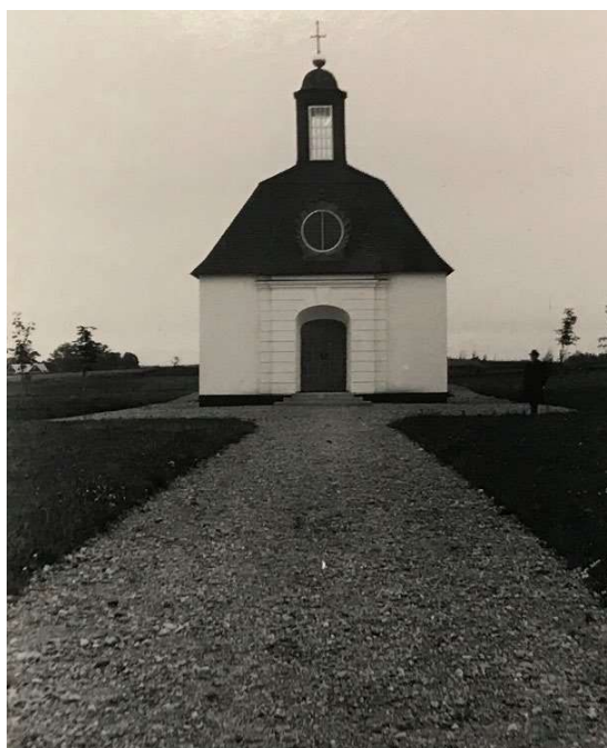
1927. Fotografier på gravkapellet och delar av den nyanlagda kyrkogården. En grusgång kringgärdar gravkapellet och i de omgivande gräsytorerna står de nyplanterade hästkastanjerna (ATA).

1973 byggdes gravkapellet om. Den största förändringen var att källaren grävdes ut för att rymma ett större bisättningsrum, förråd, omklädningsrum och toalett/dusch. En kisthiss installerades från källaren upp till ceremonirummet. Själva ceremonirummet genomgick en omfattande ombyggnad; vid entrén byggdes nya mellanväggar med vindfång och utrymmen för organist och officiant. Rummet fick nytt kalkstensgolv istället för det tidigare tegelgolvet samt nytt murat altare med kalkstensöverliggare och nytt mosaikglasfönster mot norr. Även belysningen och elvärmen uppdaterades. Exteriört kläddes plåtkulan och smideskorset på lanterninen med bladguld, byggnaden putsades om och målades med Keim mineralfärg. Taklanterninens järnplåtsklädnad ersattes med koppar.