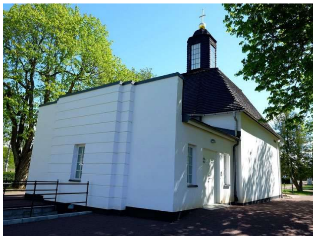
Tillbyggnaden mot norr från 2012.