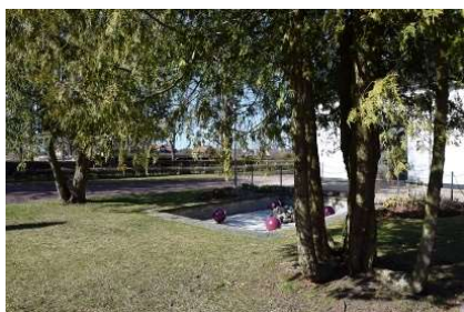
Spegeldammen framför gravkapellet.

För en mer teknisk beskrivning av objekten, se kap. 6.