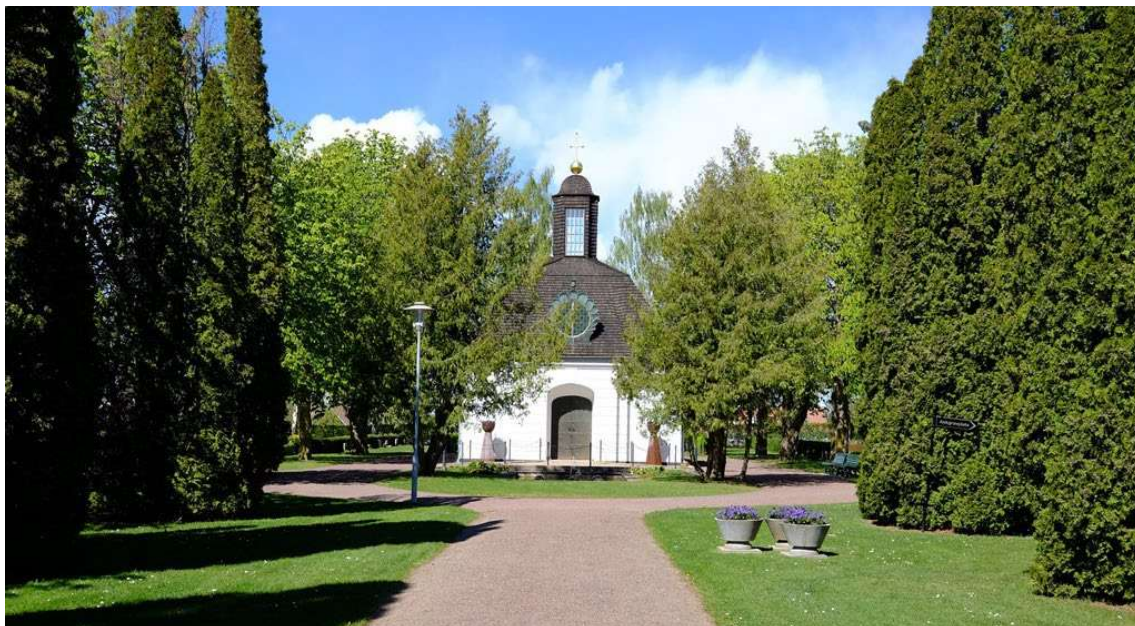
Gravkapellets södra fasad