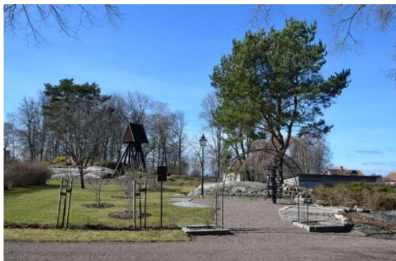
Minneslunden. Berknallar och skogsdunge i bakgrunden.