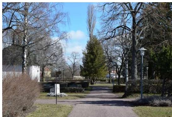
Gång mot gravkapellet, lagd med tankbeläggning.