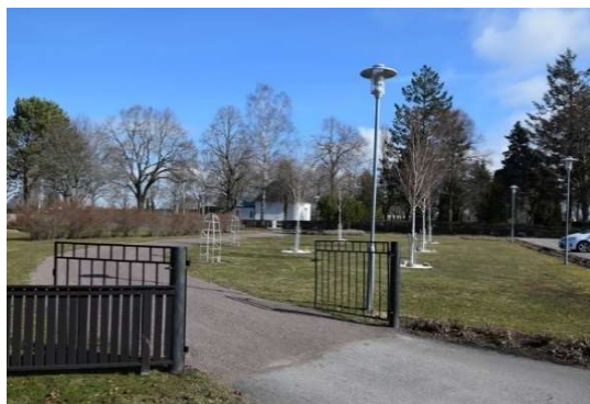
Den västra ingången från parkeringen.