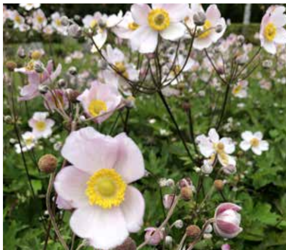
Blommor.