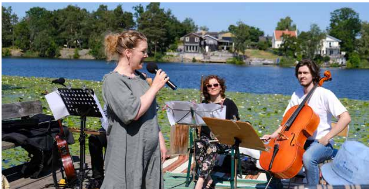
Foto: Musik vid bryggan