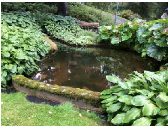
KGF resa till Sundsvall. Damm på Mjösunds begravningsplats.