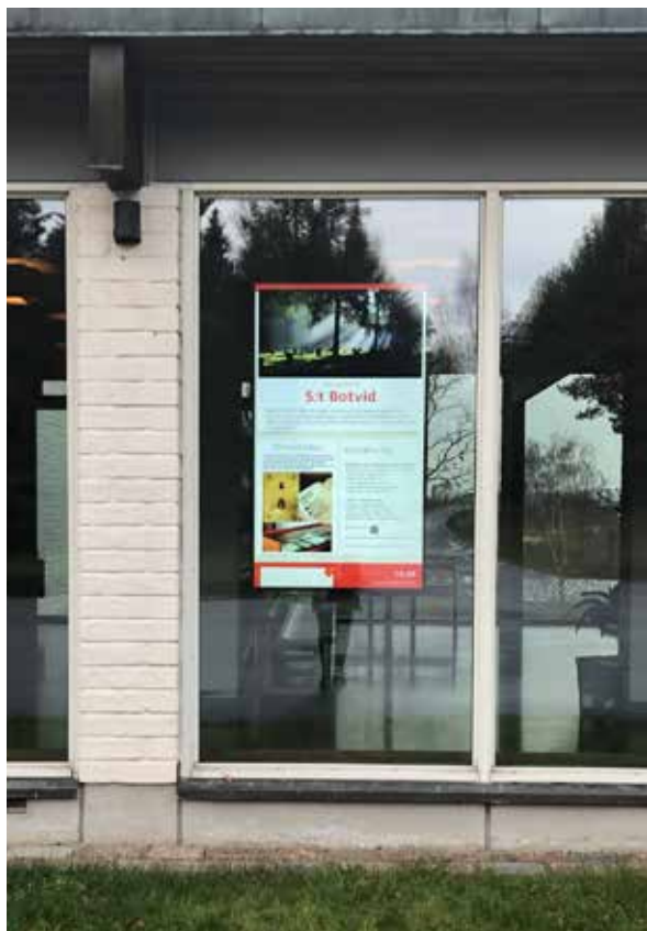
KGF har installerat en digital skärm i fönstret på St Botvids kapell