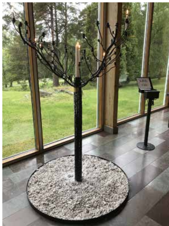
Ljusbäraren i S.t Botvids kapell.