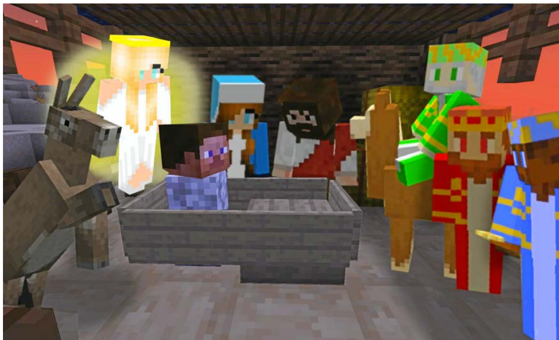
Barn och unga har varit med och skapat julgudstjänsten i Minecraft. Här syns Jesusbarnet i krubban.