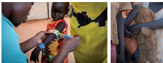
Bilder från barnens vardag i flyktinglägret Pamir i Sydsudan.

mår dåligt. Han brukar ta undan de barnen och försöka prata med dem. Vissa uttrycker sig bättre om de får rita eller använda modeller. Då kommer deras upplevelser fram i form av till exempel bepansrade jeepar eller vapen. Kafi säger att många inte har någon att prata med hemma.