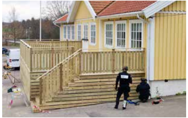
Här läggs sista handen på altanen vid Jörlanda församlingshem.

Nu kan församlingen i Jörlanda se fram emot kommande vårens värmande sol då de kan fika utomhus vid församlingshemmet. En ny stor altan har kommit på plats med direkt ingång mot stora salen i församlingshemmet.