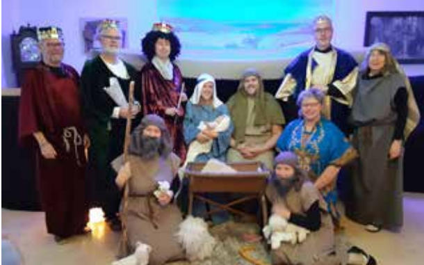
Det är många engagerade i julvandringen. Här en bild på förra årets ensamble.

Det traditionella julspelet bakom kyrkan i Jörlanda har sedan förra året bytts ut mot en julvandring i församlingshemmet. Då, första gången, var det nästan uteslutande för inbjudna skolklasser. I år blir det fler föreställningar för allmänheten.