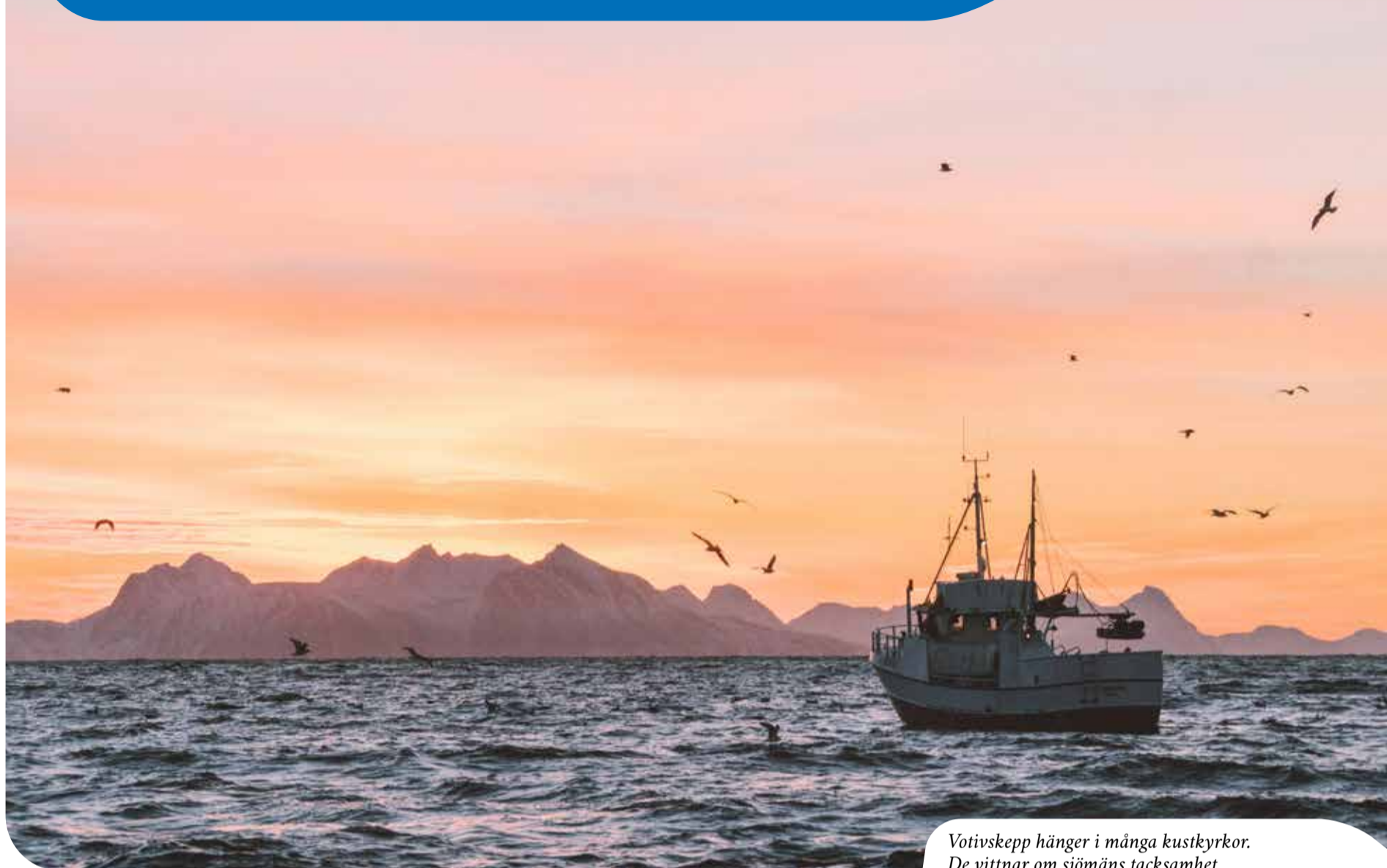
Votivskepp hänger i många kustkyrkor. De vittnar om sjömäns tacksamhet.