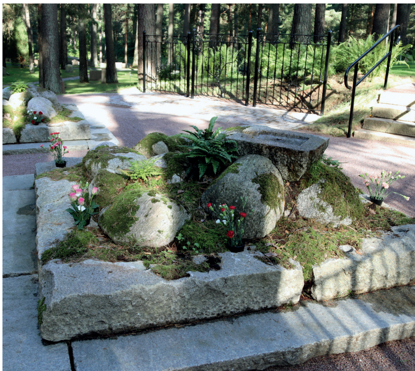
Nya Minneslunden Skogskyrkogården.

Som anhörig får du smycka med snittblommor och ljus på avsedd plats. Kyrkogårdsförvaltningen ansvarar för skötseln och plockar bort vissna blommor, utbrända ljus m.m.