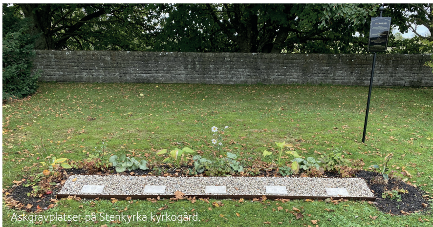
Askgravplatser på Stenkyrka kyrkogård.

Innan upplåtelse kan ske måste en överenskommelse angående skötseln tecknas och betalas. Idag uppgår priset till 2300:- för 25 år, då ingår även namnbricka med montering. Vid en ytterligare gravsättning får man betala för förlängning med aktuellt antal år och för en ny bricka med två namn. Efter 25 år skickas förfrågan ut till innehavaren om ev. förnyelse. För ytterligare detaljer, kontakta förvaltningens expedition.