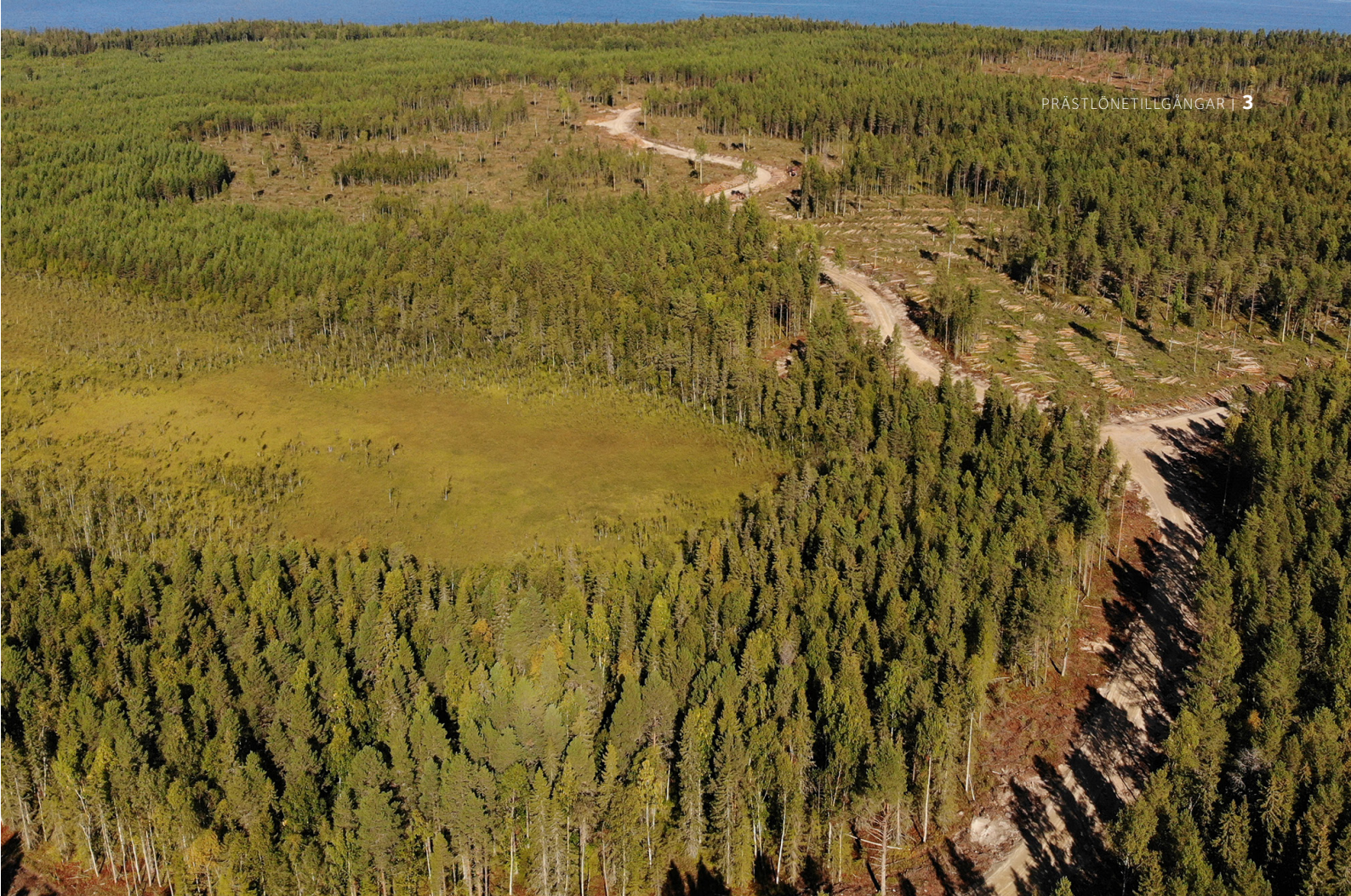
Föryngringsavverkning i Piteå skärgård..