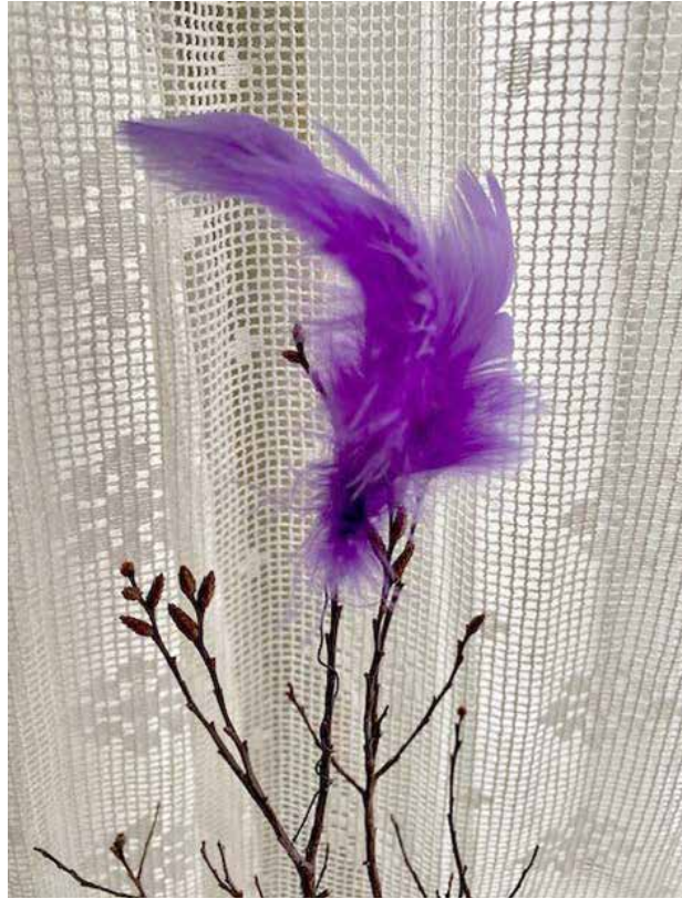
På lördagen före fastlagssöndagen tar Barbro fram den lila fjädern och sätter den i några kvistar i en vas.