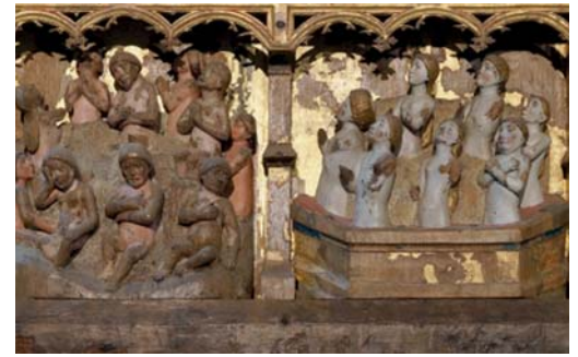
Birgitta – skärselden.