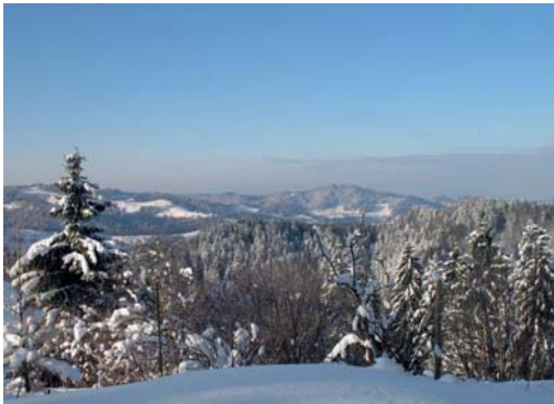
Mil efter mil.