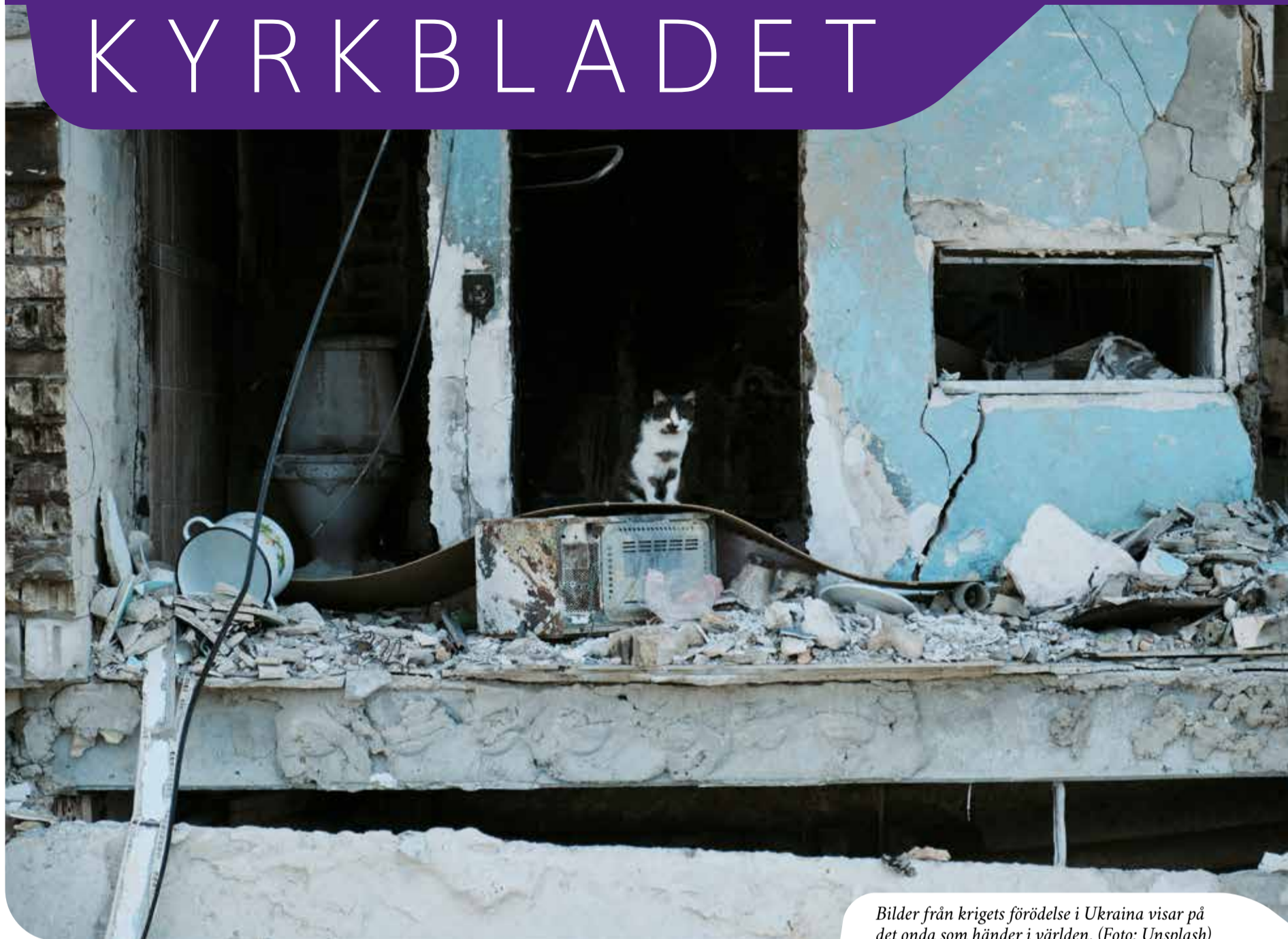
Bilder från krigets förödelse i Ukraina visar på det onda som händer i världen.