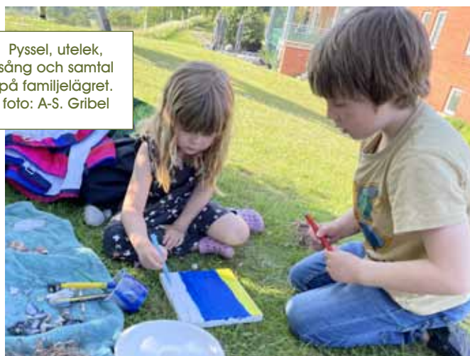
Pyssel, utelek, sång och samtal på familjeläget.