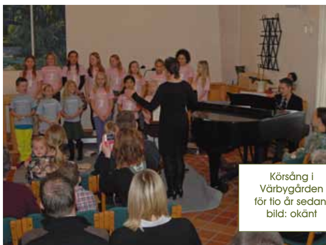
Körsång i Värbygården för tio år sedan.