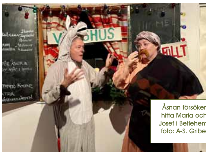
Åsnan försöker hitta Maria och Josef i Betlehem.