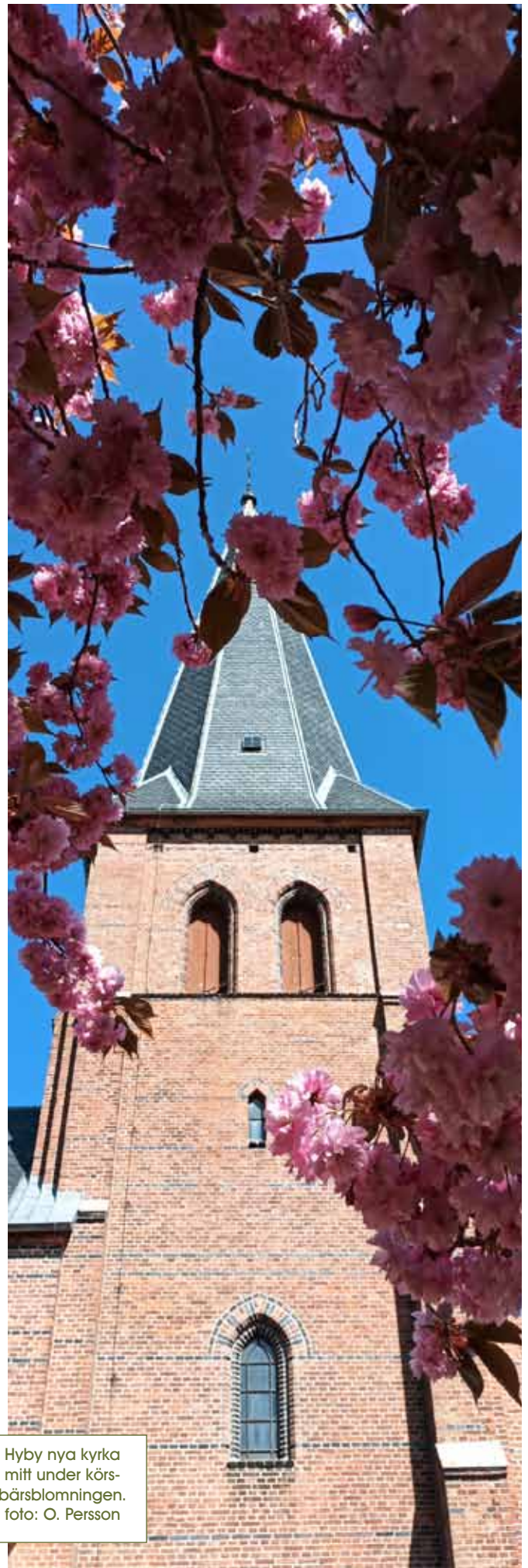
Hyby nya kyrka mitt under körsbärsblomningen.