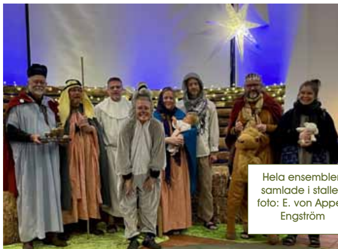
Hela ensemblen samlade i stallet.