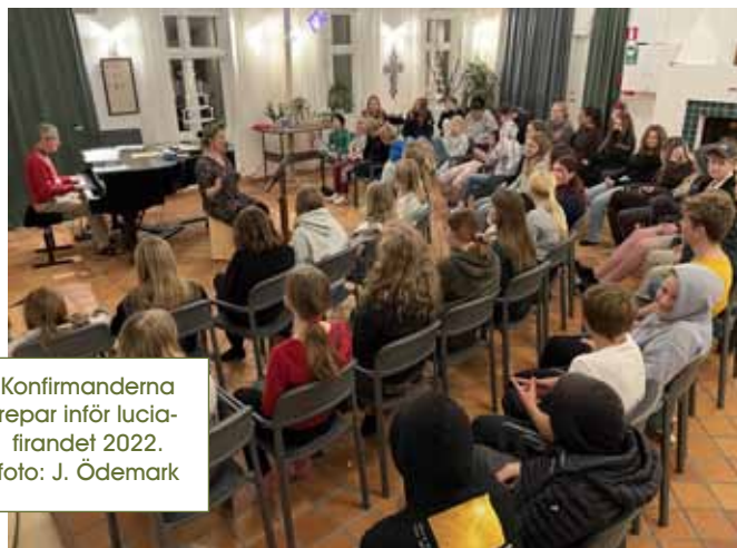
Konfirmanderna repar inför lucia- firandet 2022.