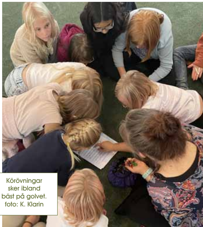
Körövningar sker ibland bäst på golvet.