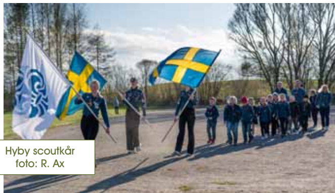
Hyby scoutkår