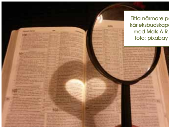
Titta närmare på kärleksbudskapet med Mats A-R.