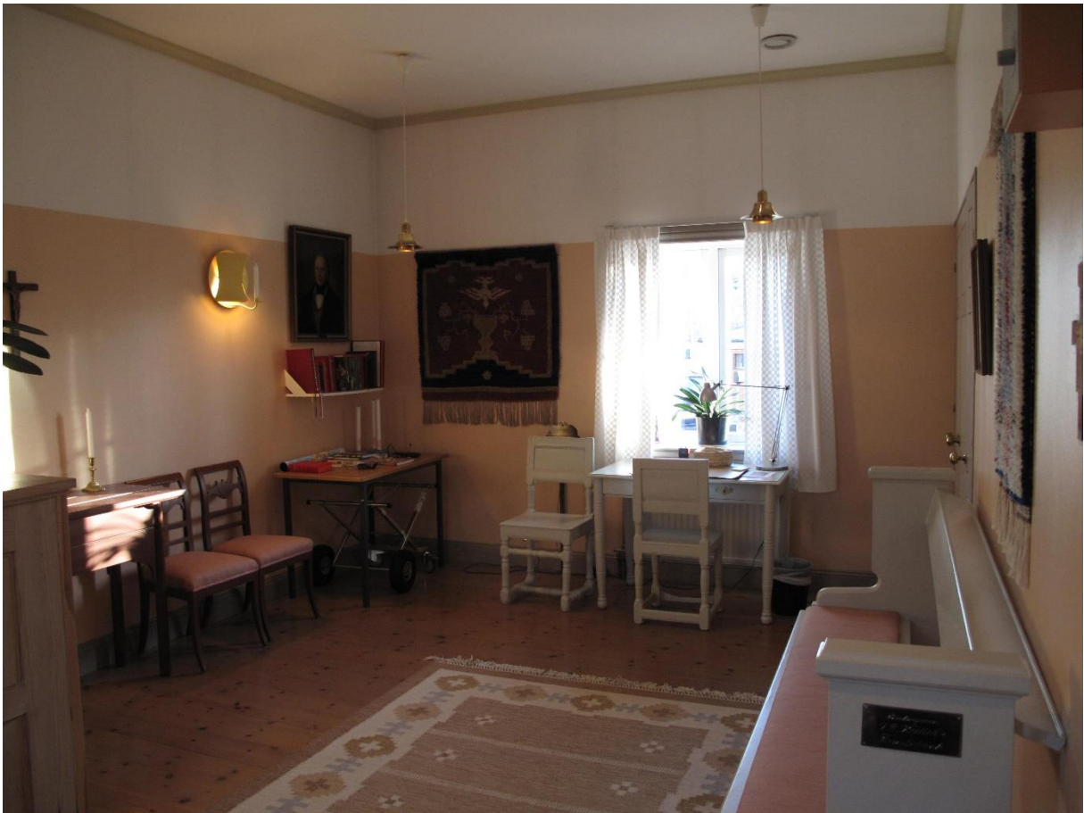
Sakristian med äldre ommålade möbler samt altaret från restaureringen 1983-84.

Sakristian utgör ett väl sammanhållet rum med en medveten gestaltning av ark. Jerk Alton, från tillkomsten i samband med restaureringen 1983-84. Få förändringar har skett.