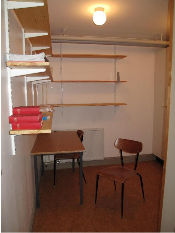
Ekonomiutrymmen i källaren.