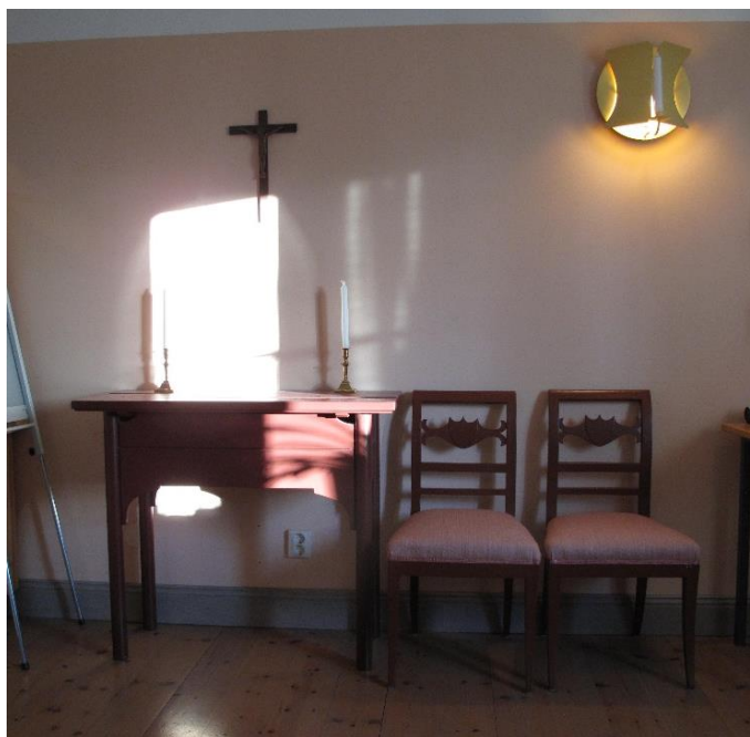
Altare samt armatur.