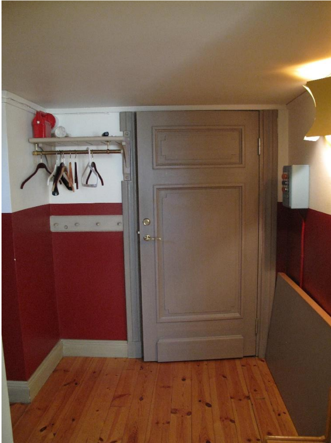
Hallen med spegeldörr, listverk, hatthylla, knappbräde, armatur mm från restaureringen 1983-834.