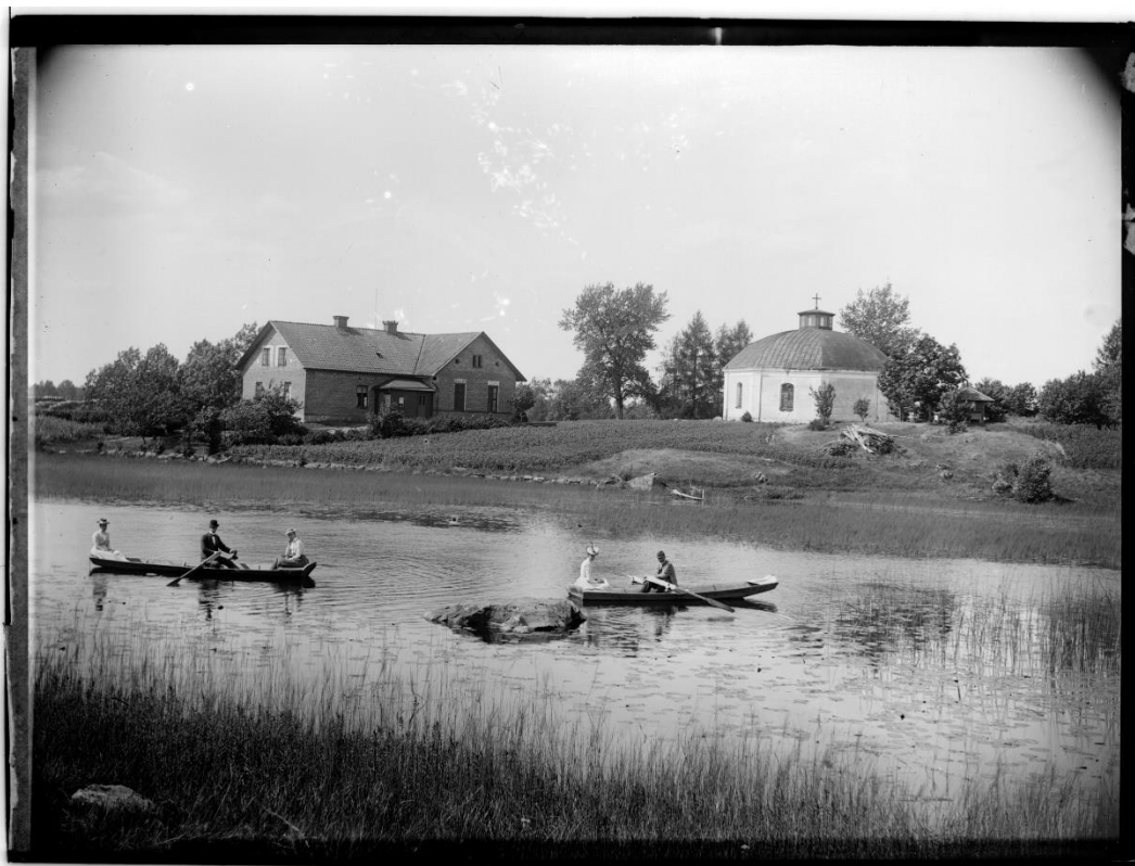
Vedevågs kyrka 1901.

Wedevågs bruk finns kvar än i dag, om än med namnet Wedevåg Tools, och är ett av landets äldsta bruk. Genom århundradena har bruket med dess verksamhet format och bidragit till utvecklingen av samhället Vedevåg.