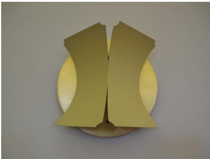
Kyrkorummets armaturer tillkom vid restaureringen 1983-84.