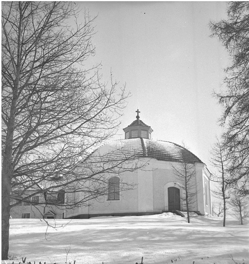
Vedevågs kyrka 1941.

Nuvarande Vedevågs kyrka uppfördes som ett brukskapell som stod färdigt 1837 och bekostades av brukspatron Eric Cederborgh. Kyrkan kom att ägas av Wedevågs bruk. Mot slutet av 1800-talet blev kyrkan öde men redan 1914-16 lät Wedevågs bruks dåvarande ägare David Cable Keiller bekosta en grundlig restaurering av kyrkan.