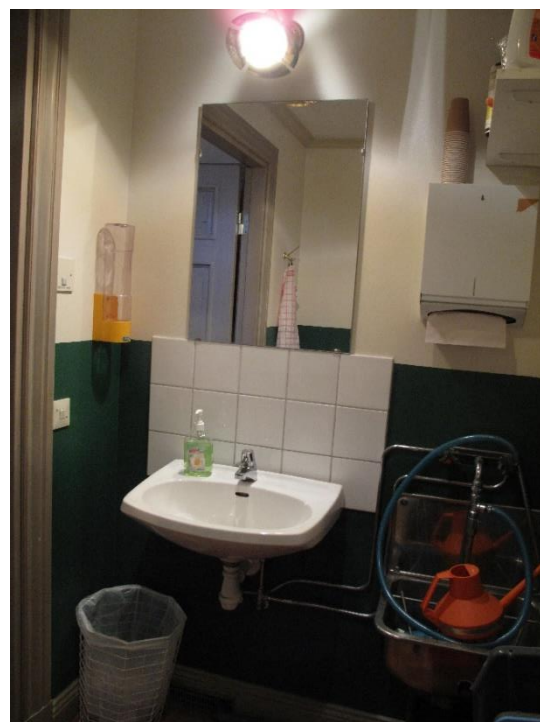
Toalettutrymme med bland annat grovvask.

Toalettutrymmets utformning från restaureringen 1983-84 har genomgått få förändringar.