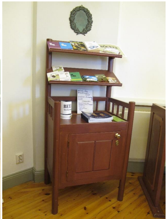
Andaktsbord, bänkinredning samt bokbord tillkom vid restaureringen 1983-84.