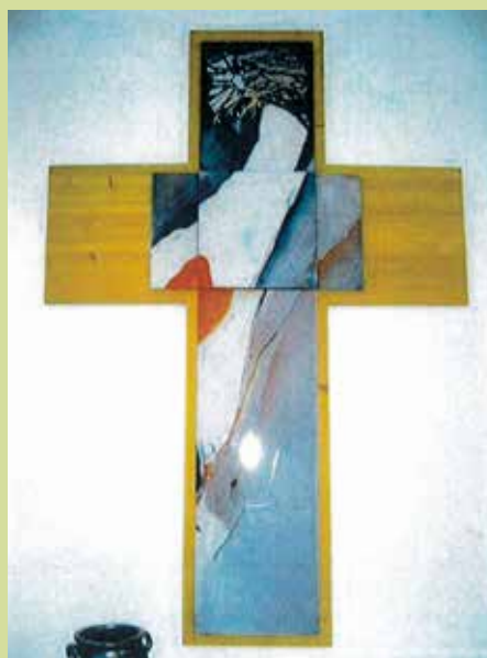
Knut-Yngve Dahlbäcks kors i trä och emalj.

LARS STENSTRÖM KYRKOGRÅRDS- OCH FASTIGHETSCHEF