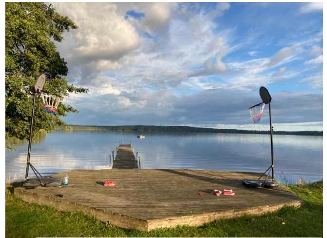
Gransnäs ungdomsgård.