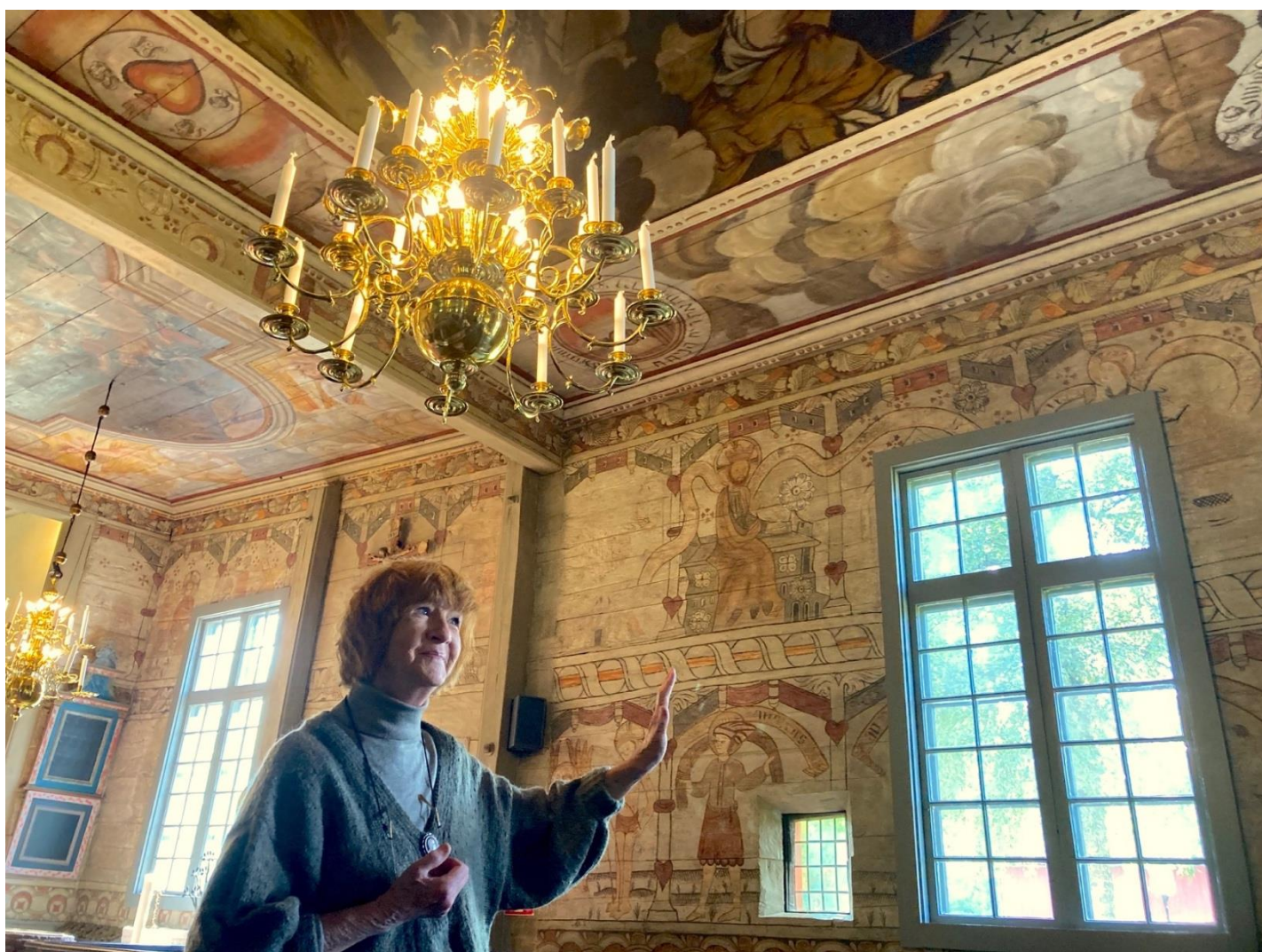
Samtal och visning i Vireda kyrka.