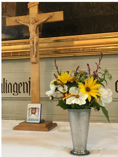
Förberett för visitationsmessa i Sunds kyrka