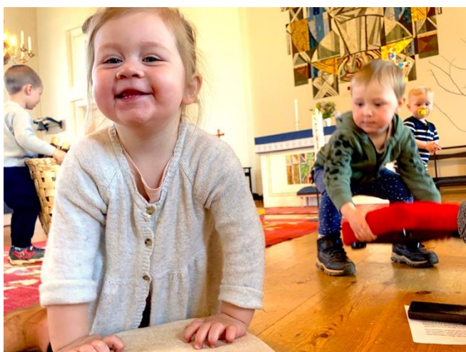
Bön och lek med förskolebarnen i Östra Ryds församling

Ansvar för att göra uppföljningen ligger hos församlingens eller pastoratets ledning. Stöd och hjälp för uppföljningen finns hos stiftsorganisationen. Under mötet förs anteckningar över det man är överens om att följa upp. De sprids till visitationsledningsgrupp, prost, direktor och diarieför. Kontraktsprosten kan sedan använda sig av anteckningarna vid fortsatt kontakt. I och med detta möte är visitationsprocessen slut.