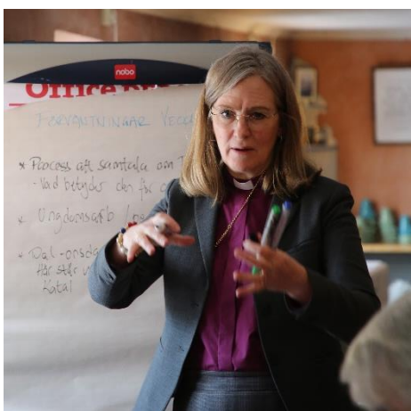
Inledande samtal i Vadstena pastorat

Det sista mötet inför visitationsdagarna hålls på stiftskansliet med biskop, kyrkoherde, visitationsledningsgrupp, kontraktsprost och visitationshandläggare. Denna gång går man noga igenom schemat inför visitationsdagarna, diskuterar oklarheter och praktiska frågor.