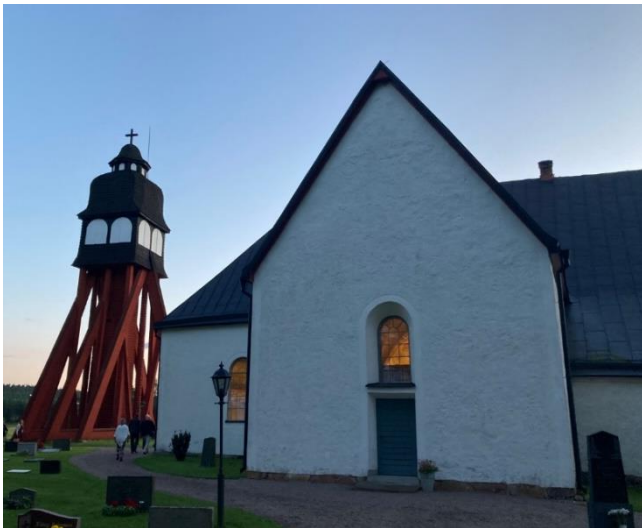
Samtal och visning av Djursdala kyrka.