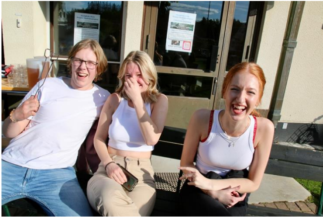
Hamburgare och bön med ungdomarna i Lillkyrka.