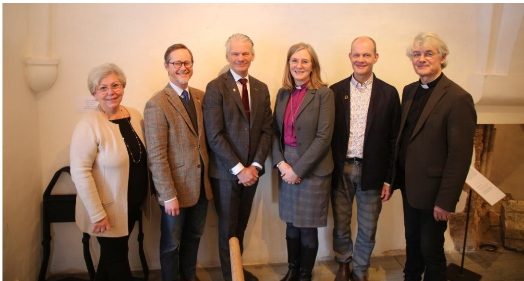
Samtal med kommunrepresentanter i Vadstena pastorat

I god tid före biskopsvisiten meddelas prost och kyrkoherde utsatt datum för besöket. Kyrkoherden har ansvar för att bjuda in personer till de olika punkterna och stämma av med stiftets visitationsansvariga minst en månad innan besöket. Stiftets visitationsansvariga är behjälpliga som bollplank. Kontraktsprosten dokumenterar erfarenheter från dagen.