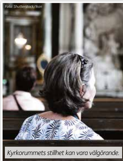
Kyrkorummets stillhet kan vara välgörande.

I retreatens tystnad ägnar vi lite mer tid i tystnad tillsammans med andra. Där kan vi hitta en vilans plats, en nådens plats. Det kan även vara en plats där vi möter oss själva, vår verklighet och fördjupas i vår tro och tillit.