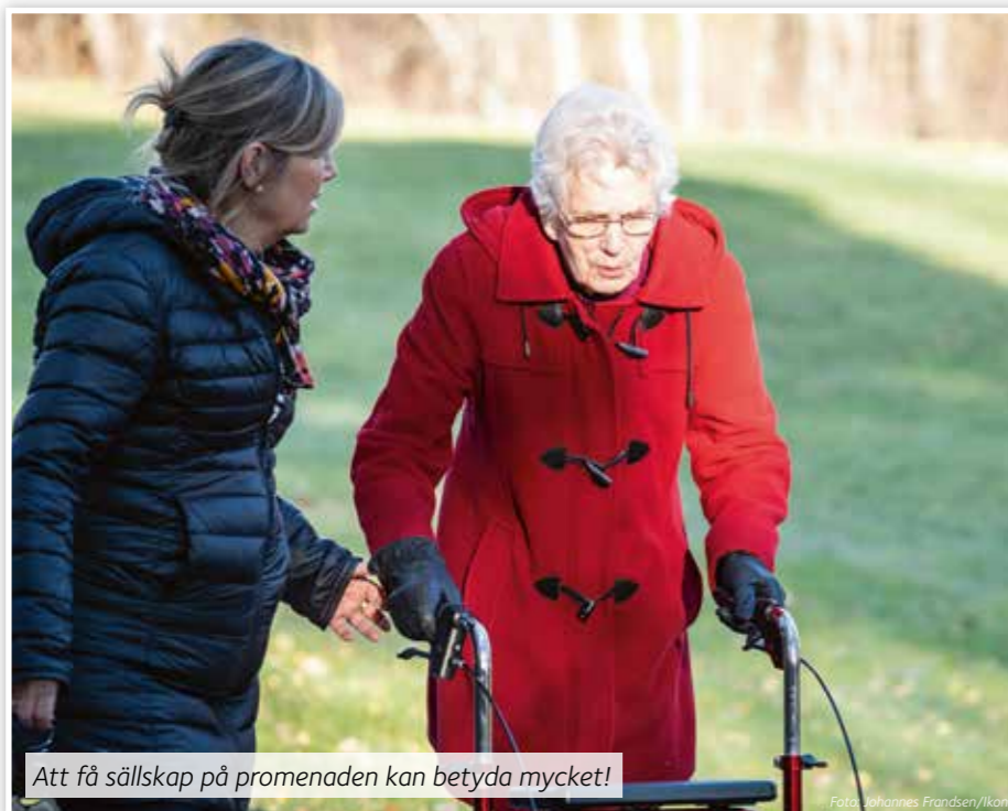
Att få sällskap på promenaden kan betyda mycket!

Vi besöker dig som är ensam. Besöken kan ske i ditt hem eller på äldreboendet. Det finns många som skulle glädjas över att få besök.