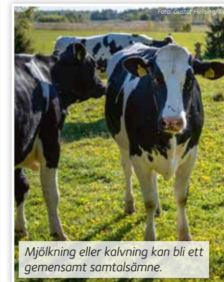
Mjölkning eller kalvning kan bli ett gemensamt samtalsämne.

Rödjan. Första gången ville jag inte vara med, trodde att ni skulle fråga ut oss. Nu ser jag fram emot att ni kommer hit.