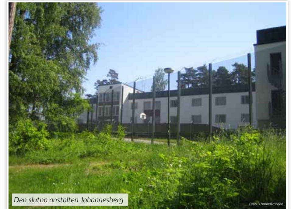
Den slutna anstalten Johannesberg.

– Man känner sig för en stund som en vanlig människa, säger en intagen på