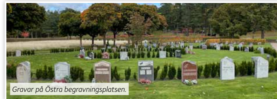
Gravar på Östra begravningsplatsen.