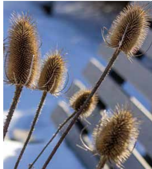
Kardvädd är en gammal kulturväxt.