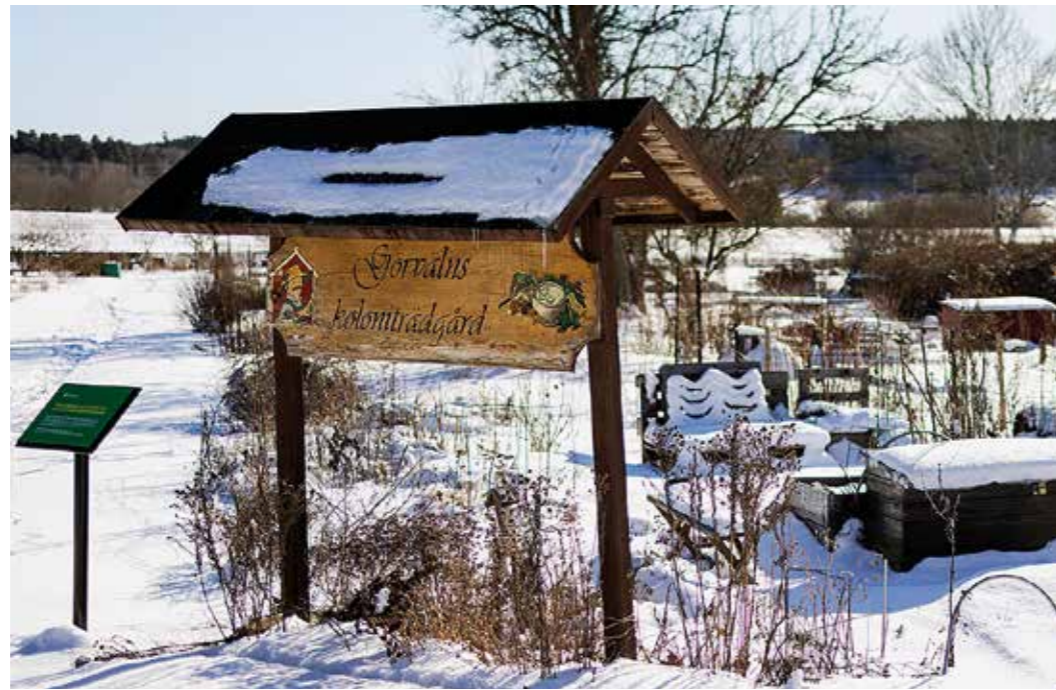
Entré till Görvälns koloniträdgård.