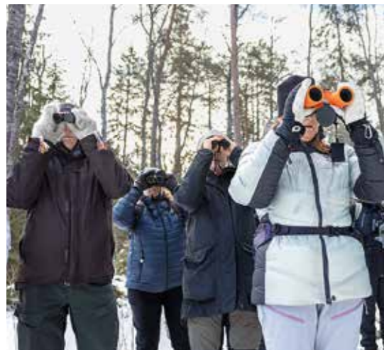
Studieobjekt i sikte.