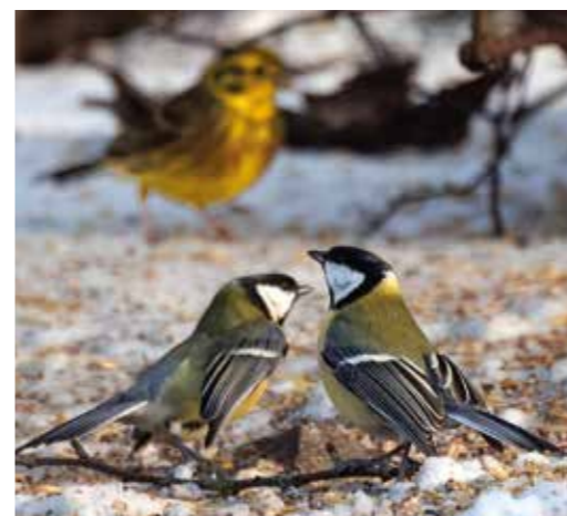
Talgoxar, gulspurv i bakgrunden.