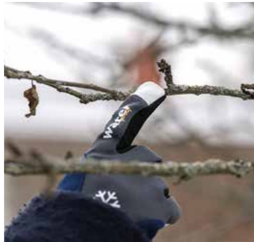
Fruktved, början på ett äppelskott.

– Det finns väldigt mycket vackert att njuta av i trädgården även under vintern.