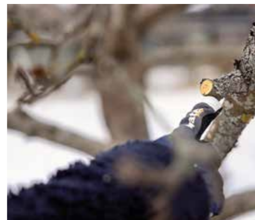
Felaktigt snitt (en sk. klädhängare) till vänster, rätt snitt till höger.