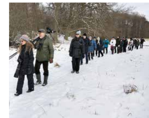
Söndagsvandring i februari.

” Vandringen är i mycket en social verksamhet. Syftet är att fågelintresserade ska kunna umgås under en lätt promenad. Man lär sig alltid något nytt.