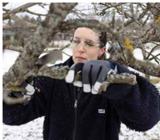
Snittet läggs alldeles vid grenkragen.