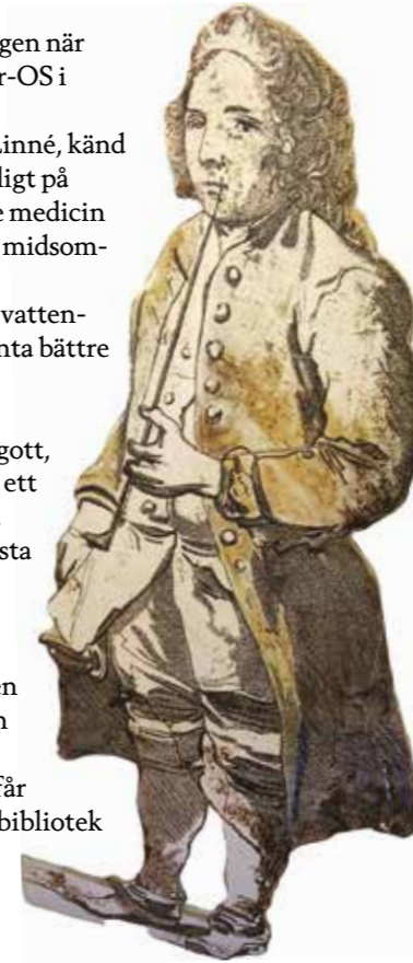
Teckning av arkitekten och grafikern Jean Eric Rehn, född 1717 i Stockholm.