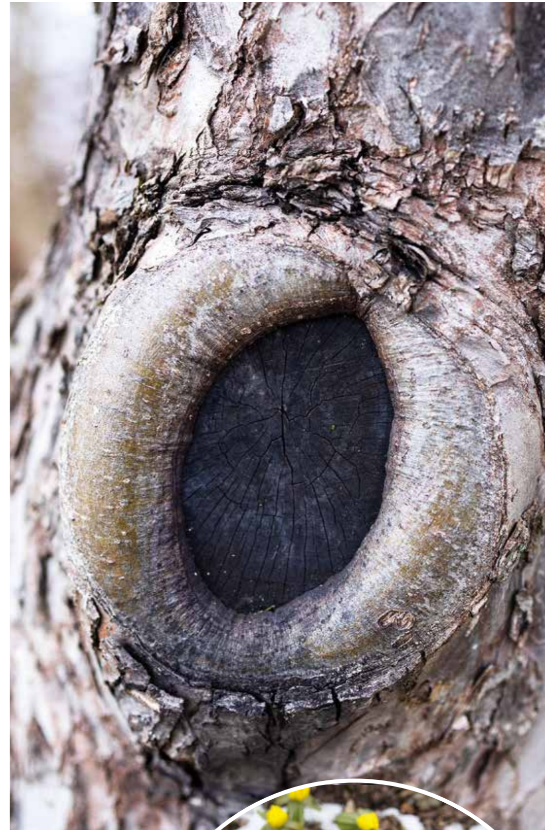
Lyckad övervallning efter snitt.