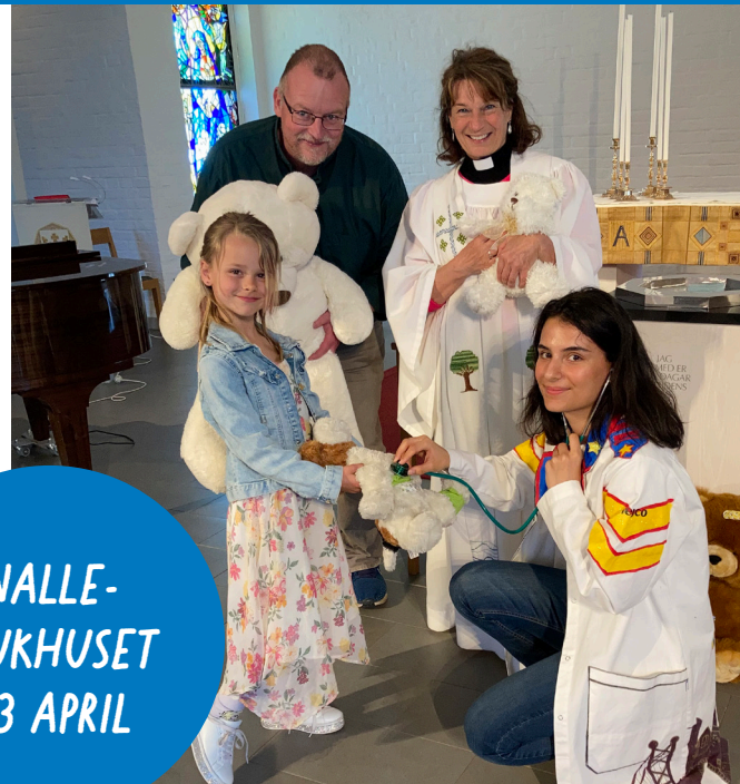
NALLE- SJUKHUSET 23 APRIL