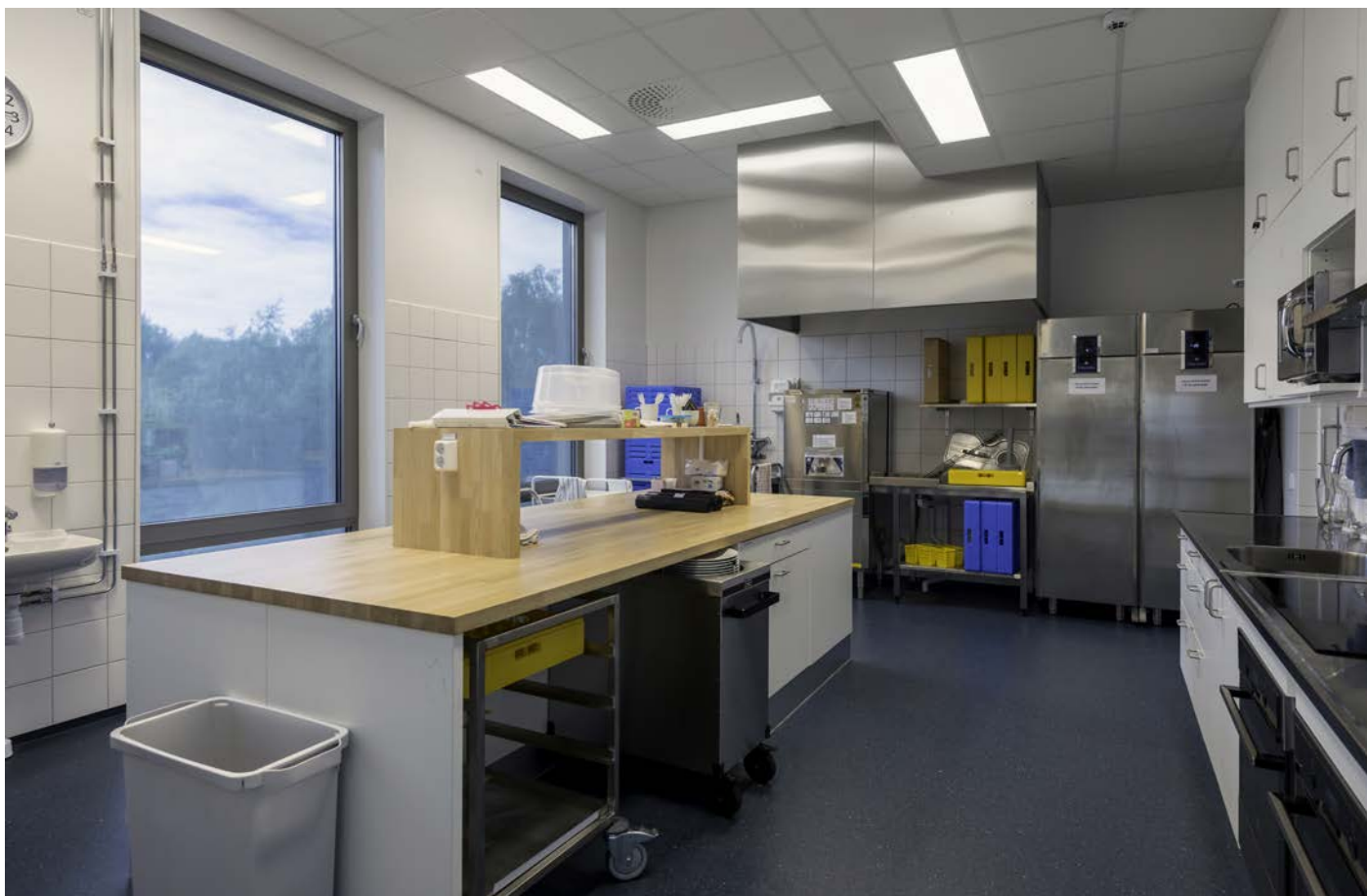
Askims församlingshem - kök