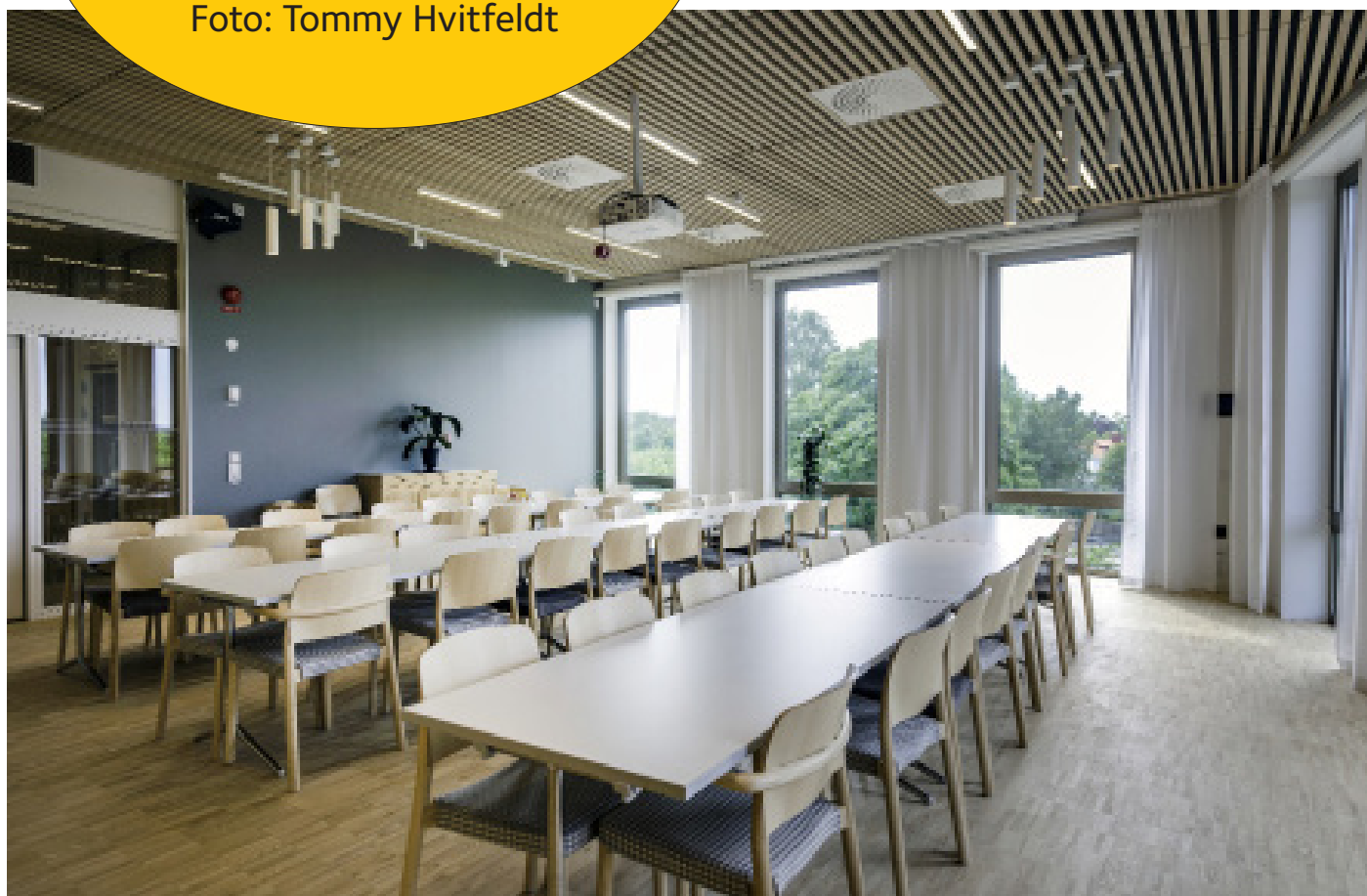
Askims församlingshem - stora salen