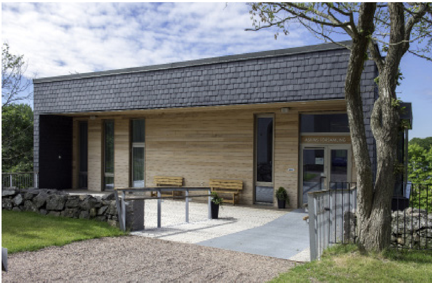
Askims församlingshem - entré