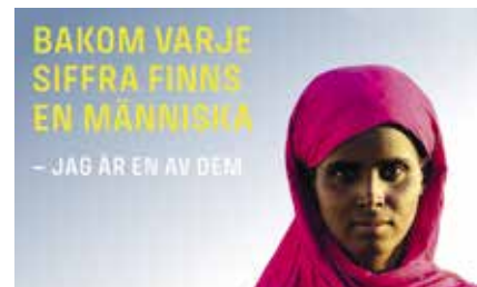
Hällma, Etiopien.

Den första juni startade Act Svenska kyrkans sommarkampanj med fokus på det humanitära arbetet. Under rubriken "Bakom varje siffra finns en människa" lyfts människorna bakom statistiken fram.