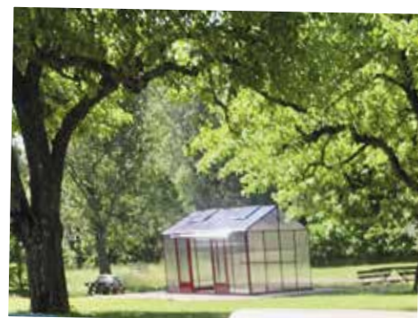
Café Äppellunden på Ingarö är en lummig oas. Nytt för i år är bingo på tisdagar för äldre och andra bingosugna.

– Våra caféer har haft lite olika fokus, på Ingarö har vi varit mer inriktade på barnfamiljer. Men en nyhet för i år, för att