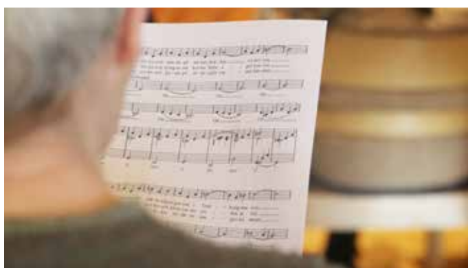
Det gåfulla folket är en av sångerna som sjöngs under vårkonserten i Skutskärs kyrka den 14 maj.