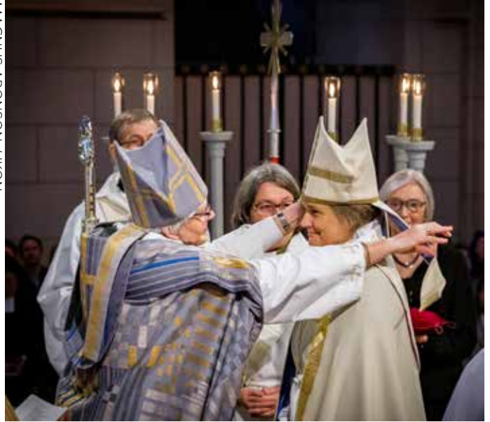
Mitran, biskoparnas mössa, är utformad som eldslåga.