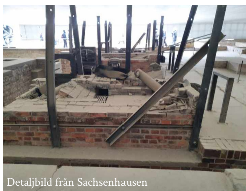
Detaljbild från Sachsenhausen

Jag tyckte att det var väldigt intressant att vara på koncentrationslägret då man fick en annan bild av kriget. Det var kul att vara med vänner och vi kunde dela både jobbiga och roliga minnen för livet tillsammans.