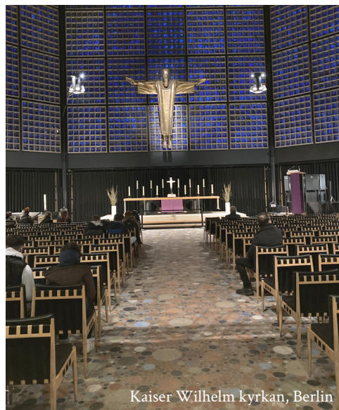
Kaiser Wilhelm kyrkan, Berlin