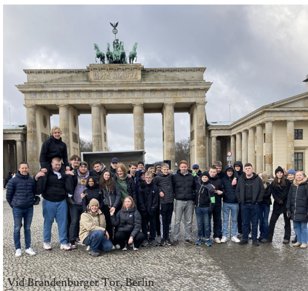
Vid Brandenburger Tor, Berlin

Vi besökte Sachsenhausens koncentrationsläger vilket var en minnesvärd upplevelse. Det är viktigt att minnas vad som hänt även om det kan kännas överkligt och att det aldrig kan hända oss. Det väckte tankar och funderingar om hur något sådant skulle kunna ske. Sen gick vi också på stan, käkade gott, hade bussaktiviteter och kollade mello. Det var bra att åka på resa för då kommer man varandra lite närmare och vi lärde känna konfirmanderna bättre. Det var också intressant att se Tyskland och deras kultur.