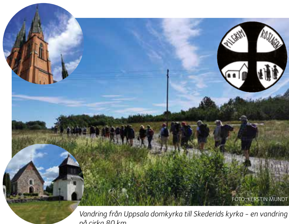
Vandring från Uppsala domkyrka till Skederids kyrka - en vandring på cirka 80 km.