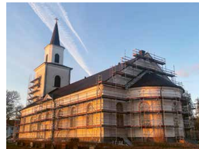
Flisby kyrka får en ny skinande fasad av vit puts.