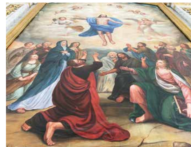
Altartavlan i Flisby kyrka restaureras av konservatorer från Jönköpings läns museum.