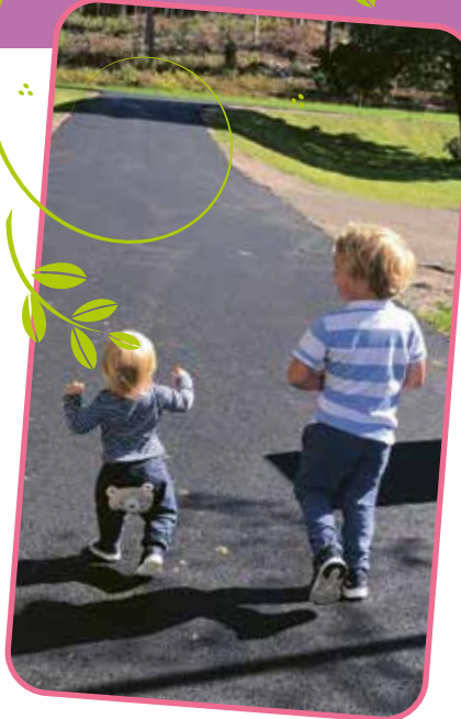
TEXT OCH FOTO: JOHANNA BRODD

Det finns så många vägar! Långa, korta, slingriga, raka, uppförsbackar, nerförsbackar och oväntade svängar hit och dit. Ibland vet vi precis vart vi är på väg och ibland känns det alldeles omöjligt att hitta rätt. Så skönt att veta att Gud alltid går med oss, vilken väg vi än vandrar!