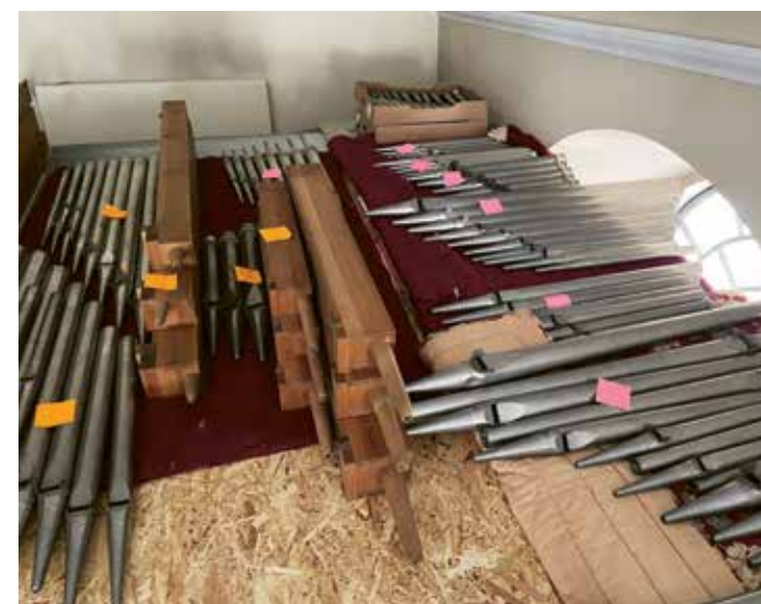
NordströmsOrgeln i Flisby kyrka är för tillfället nermonterad och ligger upplagd i väntan på rengöring och återmontering.