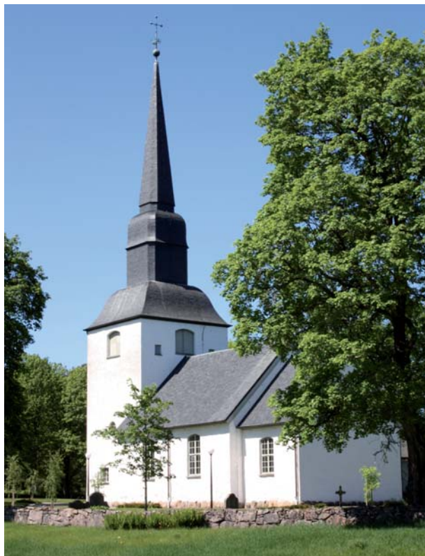
Kinnarumma kyrka