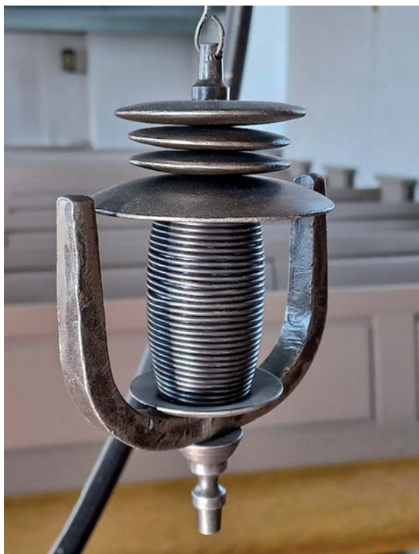
Vingdonet i ljusbäraren, Kinnarumma kyrka