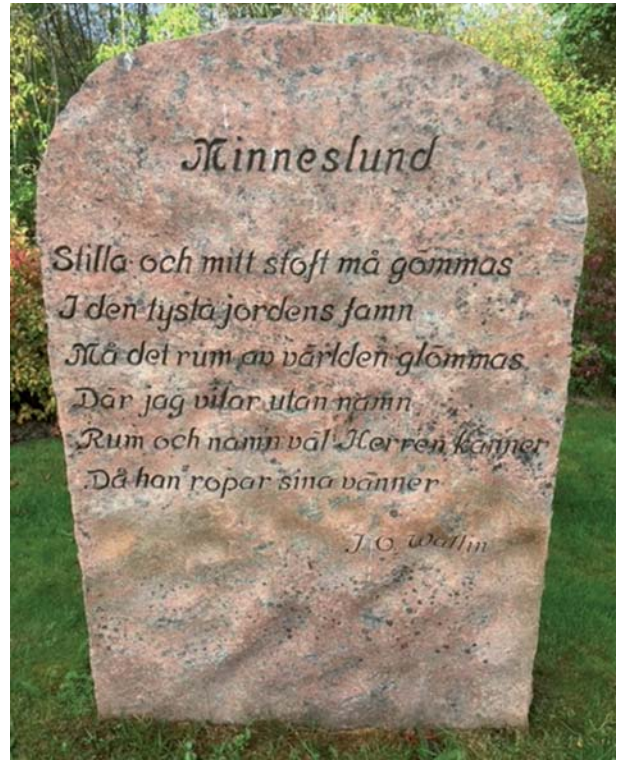
Minneslunden i Kinnarumma

Min resa till att för socialdemokraterna bli förtroendevald i Kyrkoråd och Kyrkofullmäktige och lite senare i Kinnarumma församlingsråd började i samband med kyrkovalet 2021. Kinnarumma pastorat har många viktiga frågeställningar att bearbeta och utveckla. Vilken församlingsverksamhet bör prioriteras och hur blir budget i balans. Vilka förväntningar finns på kyrkan lokalt idag? Hur kan fler människor känna trygghet och delta i den verksamhet som kyrkan erbjuder lokalt?