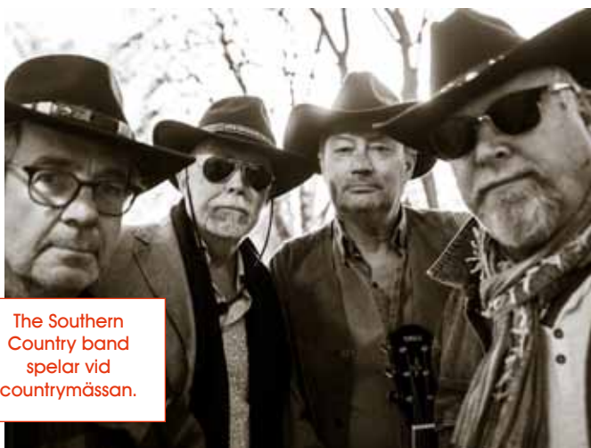
The Southern Country band spelar vid countrymässan.