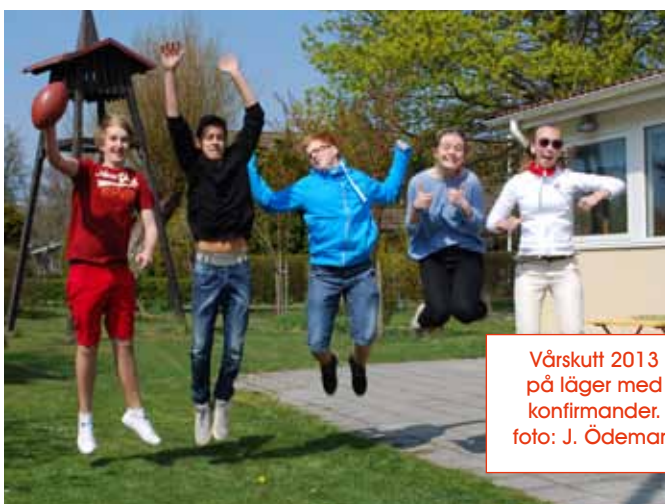
Vårskutt 2013 på läger med konfirmander.