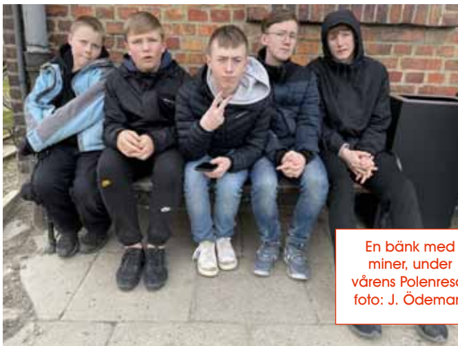
En bänk med miner, under vårens Polenresa.