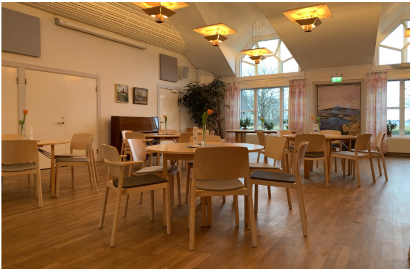
Billdals kyrka - församlingssalen.