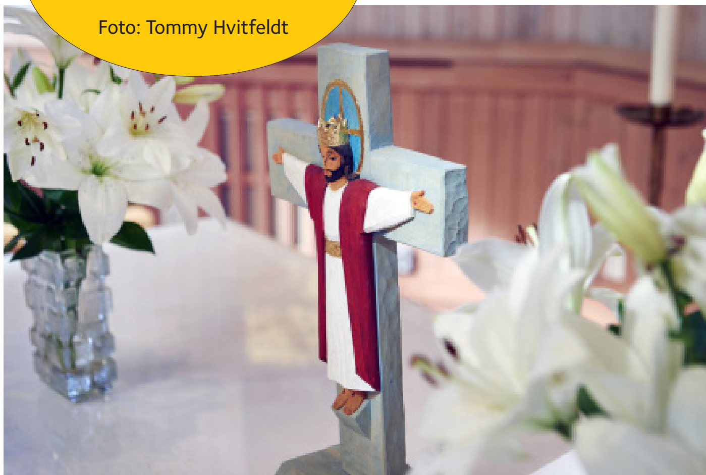
Billdals kyrka - altaret