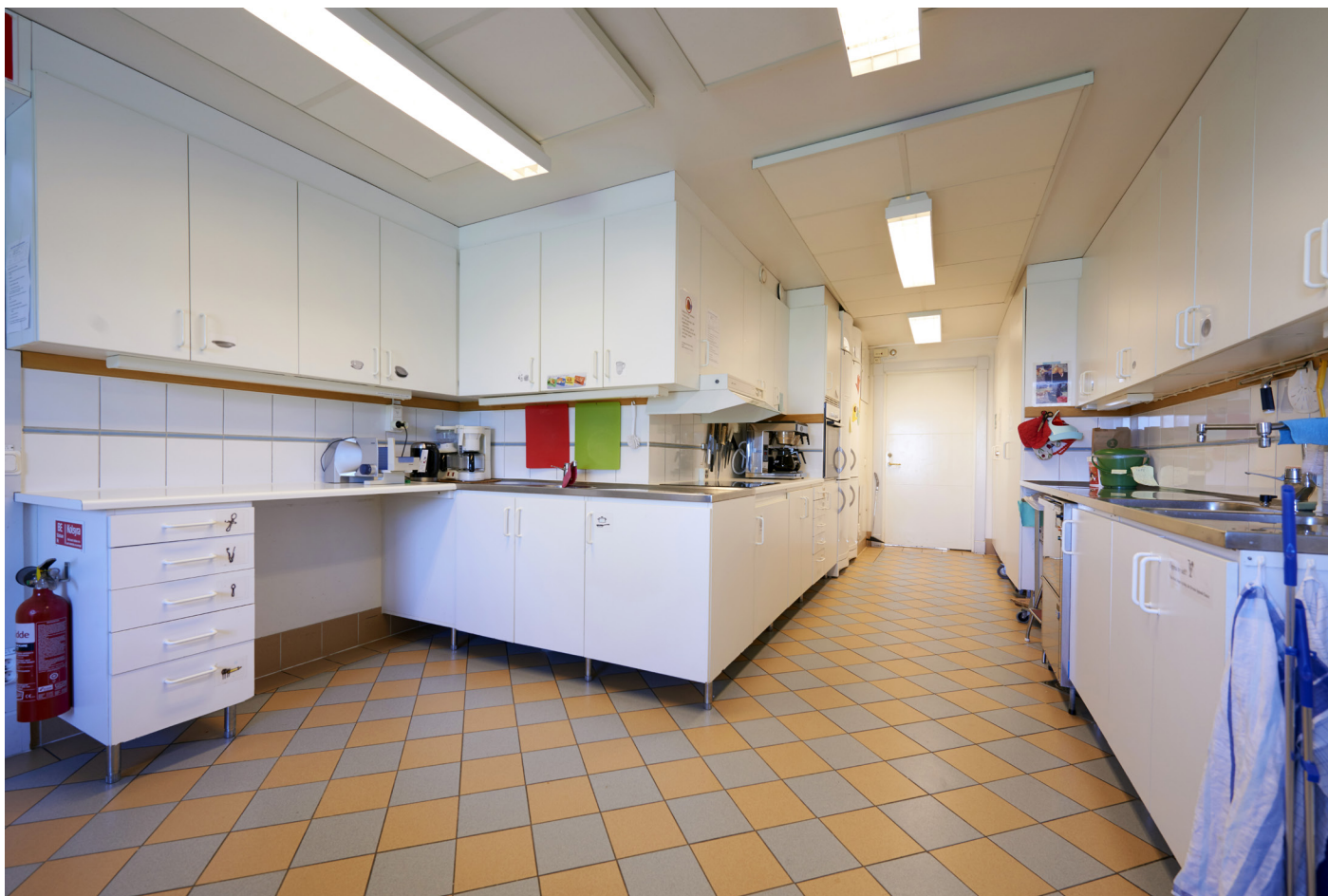
Billdals kyrka - kök