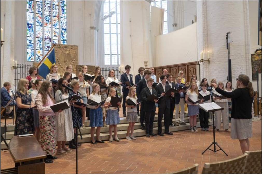
Svenska Gustaf-Adolfskören Hamburg & Ungdomskören Vox från Danderyd