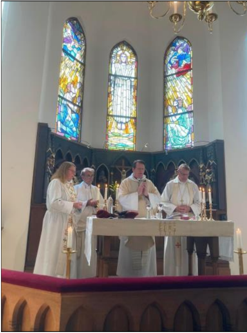
Högtidsmessa den 4 juni i Gustaf-Adolfskyrkan