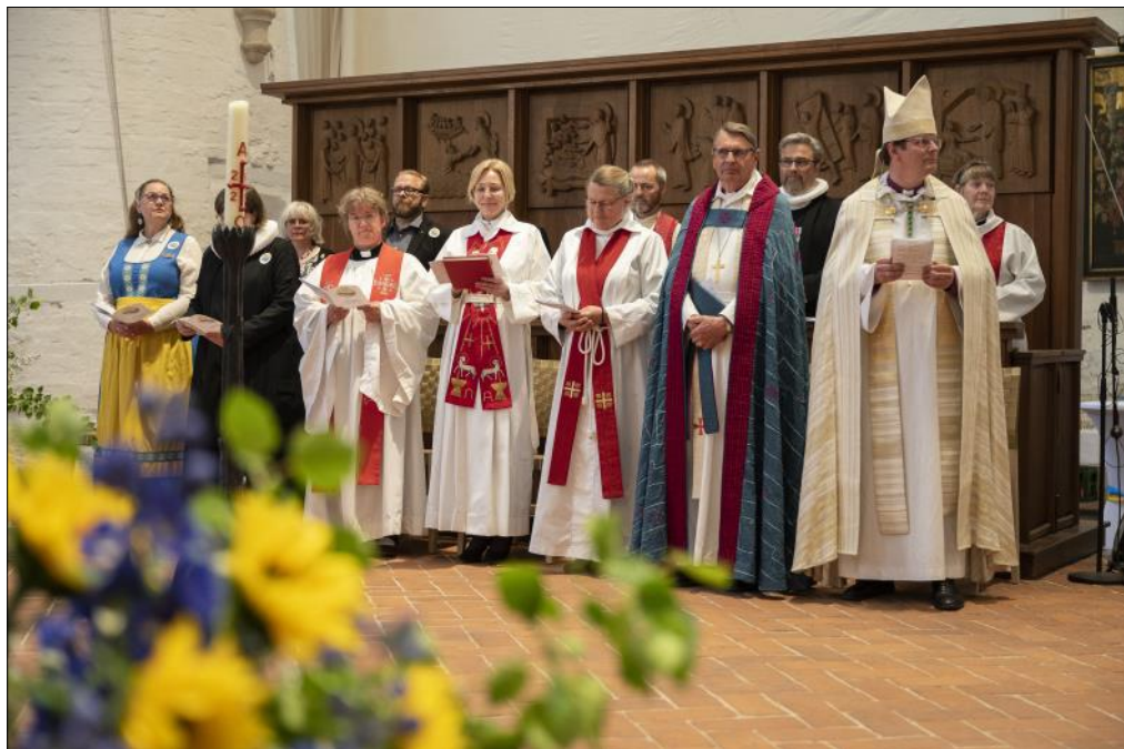
Stor prästskara: Våra nordiska grannar, den ekumeniska gemenskapen, biskopar och präster från Sverige