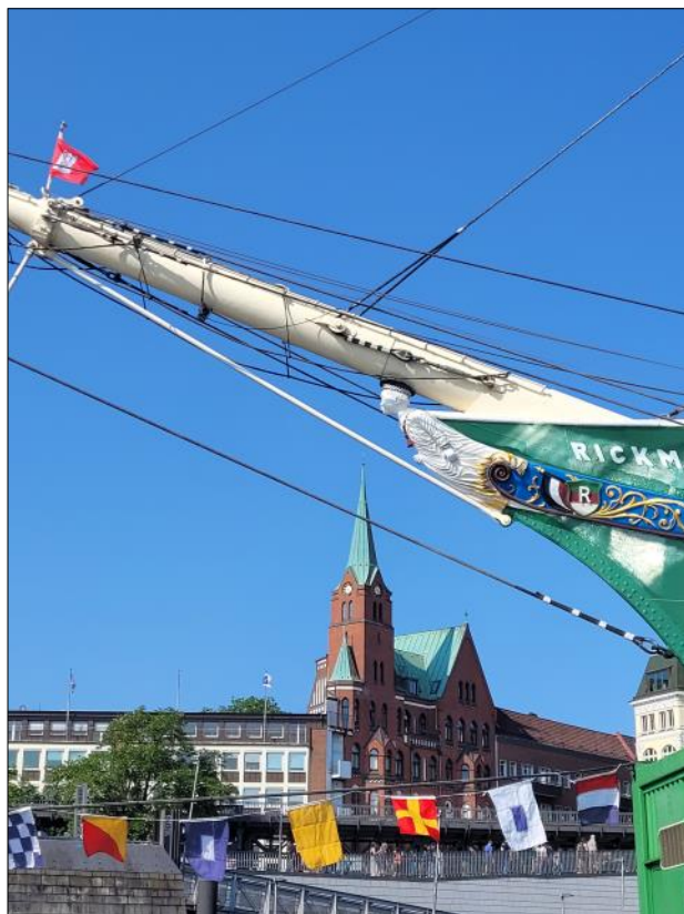
Gustaf-Adolfskyrkan. Vy från kajkanten.

Vi börjar med kort andakt kl. 12.30. Lunchen serveras ca kl. 13. Anmälan öppnar den 10 september 2023. Kontakt: hamburg@svenskakyrkan.se.