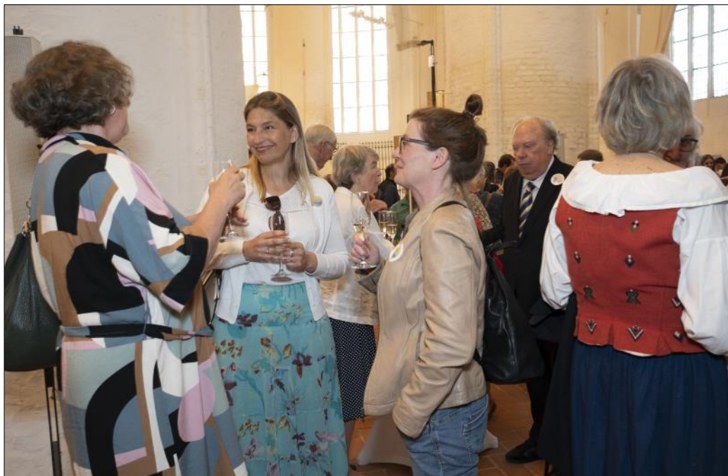
Så gott att träffas igen