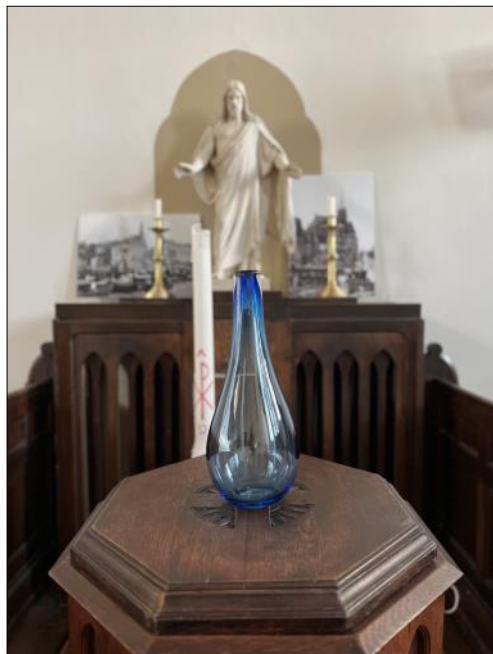
Jubileumsgåva från SKUT i Uppsala: Utlandskyrkans symbol, vattendroppen.