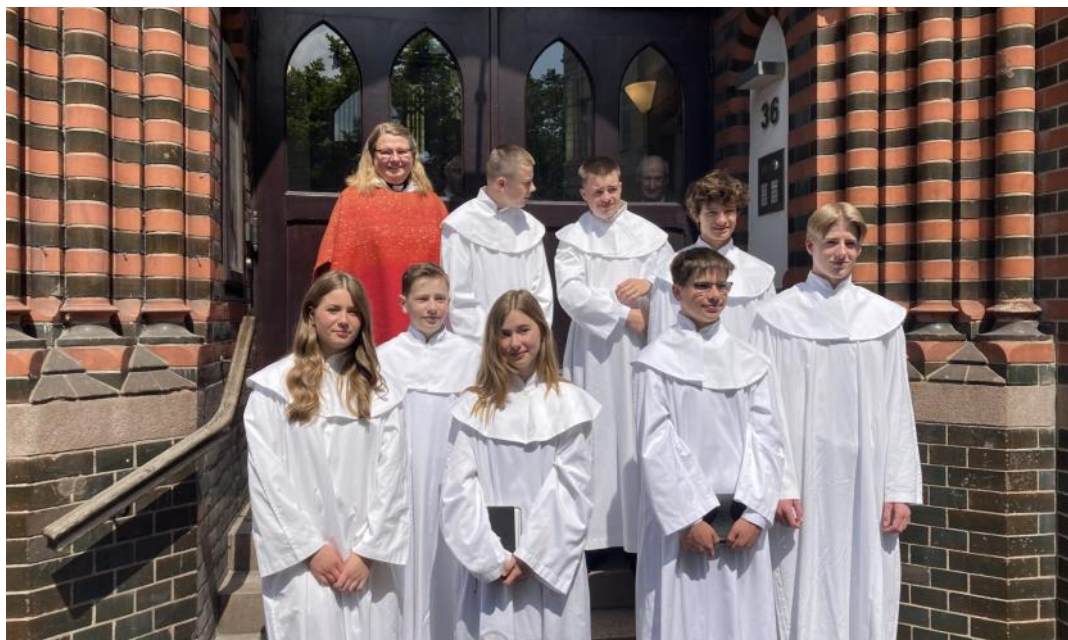
Våra konfirmander 2023