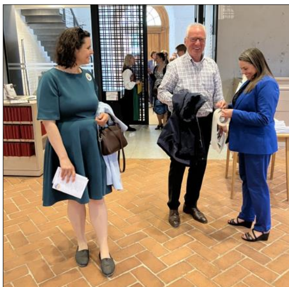
Glad stämning vid entrén av Hauptkirche St. Katharinen