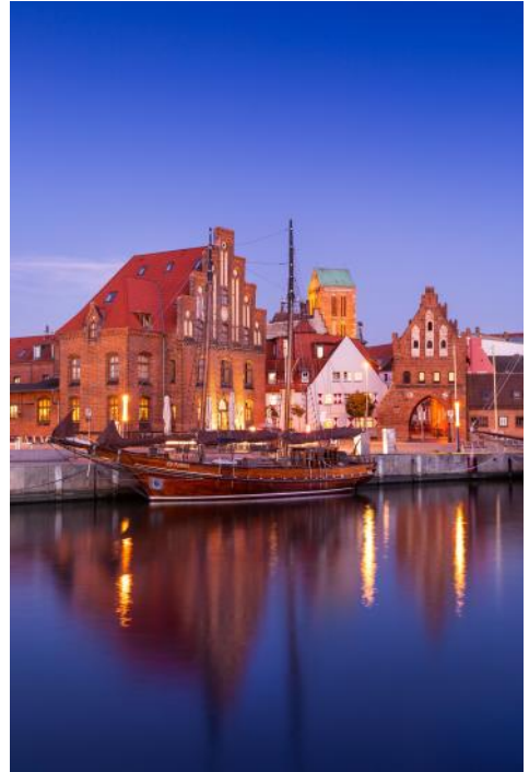
Alter Hafen in Wismar, Abendstimmung

Anmäl dig till katrin.tautermann@t-online.de . Då antalet platser är begränsade är det först till kvarn som gäller.