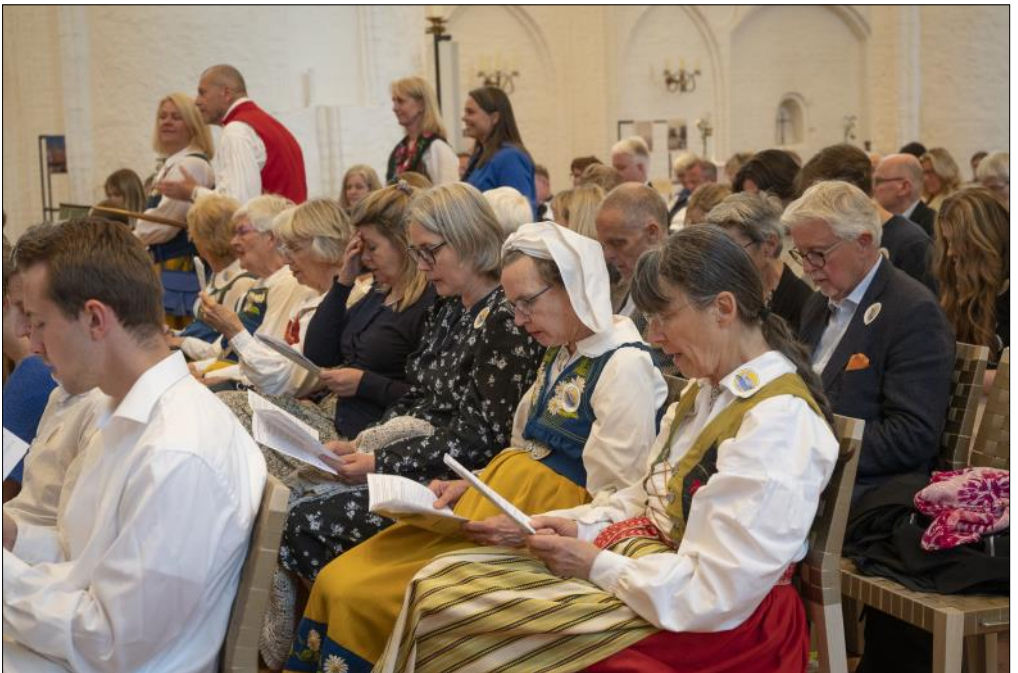
Församlingen sjunger svenska psalmer - många kommer i dräkt