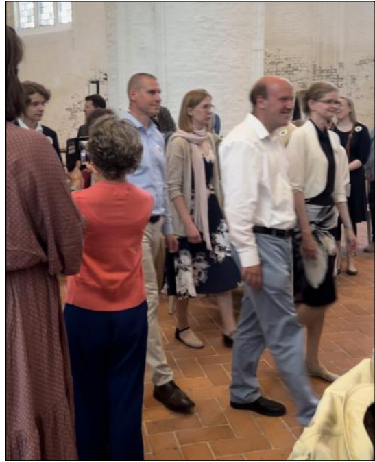
Svenska kyrkan i Hamburgs kör på intågande