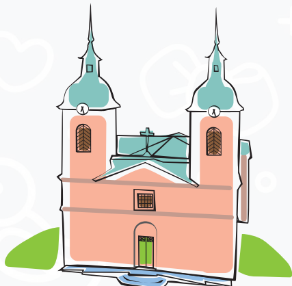
Sofia Albertina kyrka