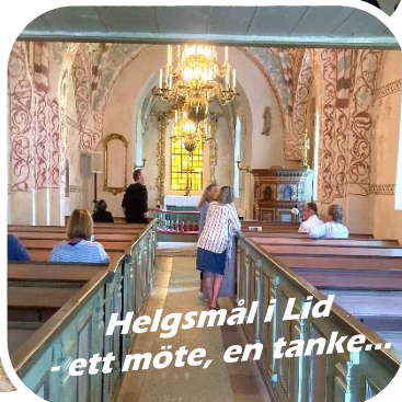
Helgsmål i Lid - ett möte, en tanke...