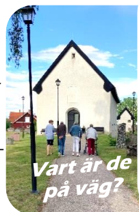
Vart är de på väg?