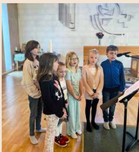
Gudstjänst för små & stora, Mixkören, Barn & Unga och servering söndag 1 oktober kl 10.00 Olofströms kyrka