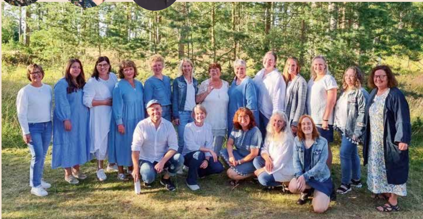
Gospelkonsert "New Life Gospel" söndag 24 september kl 18.00 Jämshögs kyrka