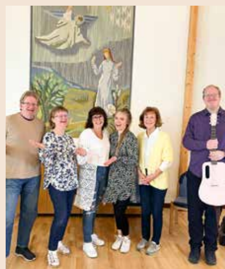
Mässa, Lovsångsgruppen söndag 22 oktober kl 10.00 Jämshögs kyrka