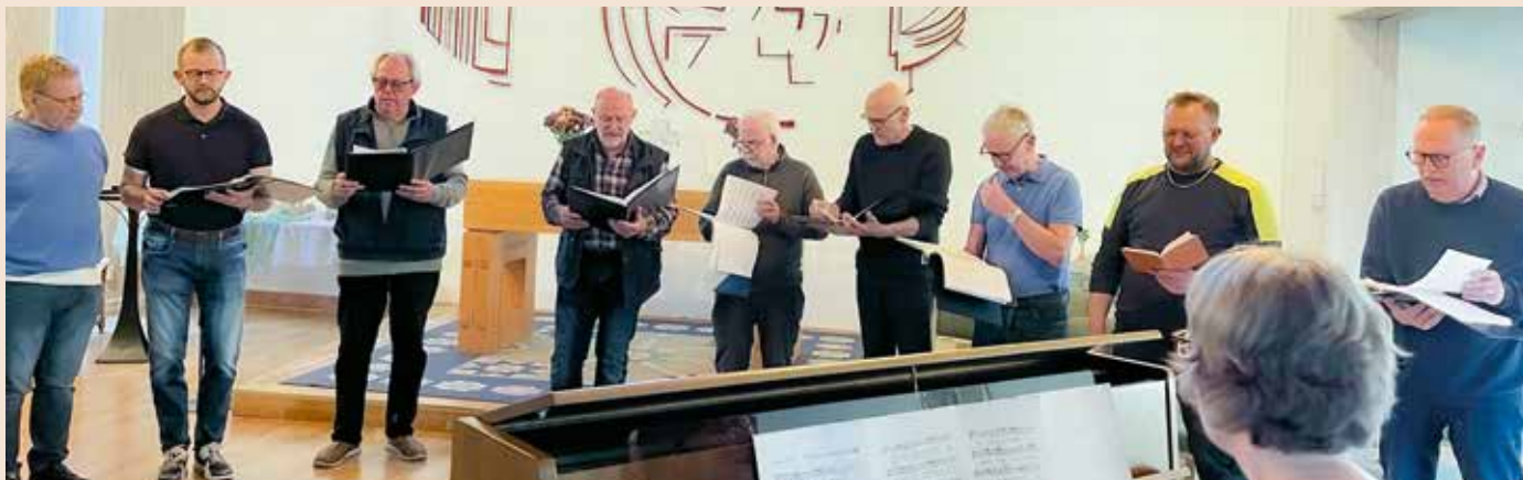
Gudstjänst, Holje Boys/Caprice söndag 29 oktober kl 10.00 Olofströms kyrka