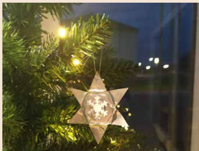
Gudstjänst för små & stora, kyrkokör, trumpet, barn & familj, diakonin

söndag 3 december, 1:a Advent, kl 10.00 Jämshögs kyrka