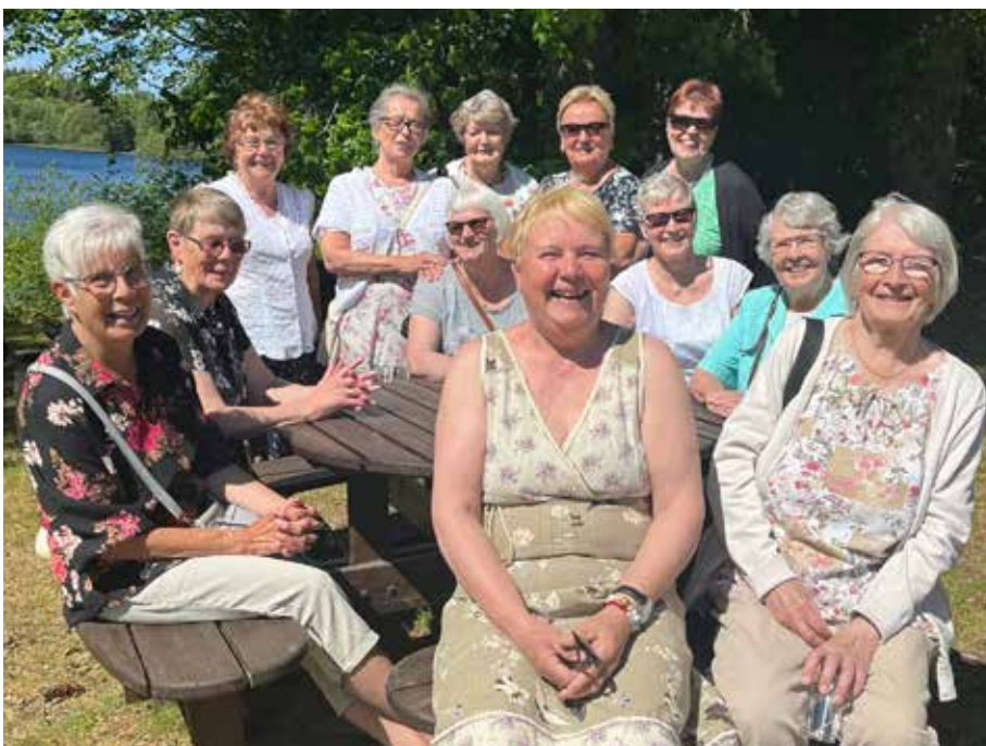
Finska daglediga på besök i Södra Hoka

ja ensimmäinen jumalanpalvelus on 24/9 kl.12.00 Olofströmin kirkolla.