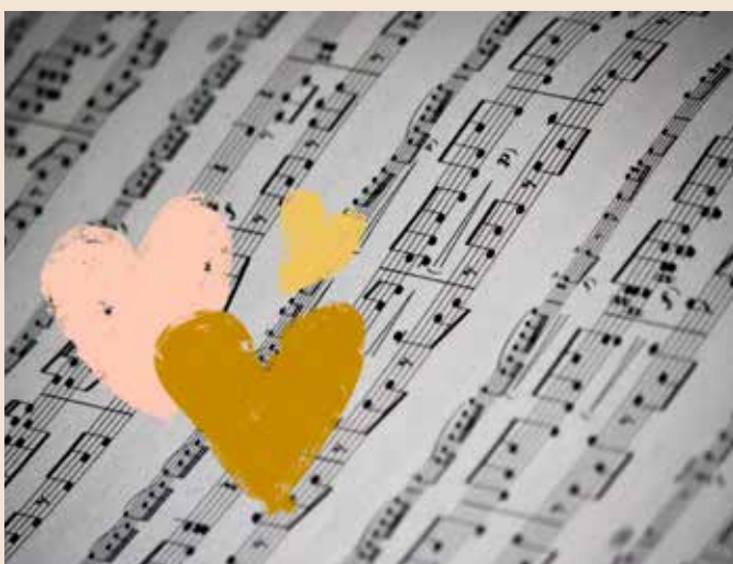
Gudstjänst med önskesånger söndag 12 november kl 10.00 Olofströms kyrka