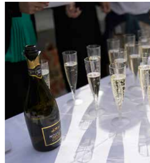
Alkoholfritt bubbel förgyllde eftermiddagen.