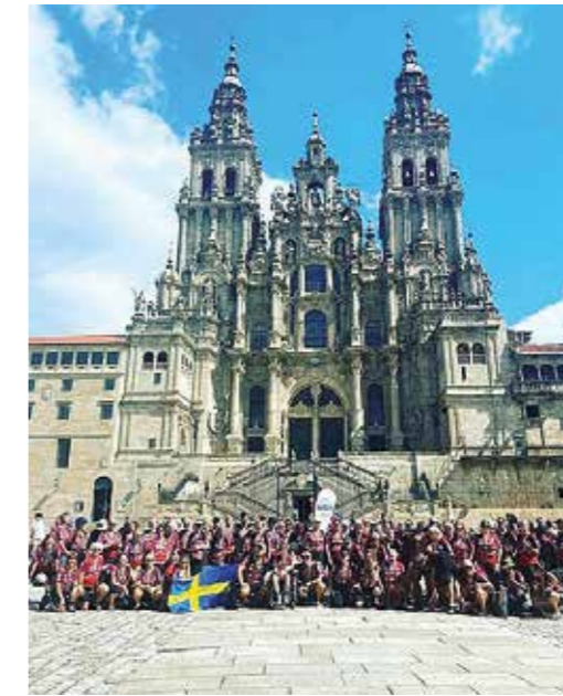
Efter avslutad pilgrimsvandring 2022. Deltagare i samtliga grupper från Walk4Life framför katedralen.