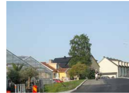
Handelsträdgård och nybyggnation sida vid sida i Ormbacka.