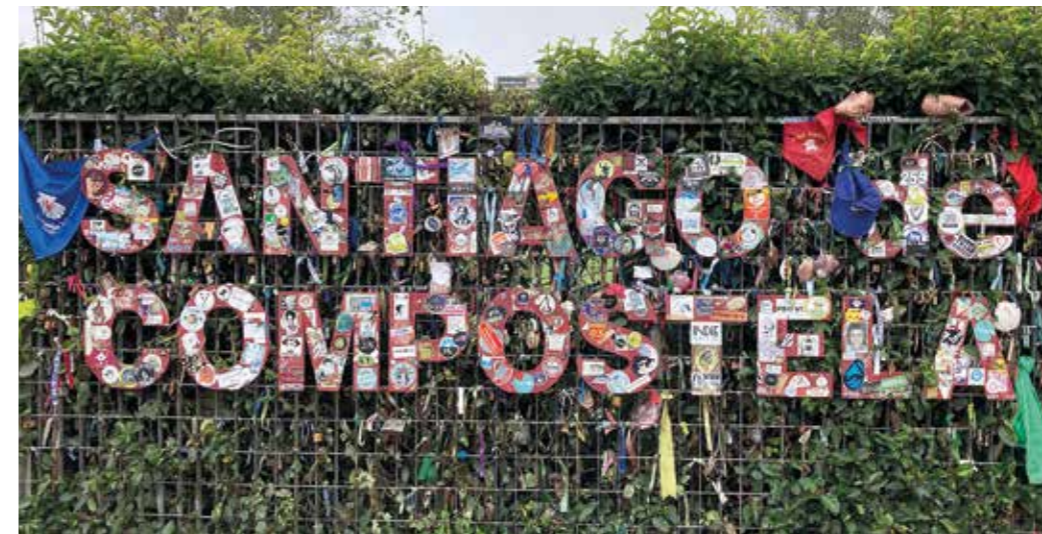
Skylt visar att målet är uppnått.