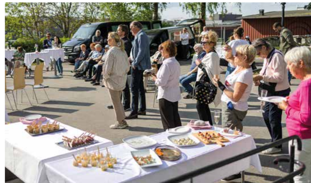
Uppdukade läckerheter från församlingens cateringföretag. Deltagarna lät sig väl smaka och lyssnade intresserat på talarna.