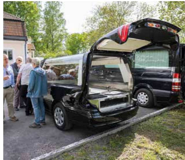
Demonstration av transportbilar för kistor.