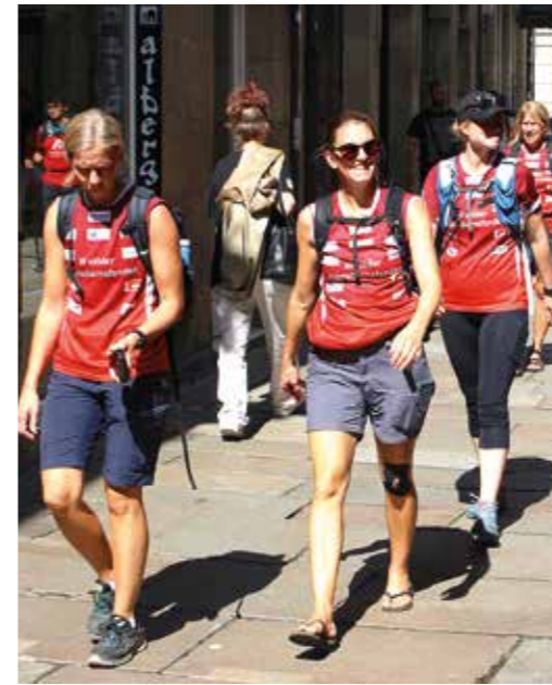
Pilgrimsvandrare på väg.